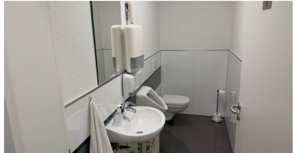
WC Anlagen Herren & damen