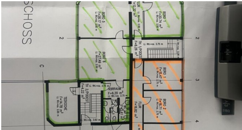
Grundriss OG neu