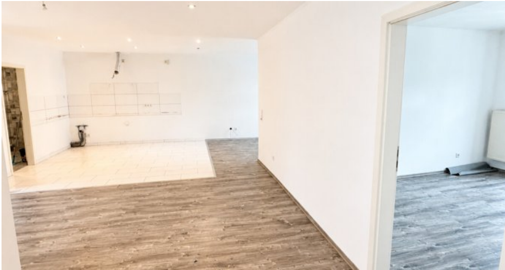
OG Wohn-oder Gewerbefläche