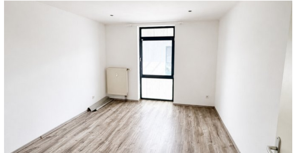
OG Wohn-oder Gewerbefläche