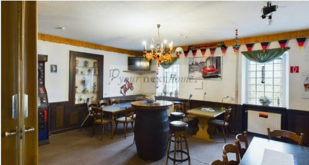
Gaststätte kleiner Nebenraum