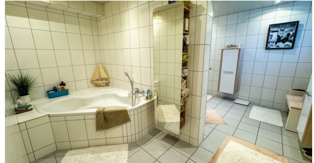
Bad Wohnung 1.OG