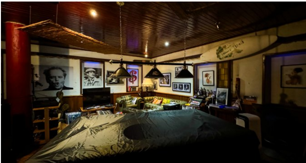
Ehemalige Gaststätte Kellergeschoss