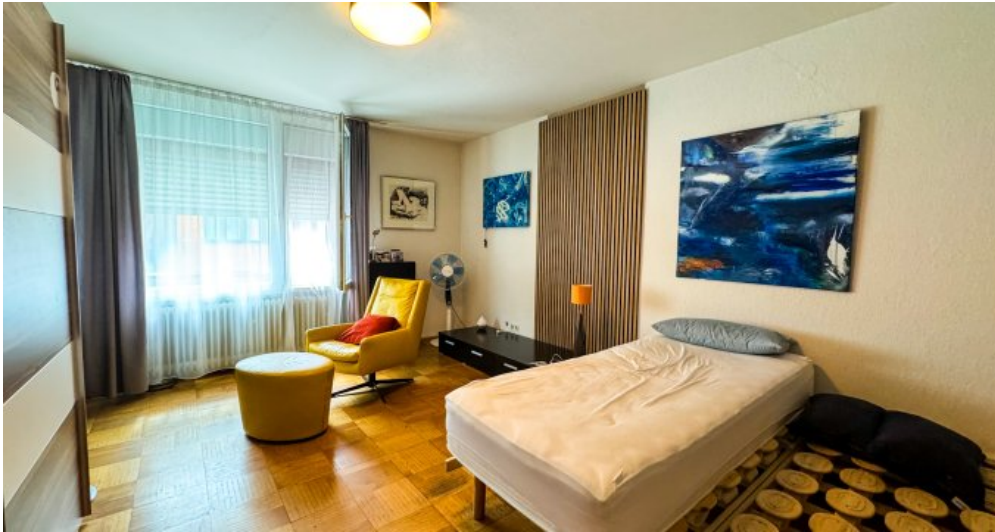
Schlafzimmer Wohnung 1.OG