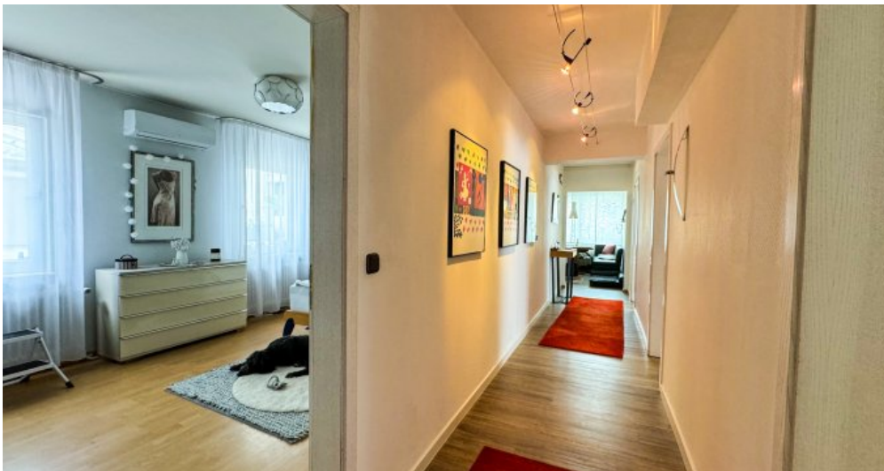
Flur Wohnung 1.OG