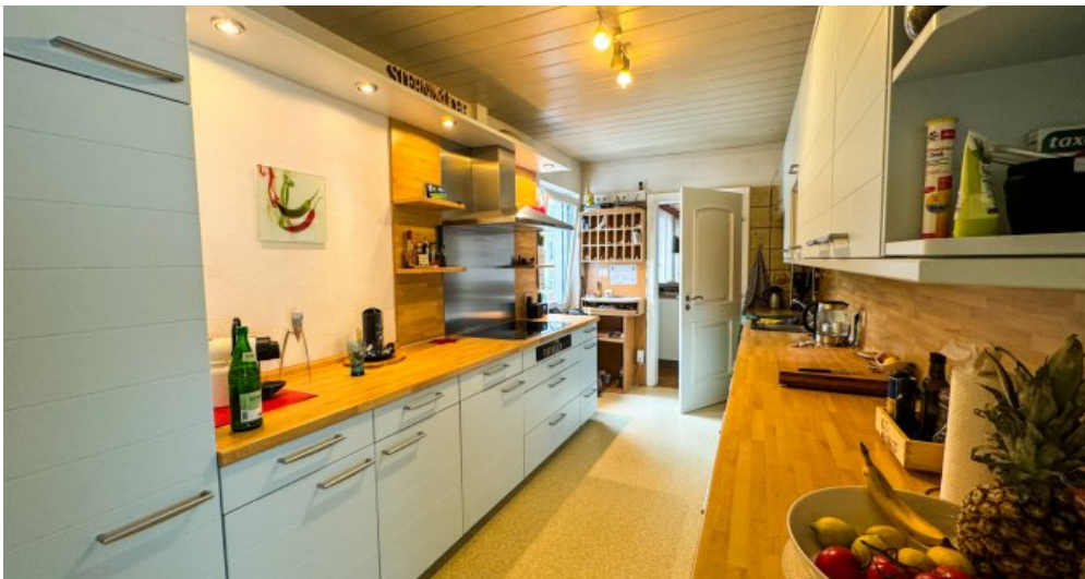
Küche Wohnung 1.OG