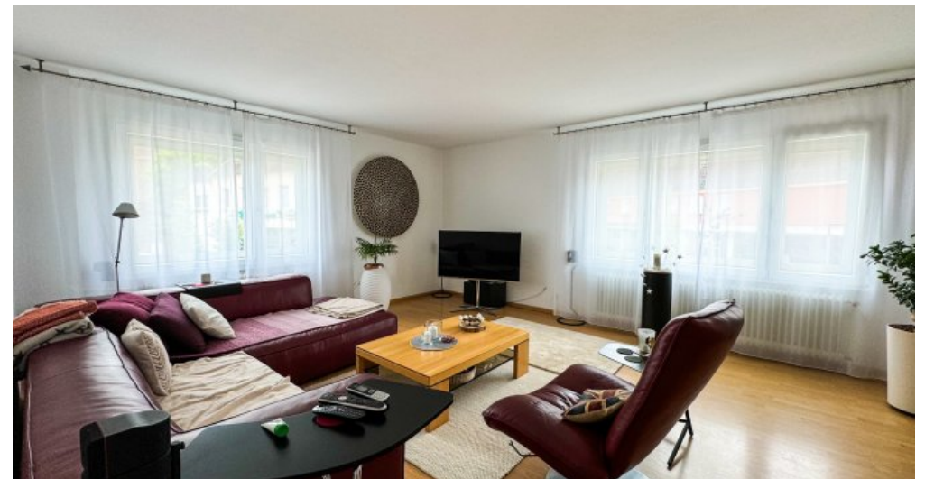
Wohnzimmer Wohnung 1.OG