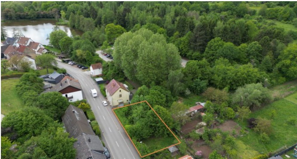
Design ohne Titel