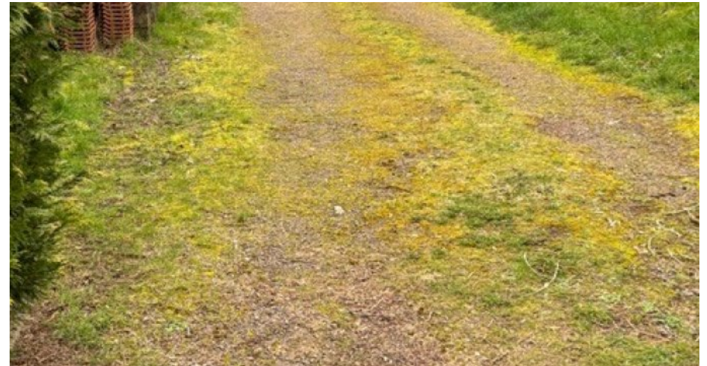
Zufahrt zum Grundstück