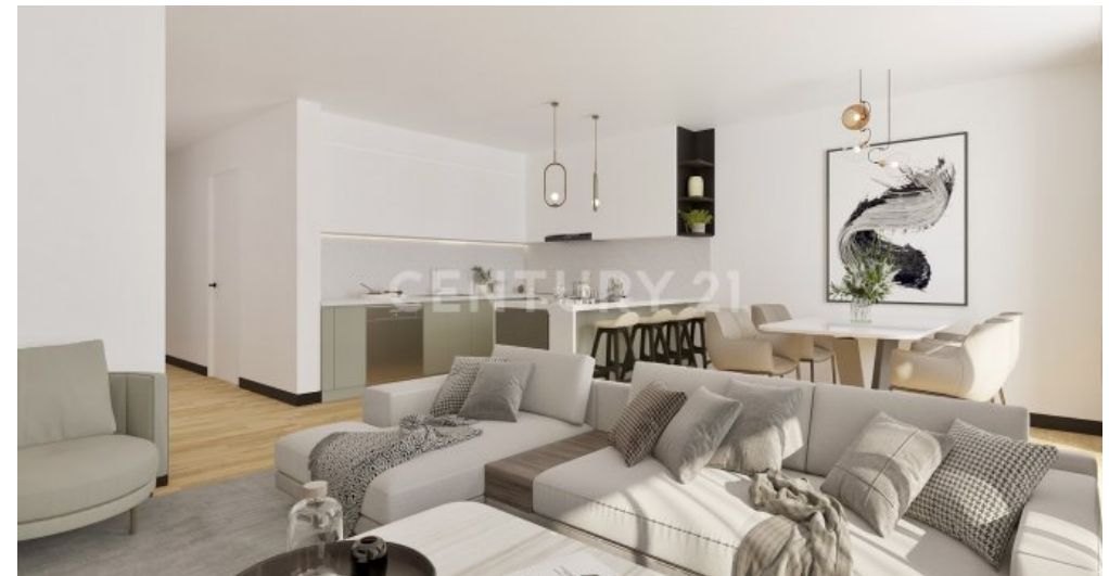
Wohnung 08 EG (2)