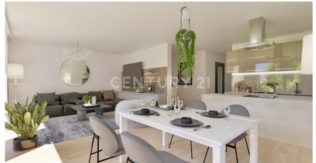
Wohnung 01 - UG (3)