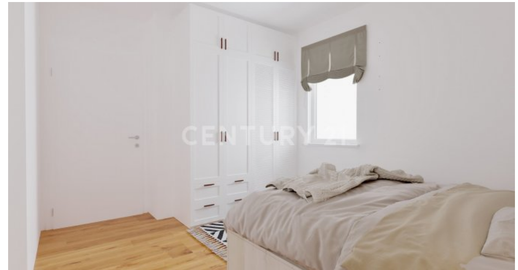
Wohnung 11 (6)