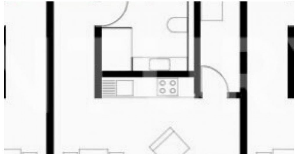
Bildschirmfoto-2024-10-27-um-23.15.32 - Copy