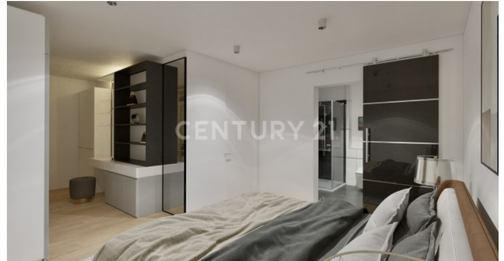
Wohnung 01 - UG (5)