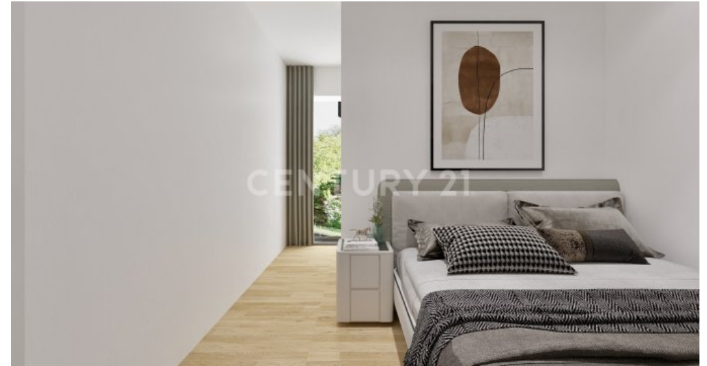
Wohnung 08 EG (4)