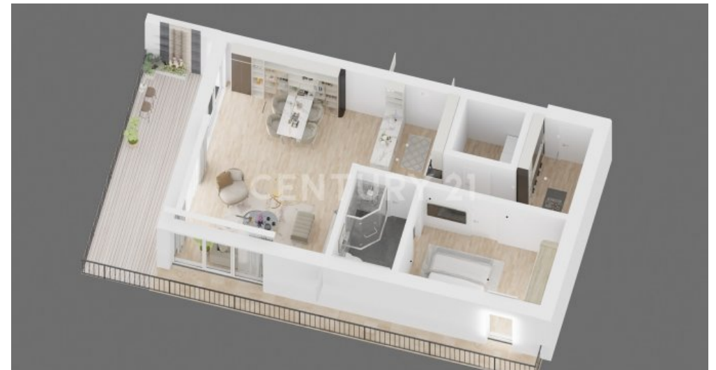
Wohnung 19 (9)