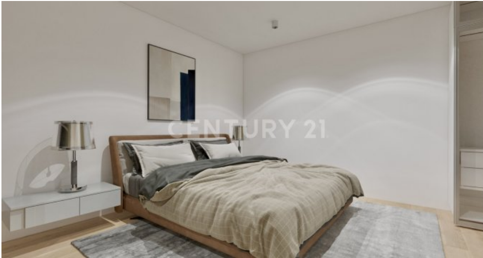
Wohnung 01 - UG (4)