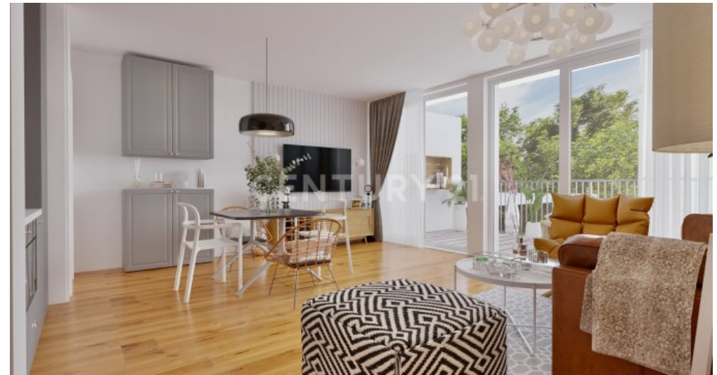
Wohnung 11 (2)