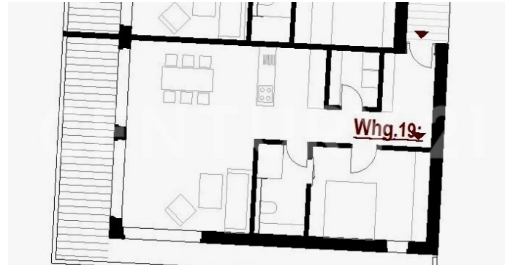
210429_OTW_KO_Plansatz_VAR-Laubengang conv 9 - Copy