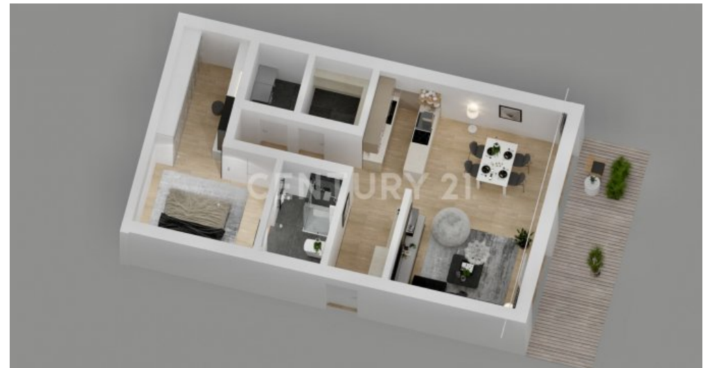
Wohnung 01 - UG (7)