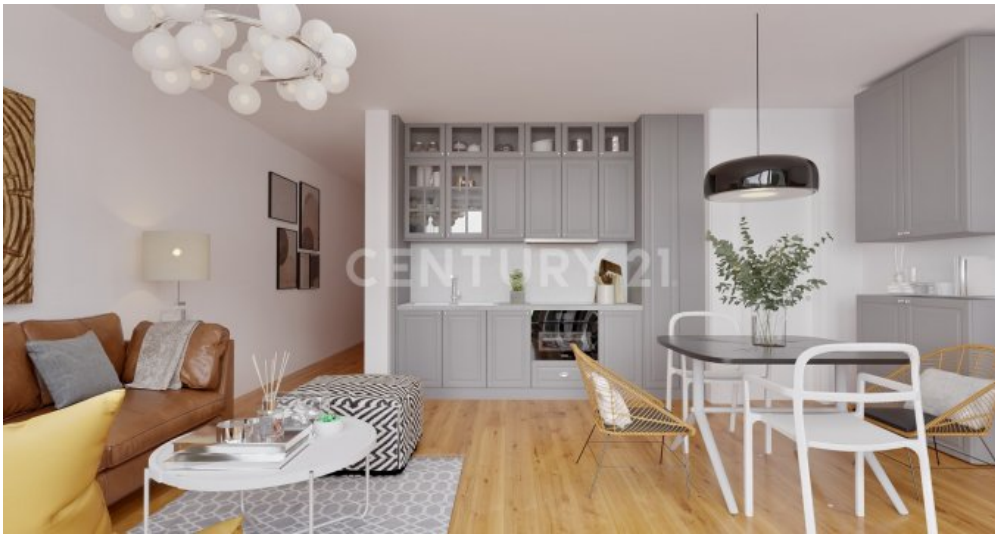
Wohnung 11 (1)