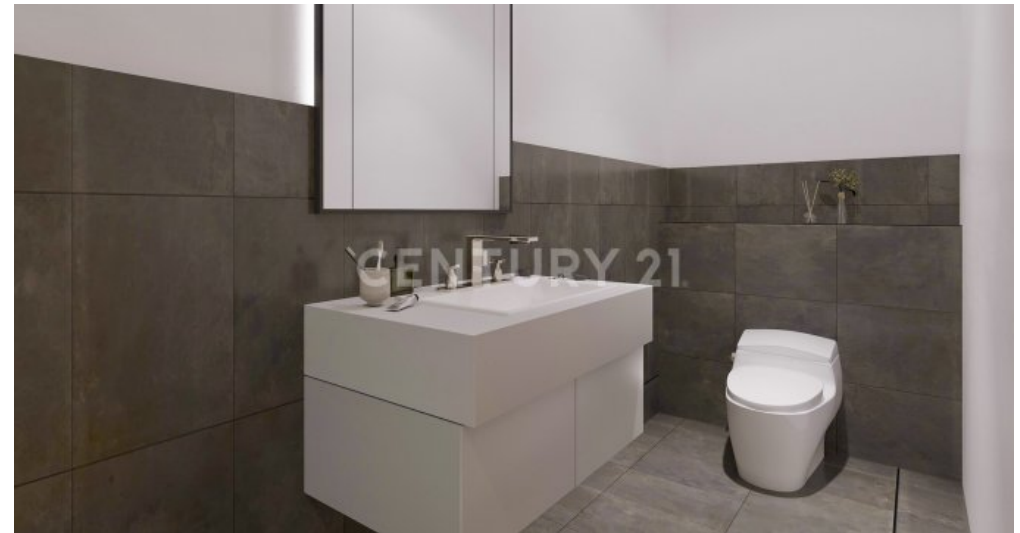
Wohnung 08 EG (8)