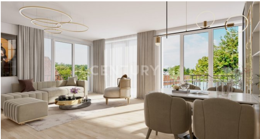
Wohnung 19 (1)