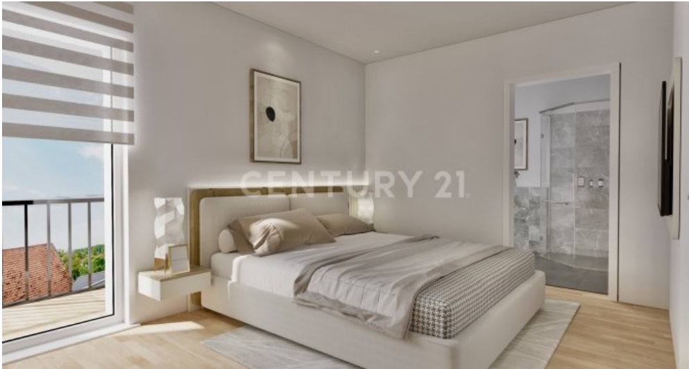
Wohnung 19 (6)