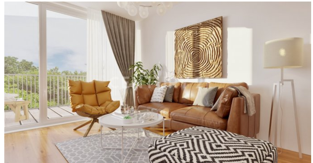
Wohnung 11 (4)