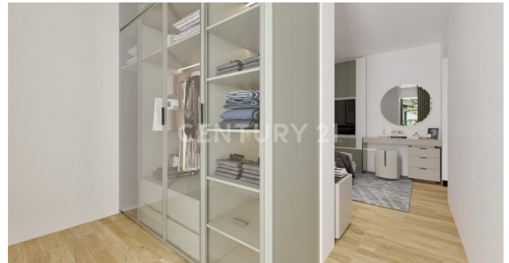
Wohnung 08 EG (6)