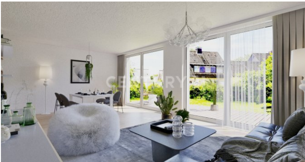
Wohnung 01 - UG (1)