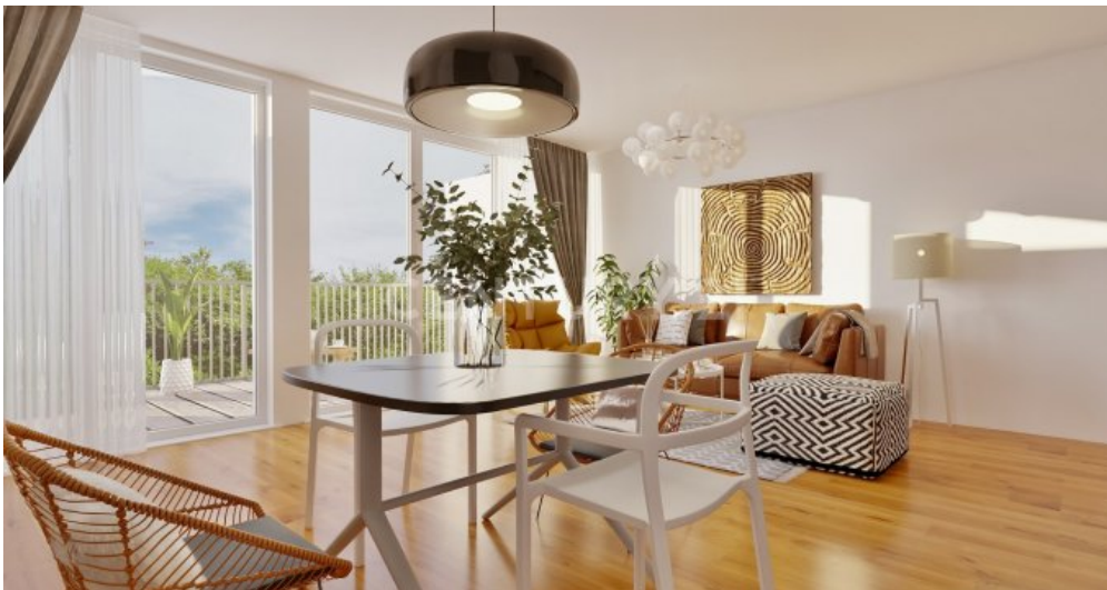
Wohnung 11 (3)