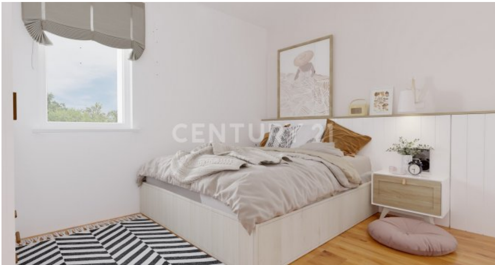
Wohnung 11 (5)