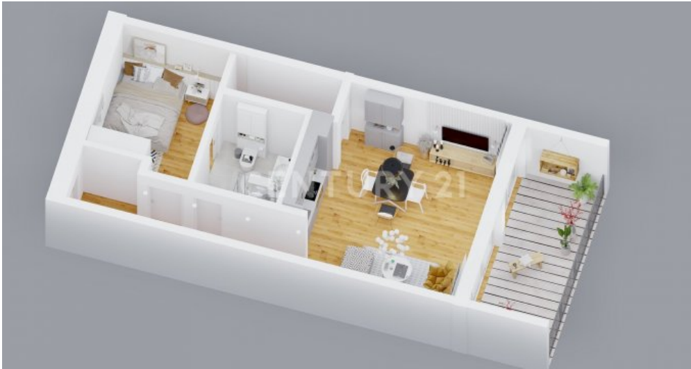
Wohnung 11 (9)