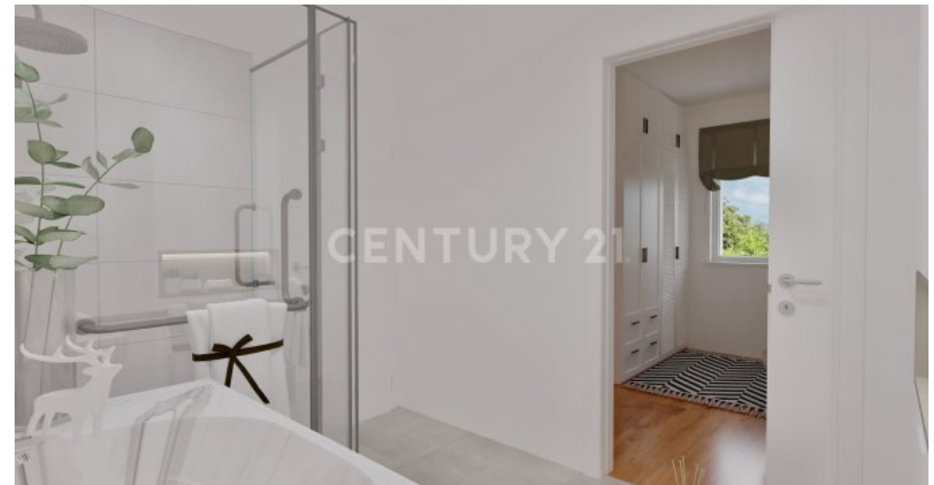
Wohnung 11 (8)