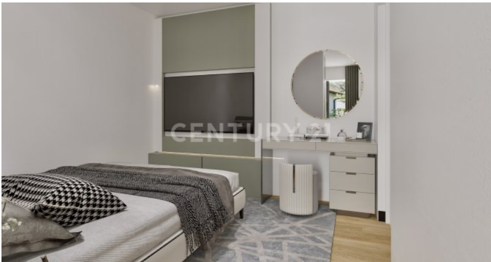
Wohnung 08 EG (5)