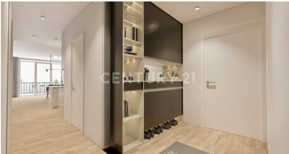
Wohnung 19 (8)