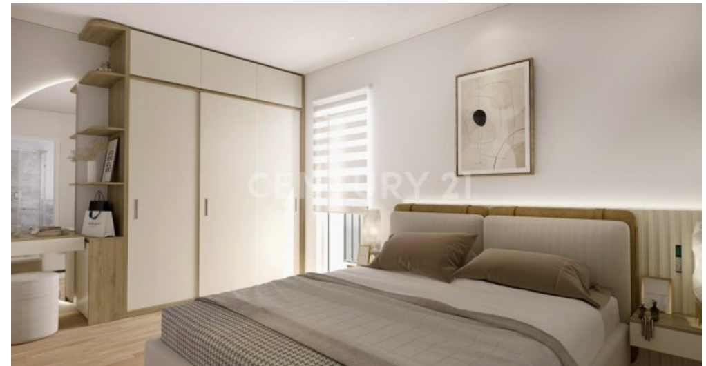
Wohnung 19 (5)