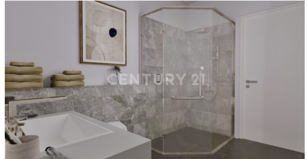
Wohnung 19 (7)