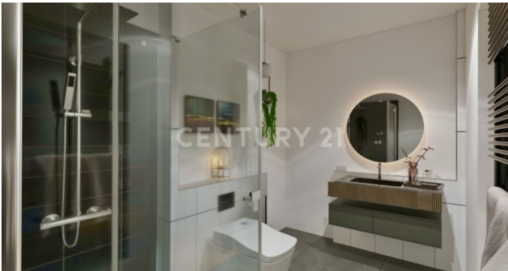
Wohnung 01 - UG (6)