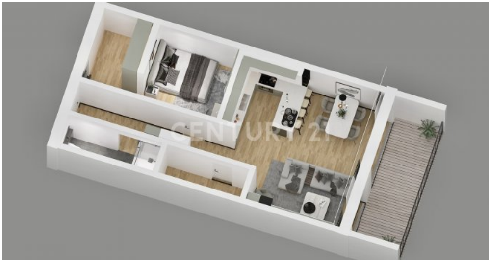
Wohnung 08 EG (9)