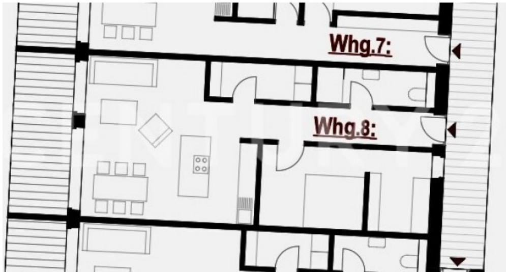
Bildschirmfoto-2024-10-27-um-23.16.20 - Copy