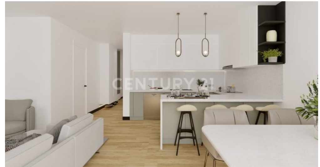
Wohnung 08 EG (1)