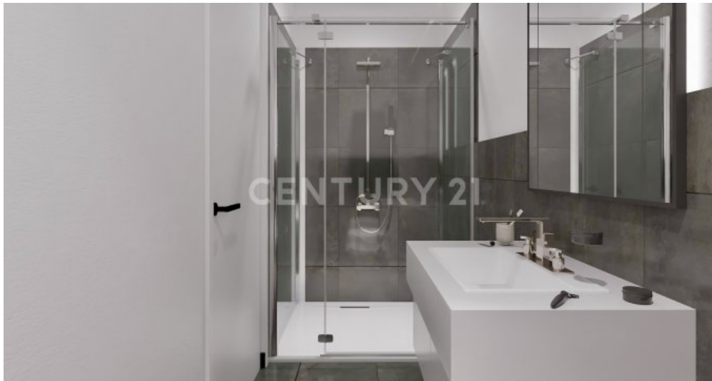
Wohnung 08 EG (7)