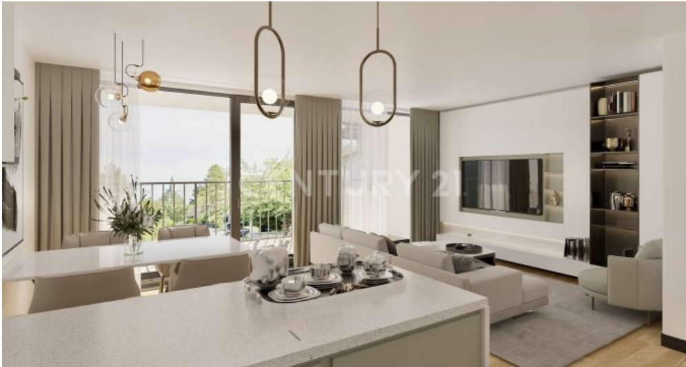
Wohnung 08 EG (3)