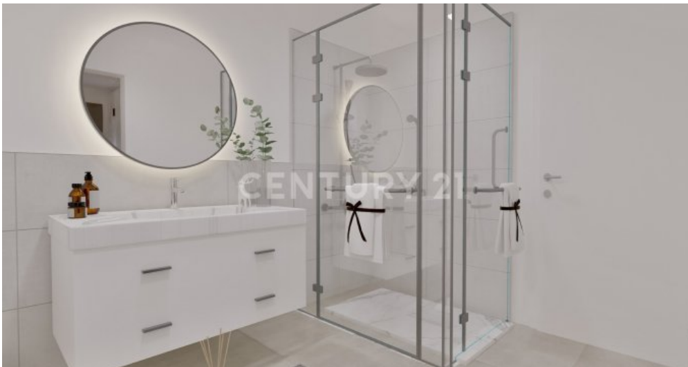
Wohnung 11 (7)