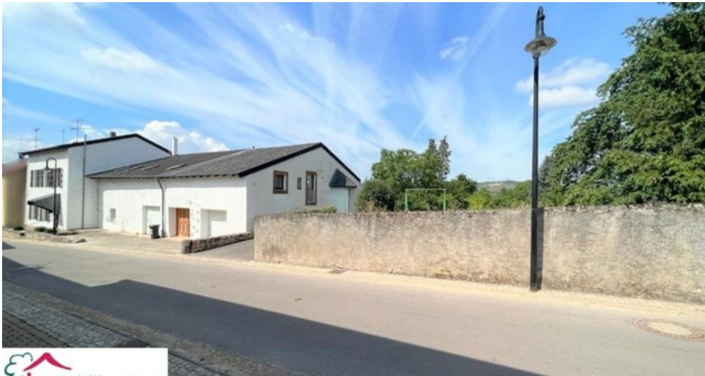
Vorderansicht: Haus + Anbau + Baugrundstücke