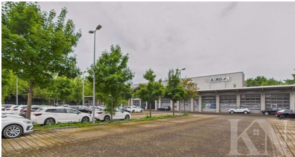
Parkplatz und Frontansicht