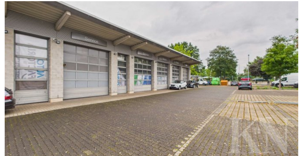
Garagen / Tore