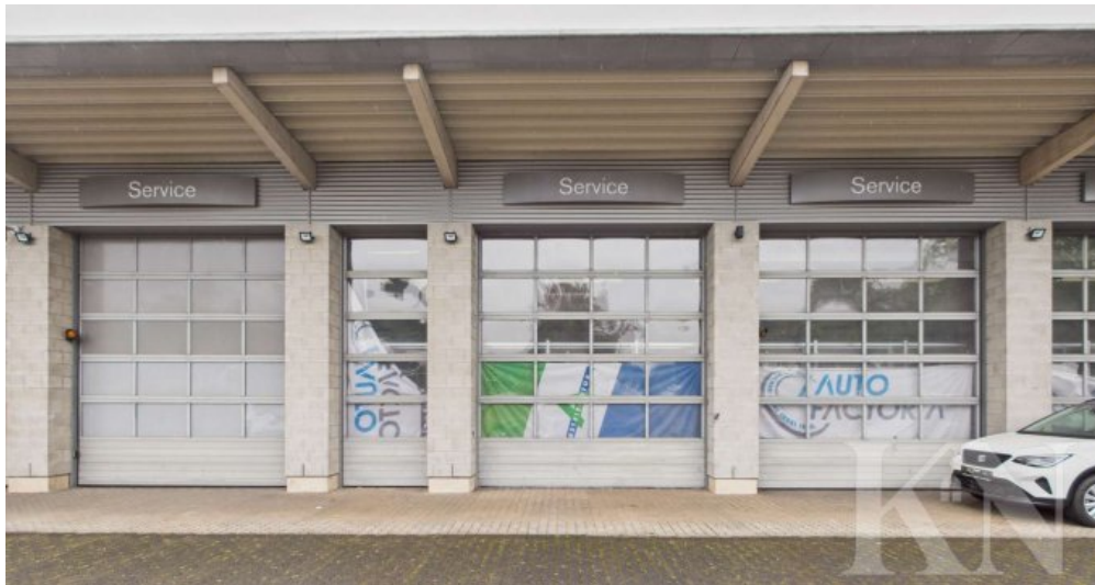
Garagen / Tore