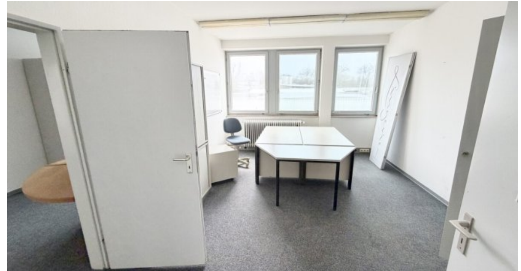
OG Büro 1