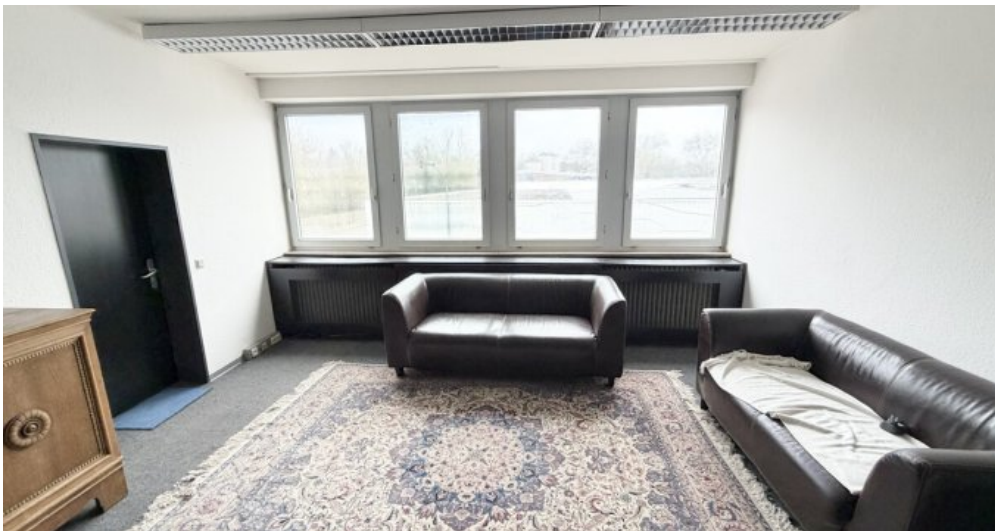
OG Büro 2