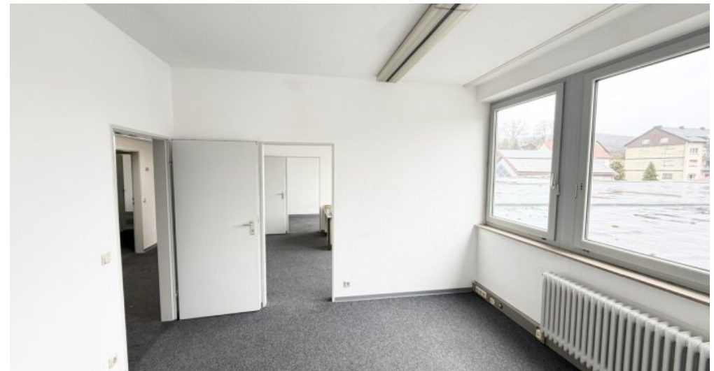
OG Büro 3