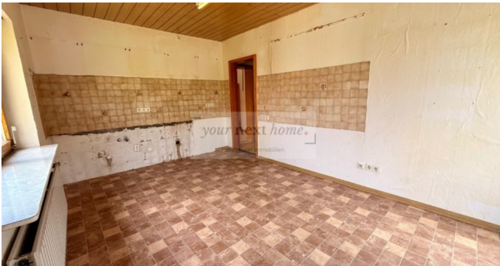
Küche OG mit Ausgang zur Terrasse