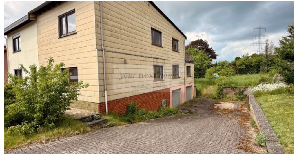
große breite Einfahrt zur Doppelgarage