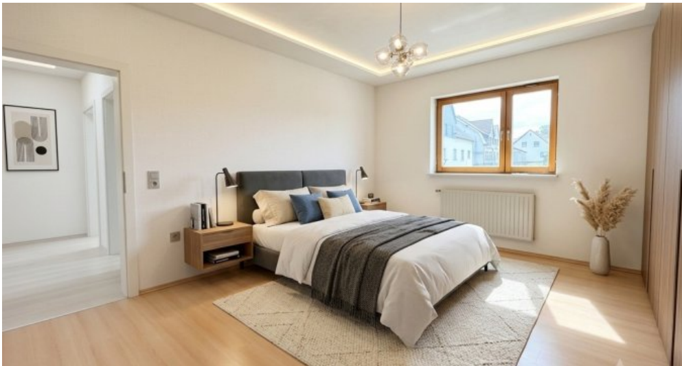
Schlafzimmer OG visualisiert