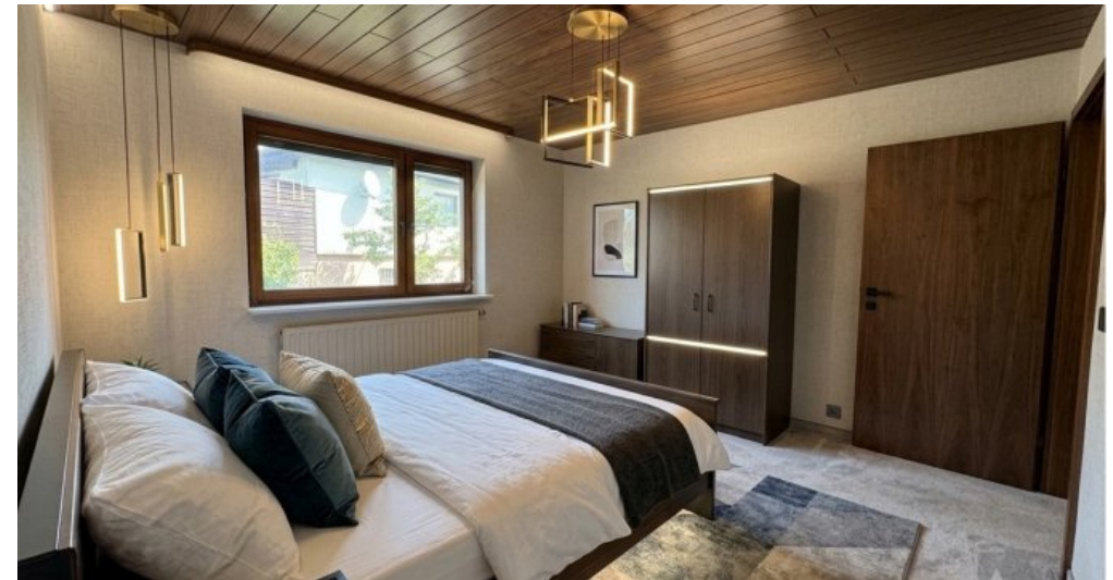
Schlafzimmer EG visualisiert