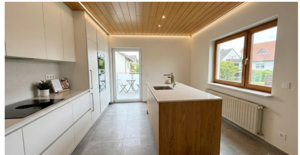
Küche OG visualisiert