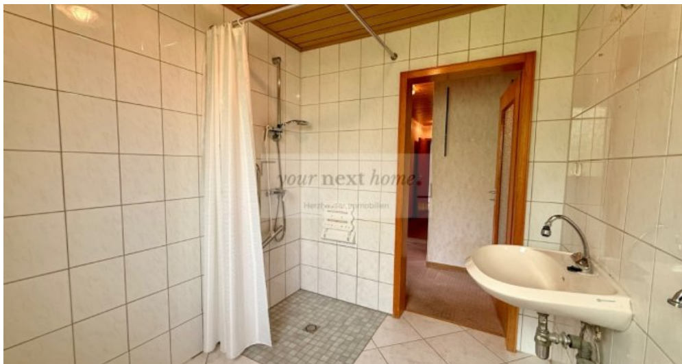
Duschbad mit Tageslicht EG