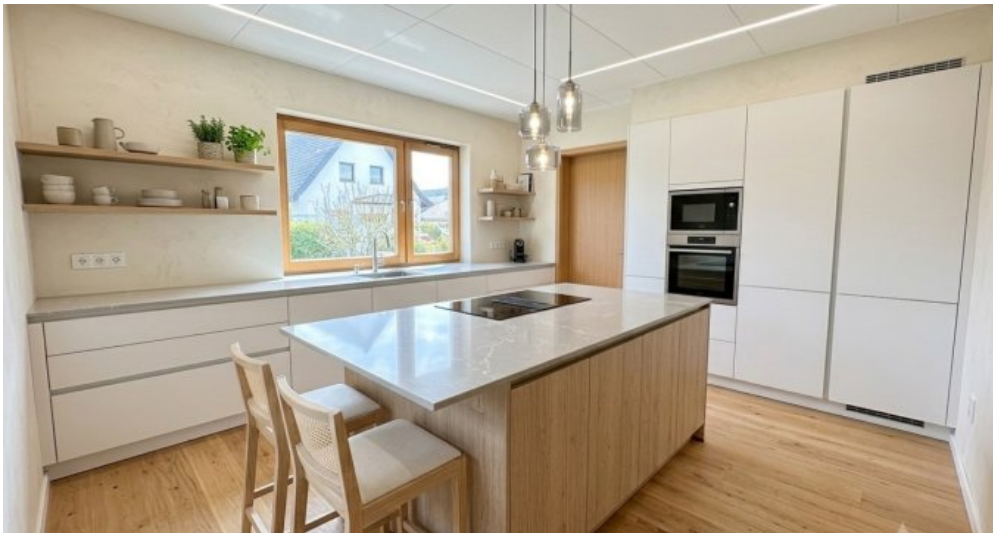
Küche EG visualisiert