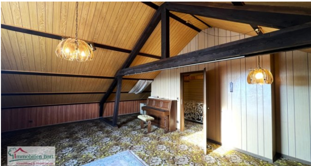
DG - Schlafzimmer