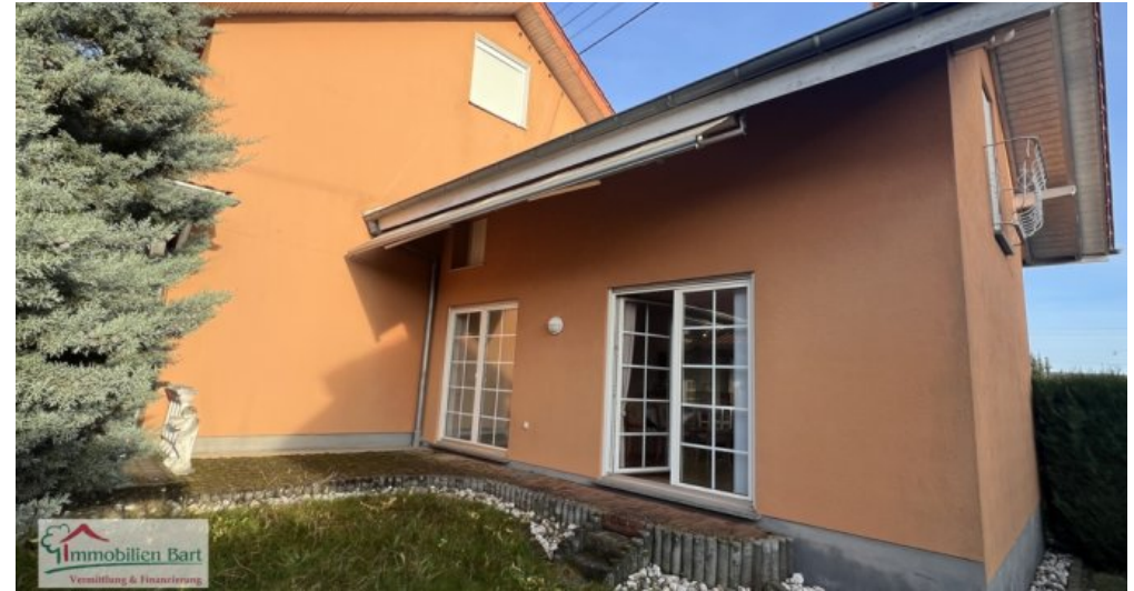
Anbau - Gartenansicht