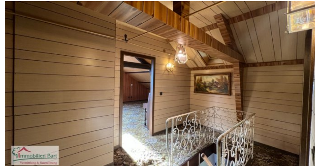
DG - Diele