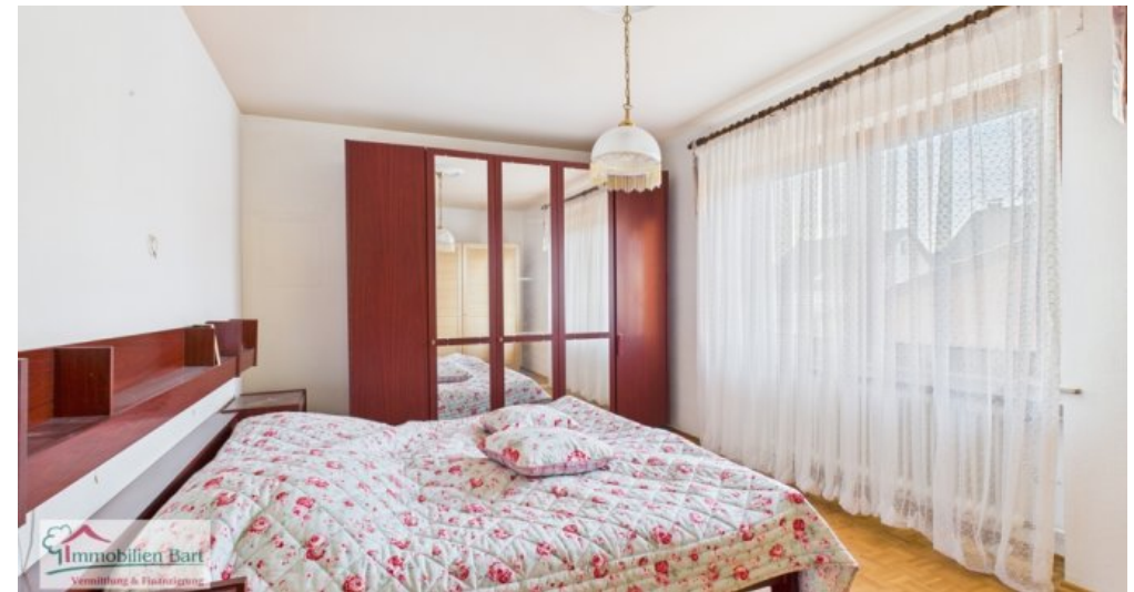
OG - erstes Schlafzimmer