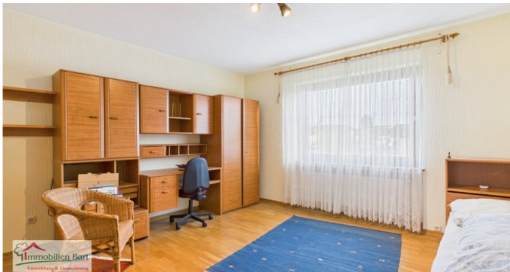
OG - Kinderzimmer