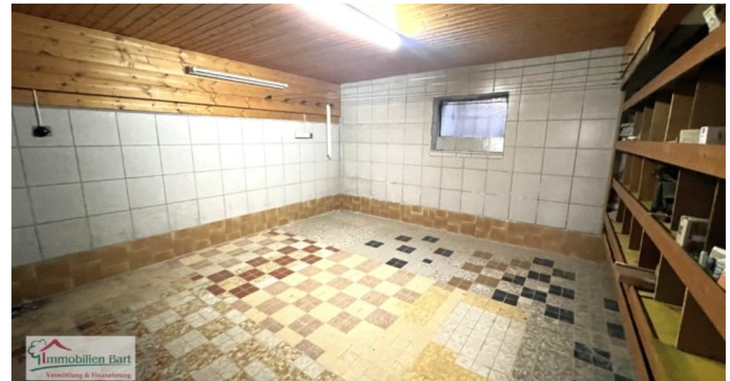
KG - Werkstatt