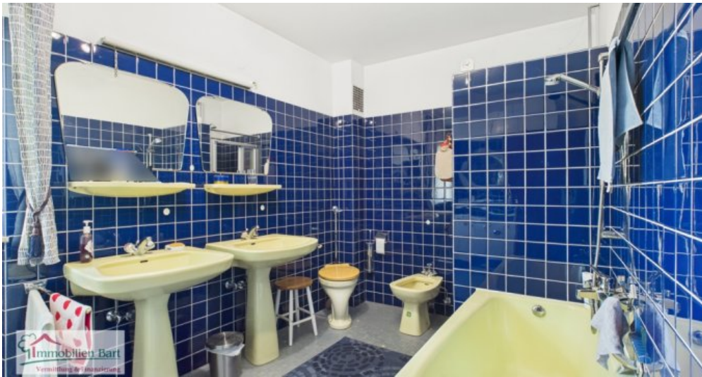
OG - Badezimmer