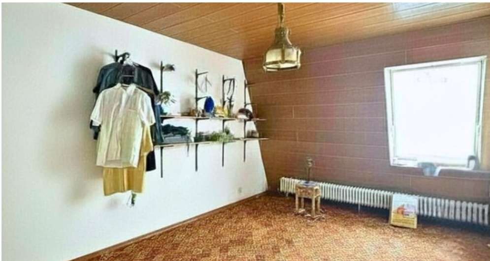
Kinderzimmer 2 2.OG