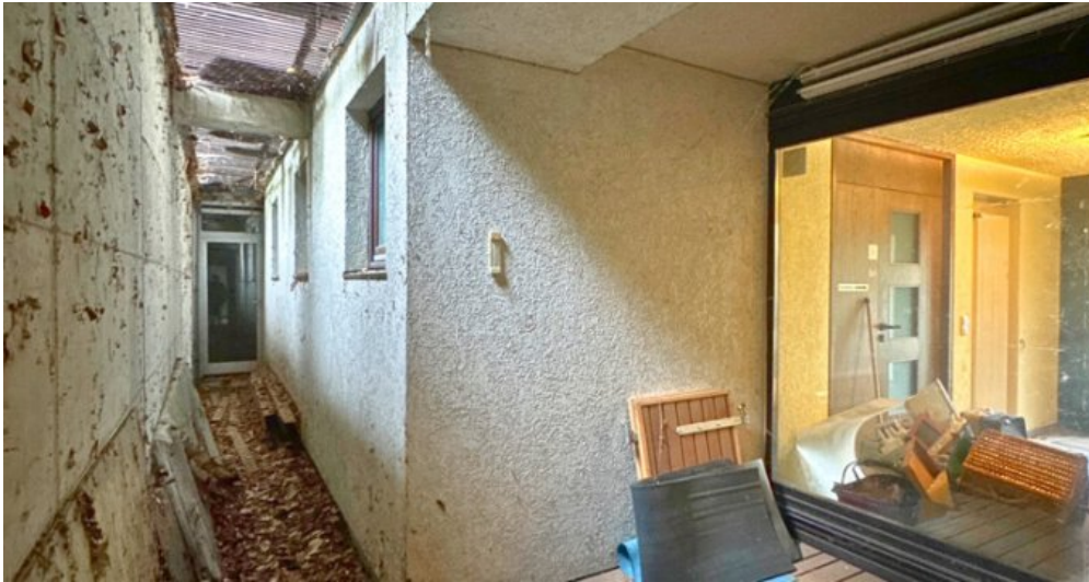
Whirlpool Ecke EG