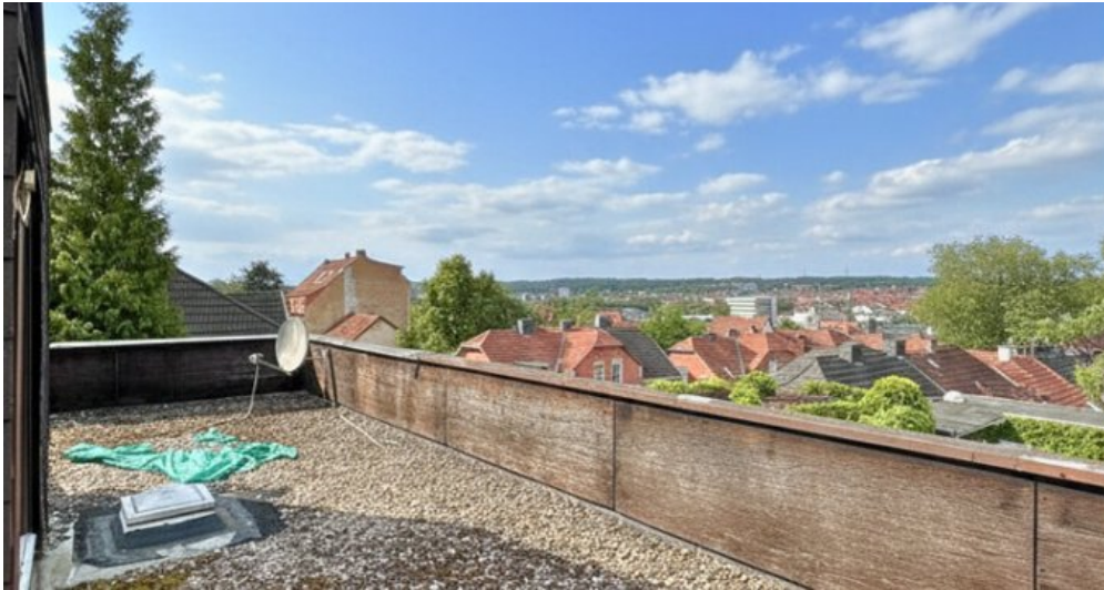
Aussicht der Terrasse 3.OG