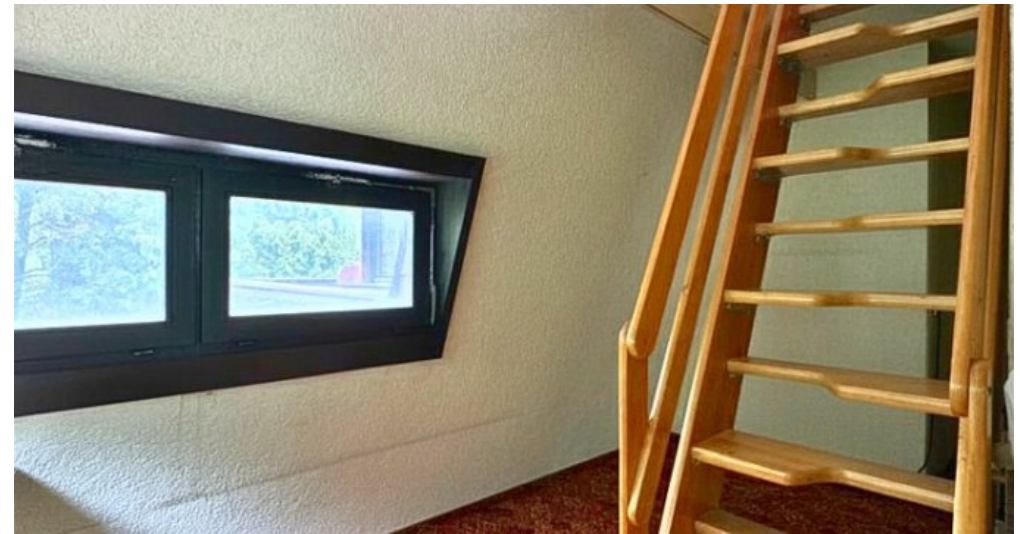
Treppe zum 3.OG