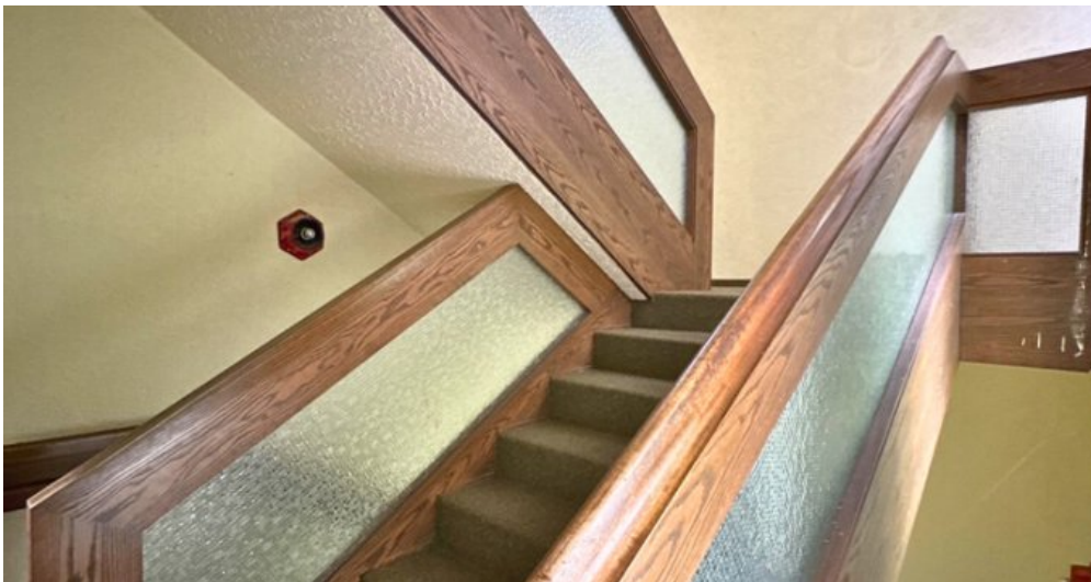
Treppe zum 2.OG