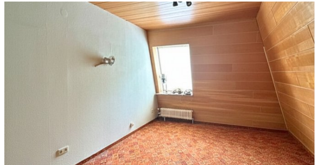
Kinderzimmer 3 2.OG