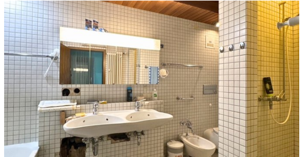
Bad Elternzimmer 1.OG