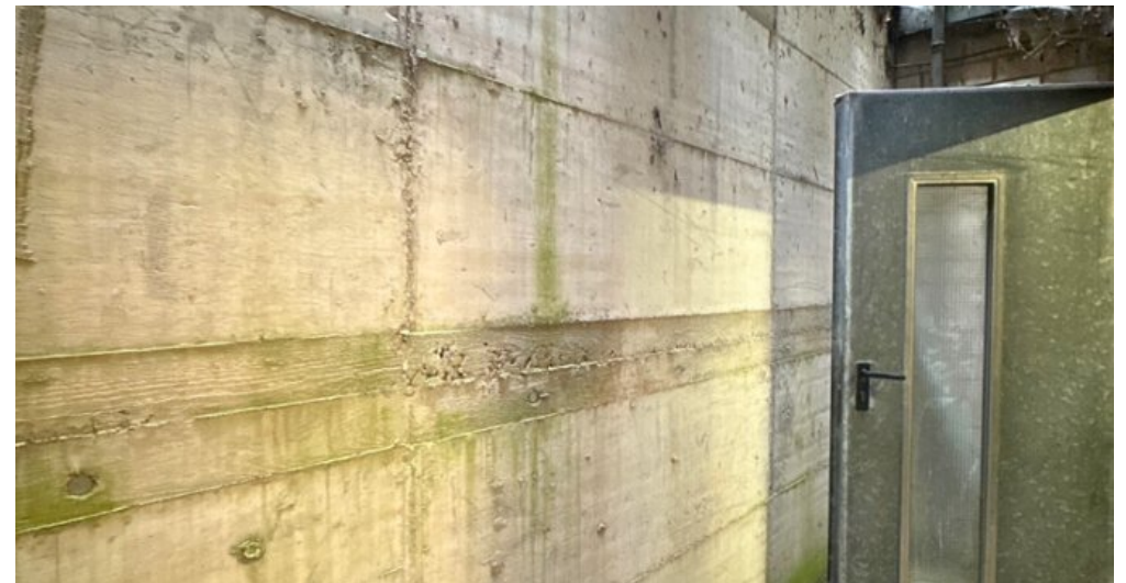
Verbindungsstück zum Heizungsraum EG