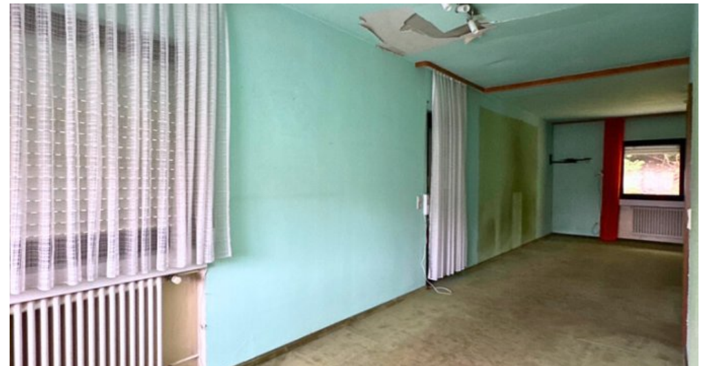
Elternzimmer Ansicht 1.OG