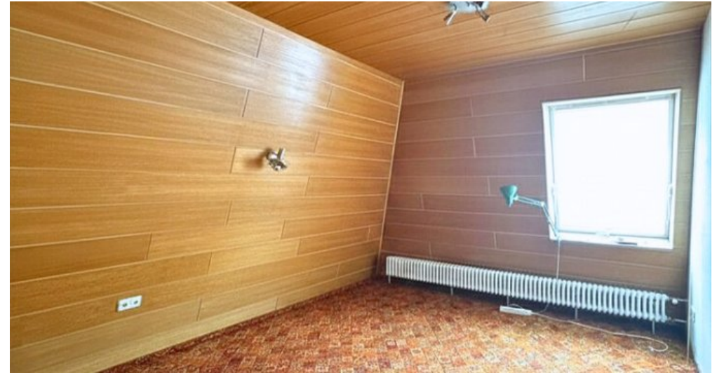
Kinderzimmer 1 2.OG