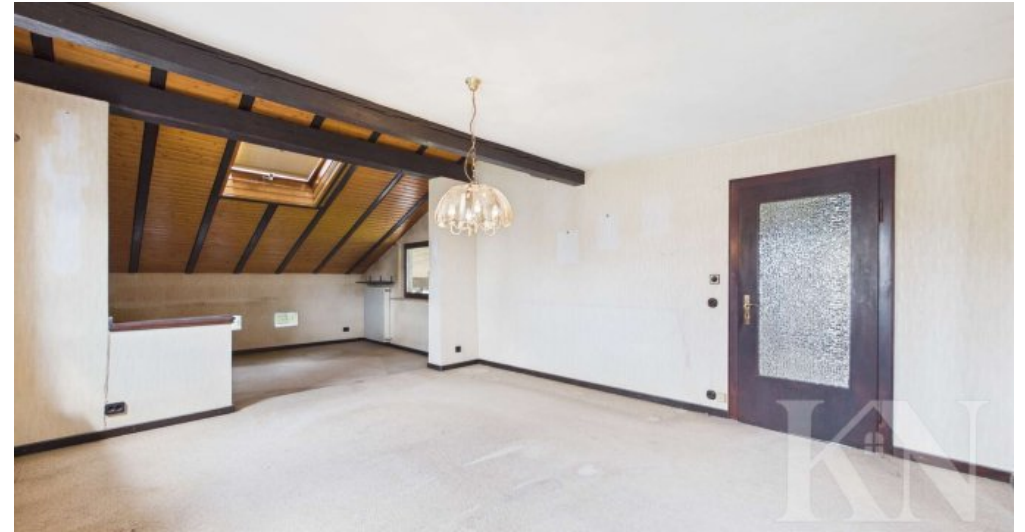
Wohn- Essbereich OG