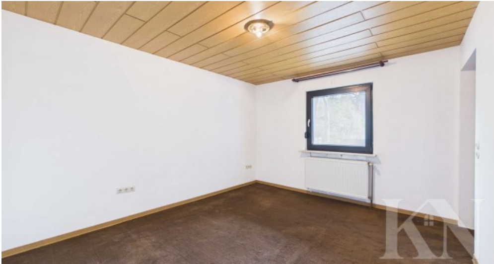
Zimmer 1 EG