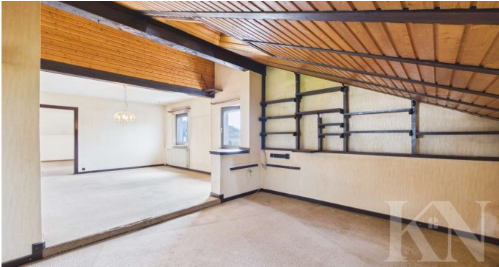
Wohn- Essbereich OG