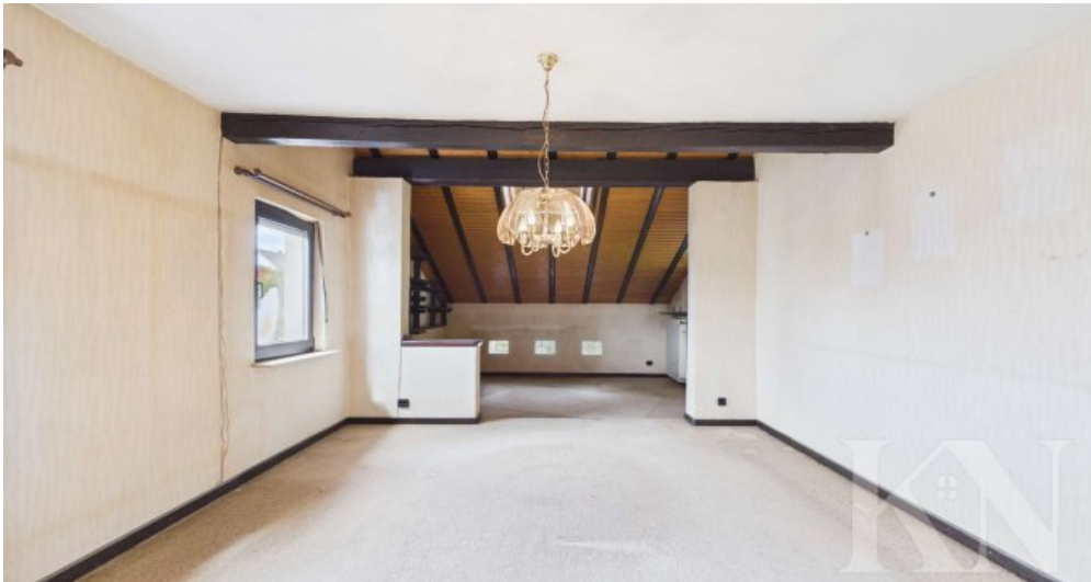
Wohn- Essbereich OG