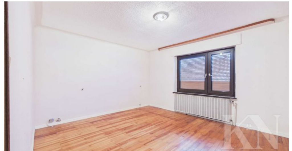
Zimmer 2 EG