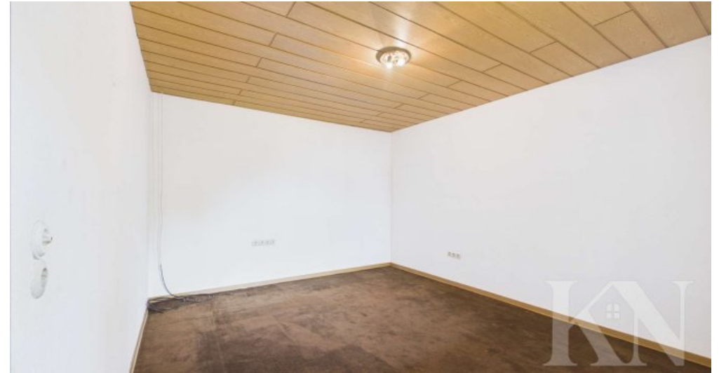
Zimmer 1 EG