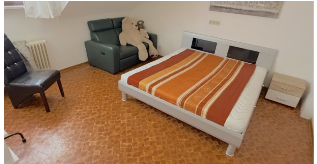
Schlafen 3 DG