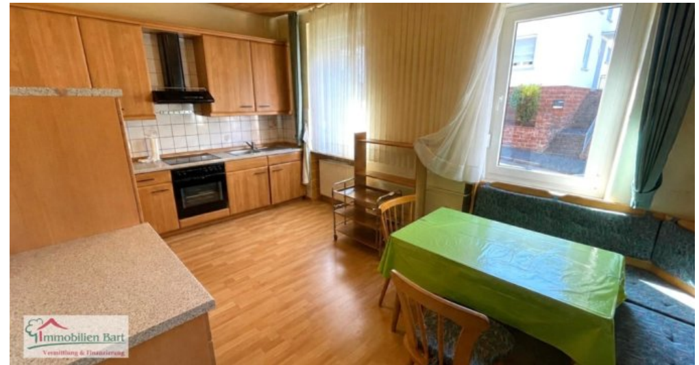
Küche mit Sitzecke