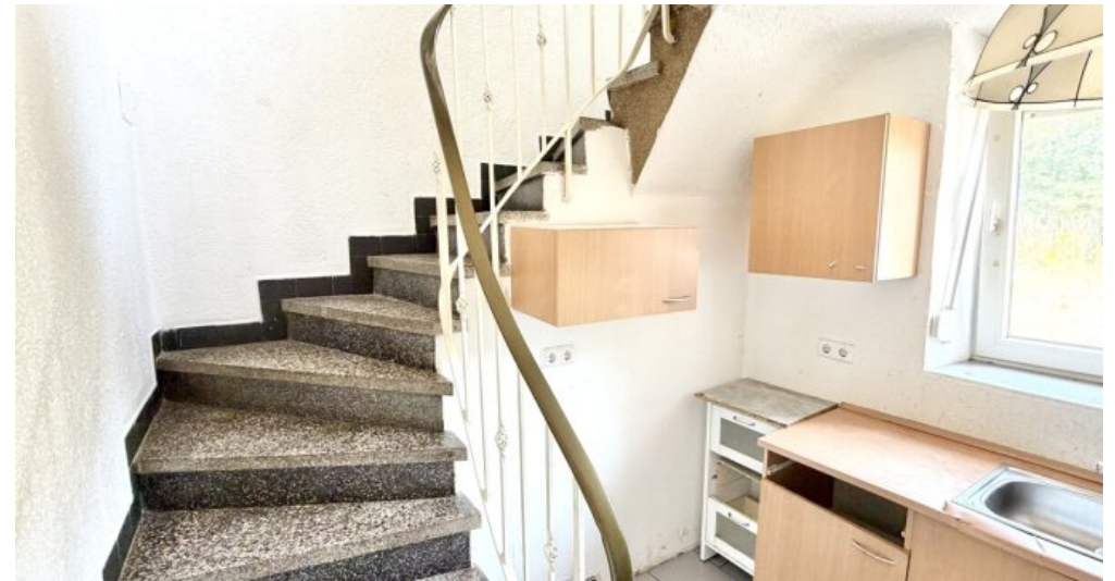
Treppe zu OG