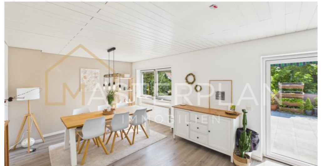
Wohn- und Esszimmer OG