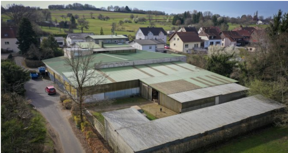
Draufsicht Wohnhaus mit Hallen