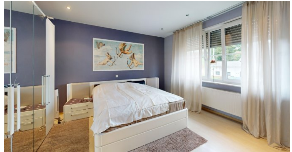
Schlafzimmer 1. OG