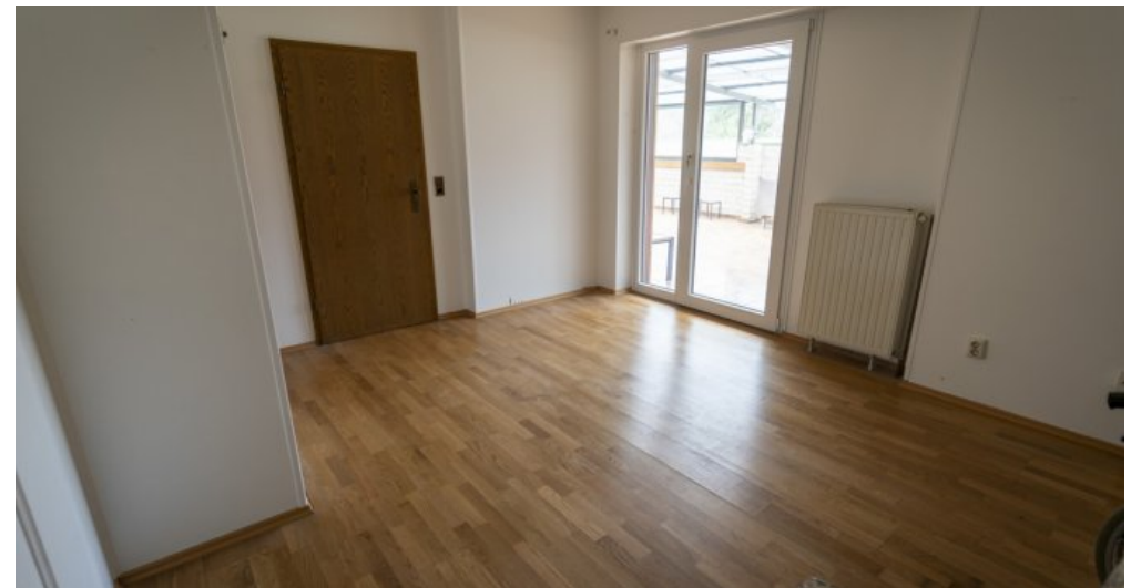
Gästezimmer EG mit Bad