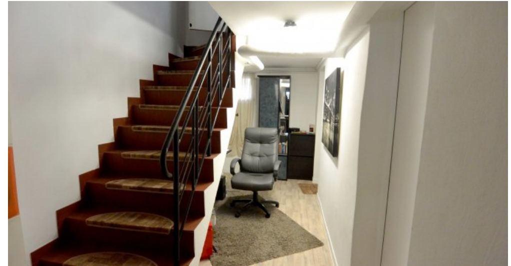
24 Treppe zum UG