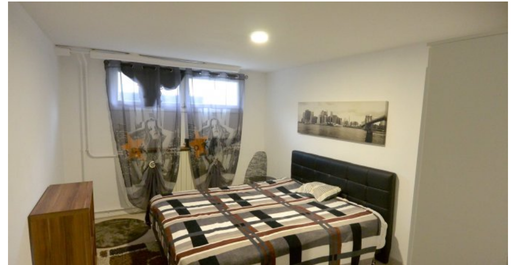
26 Schlafzimmer und