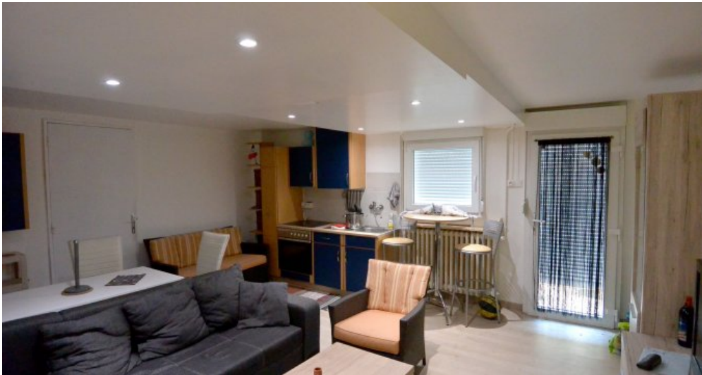
25 Einliegerwohnung mit