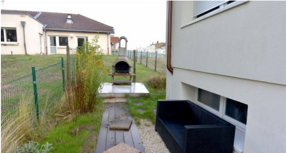
7 mit Grillecke