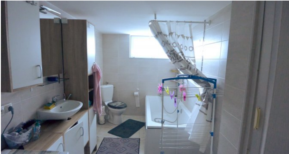
27 Bad mit Wanne und Toilette