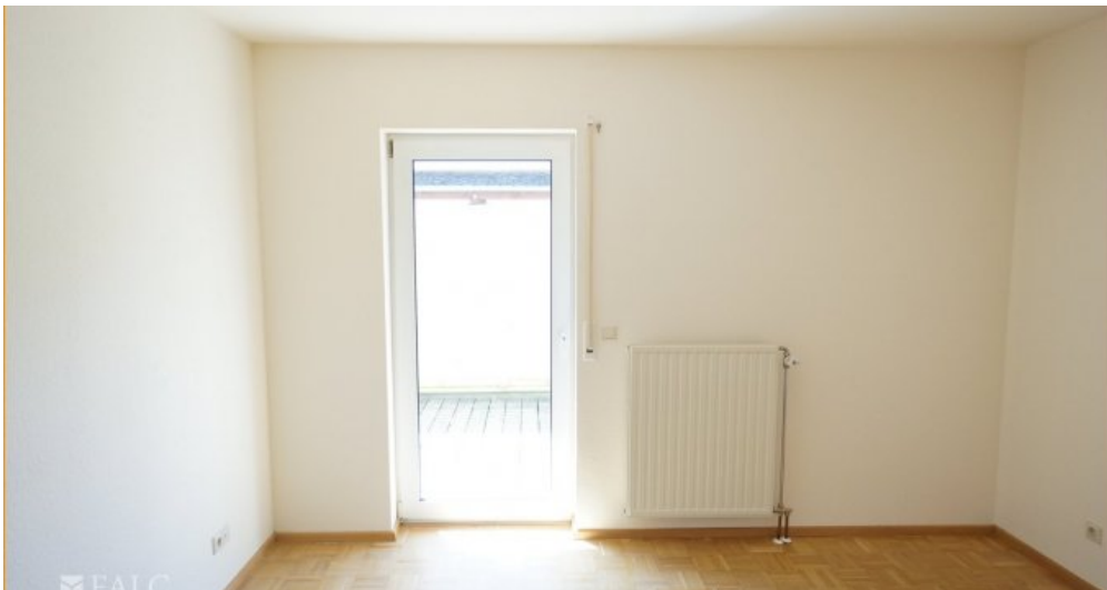
Schlafen 2 OG