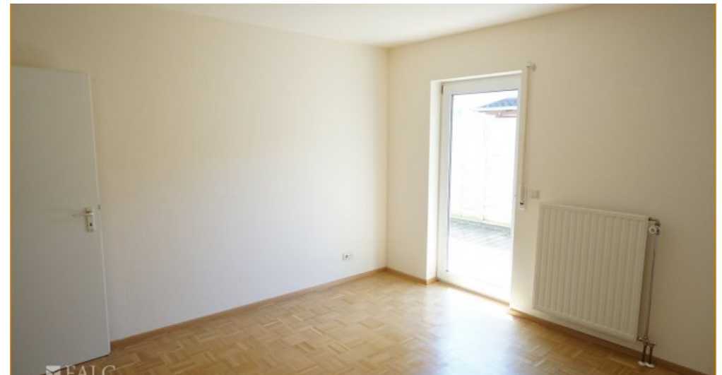
Schlafen 2 OG