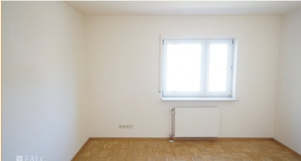
Schlafen 1 OG