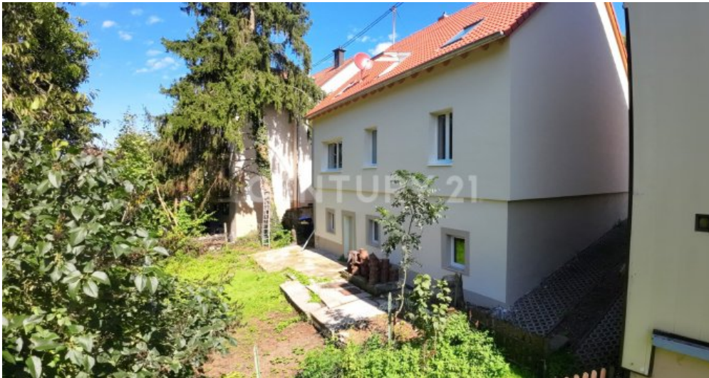
Rückseite des Hauses von der rechten Seite