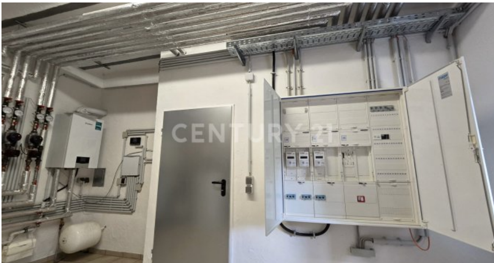
Neuer Zählerschrank, jedes Kabel im Haus neu