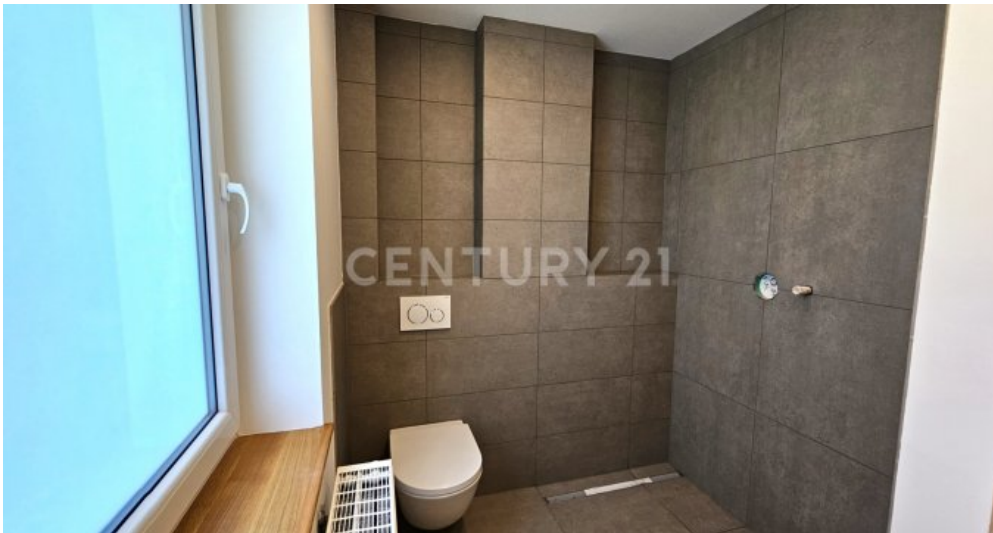
Badezimmer im Erdgeschoss mit bodenebener Dusche