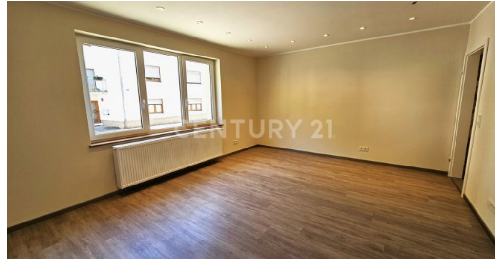
Wohnzimmer im Erdgeschoss von der Gegenseite