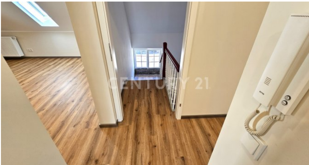
Flur mit Zugang zum Treppenhaus im Obergeschoss