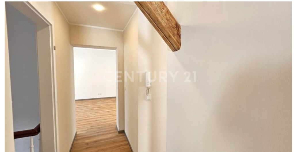
Eingangsflur im Obergeschoss