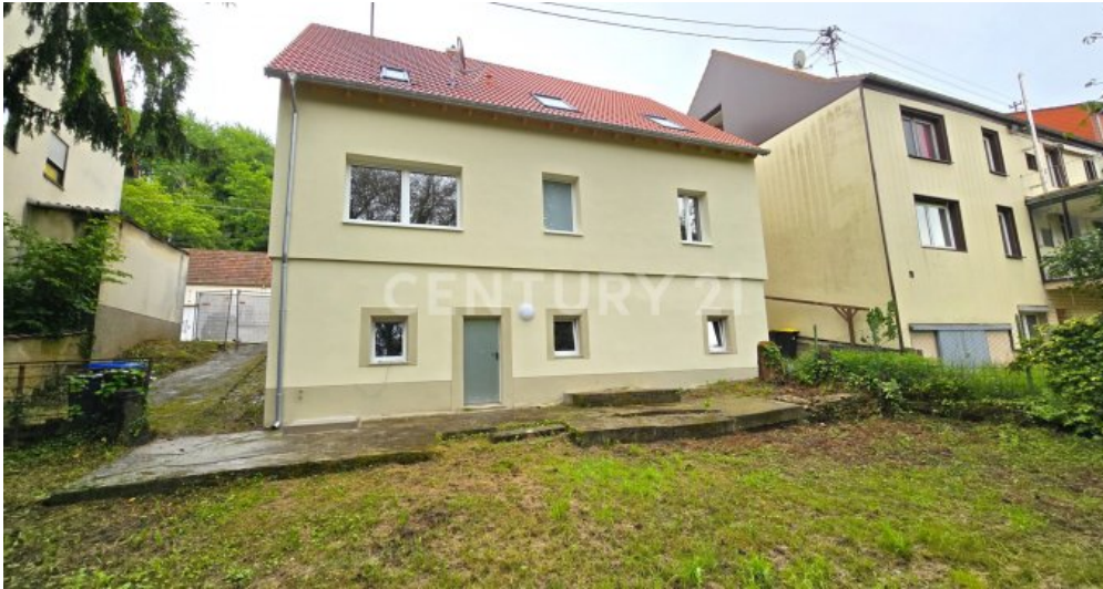
Rückseite des Hauses