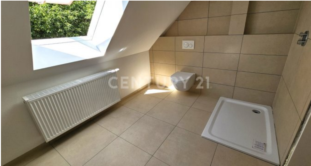
Badezimmer im OG, die Glaswand wird noch eingebaut