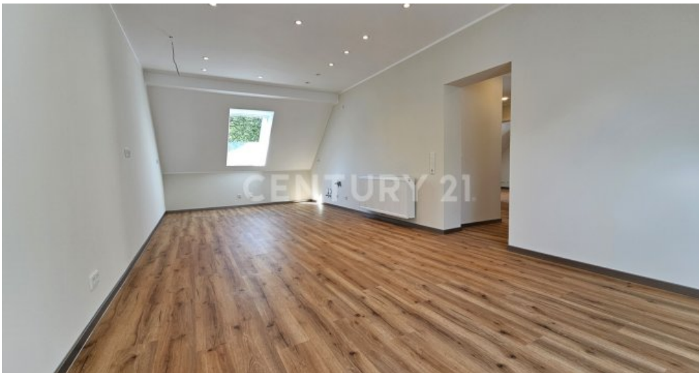
Küche - Esszimmer im OG