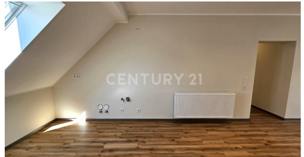
Küchenanschlüsse für Wasser, Abwasser und Herd