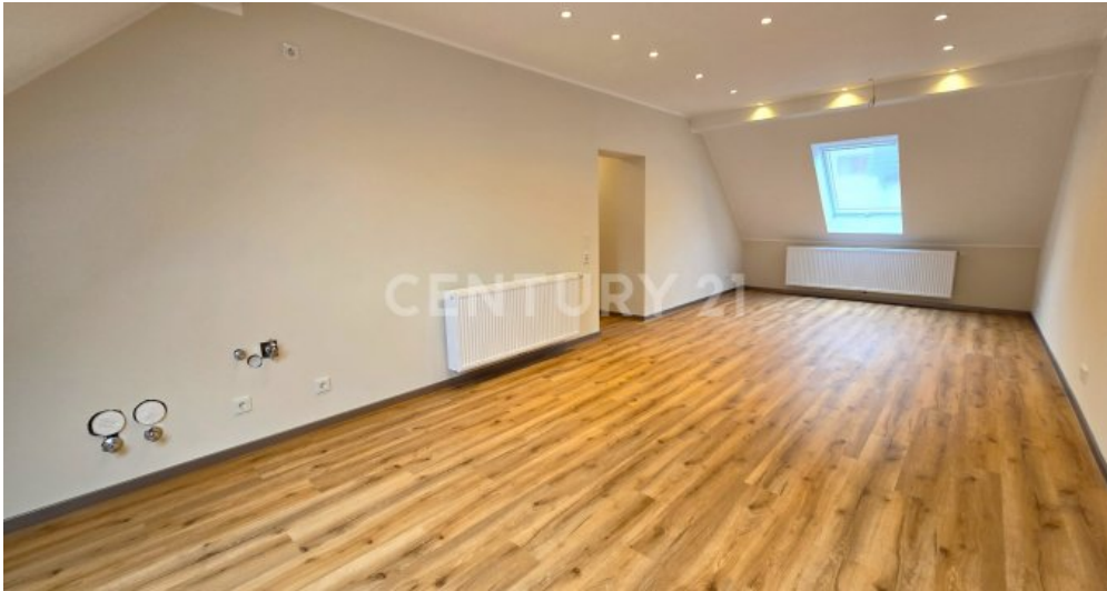
Küche - Esszimmer und möglicher Wohnzimmerbereich