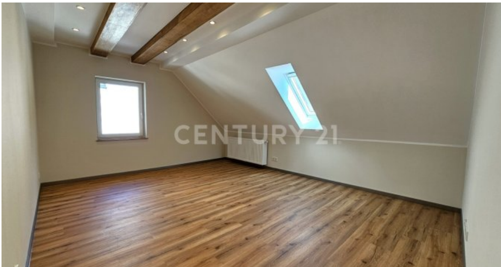
Lichtdurchflutetes Wohnzimmer Obergeschoss