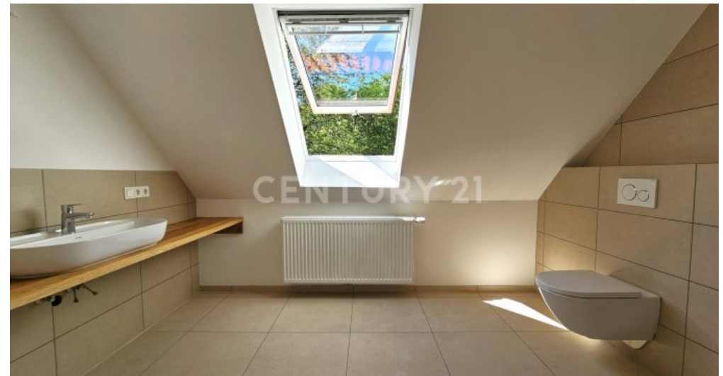
Badezimmer im OG mit großem Fenster