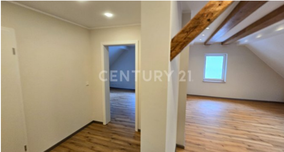
Flur zwischen den Räumen im OG mit Sichtgebälk