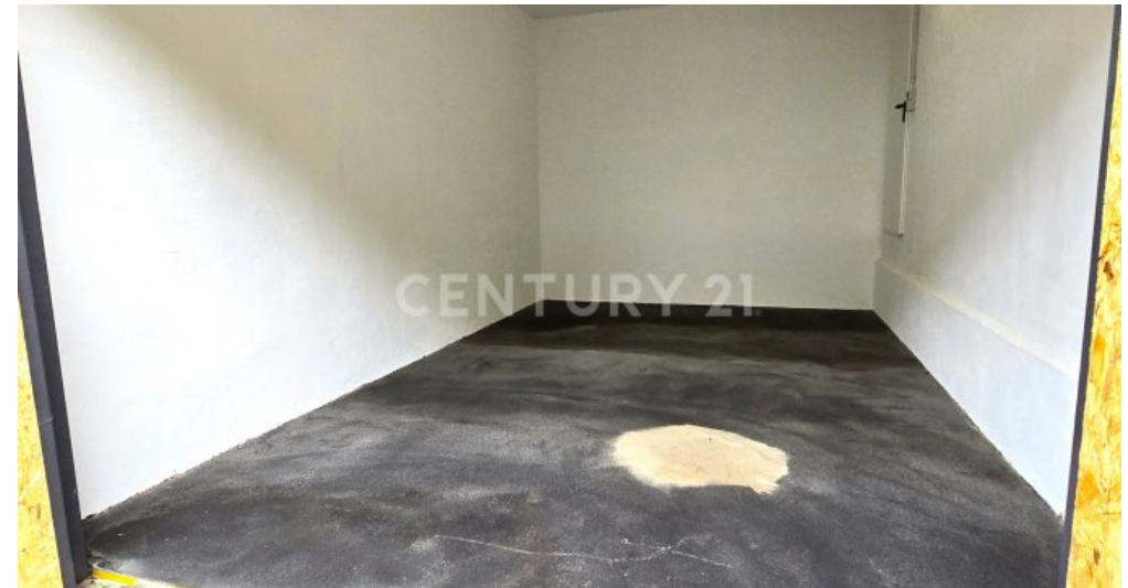
Große asphaltierte Garage für Kombi oder SUV geeignet