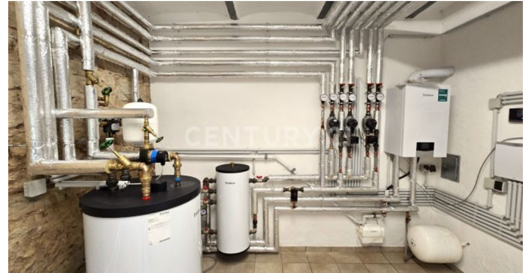
Neue Heizungsanlage Gas - Hybrid mit Wärmepumpe