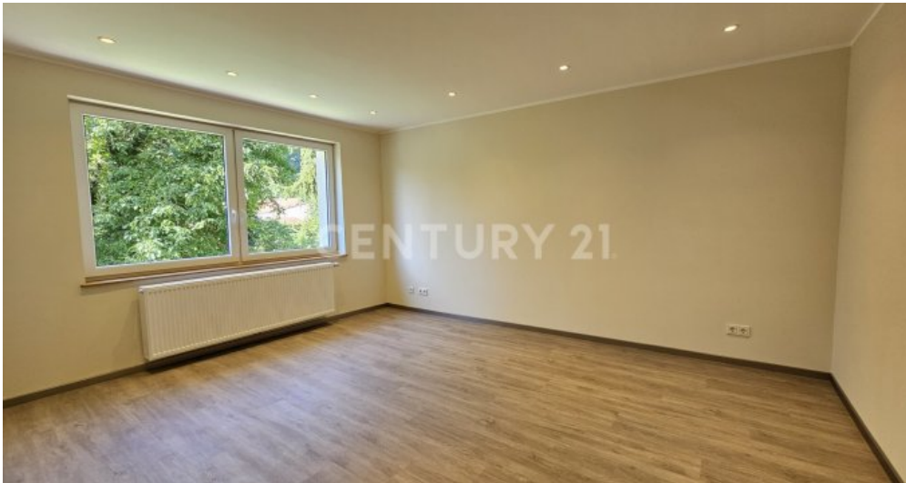
Schlafzimmer im Erdgeschoss