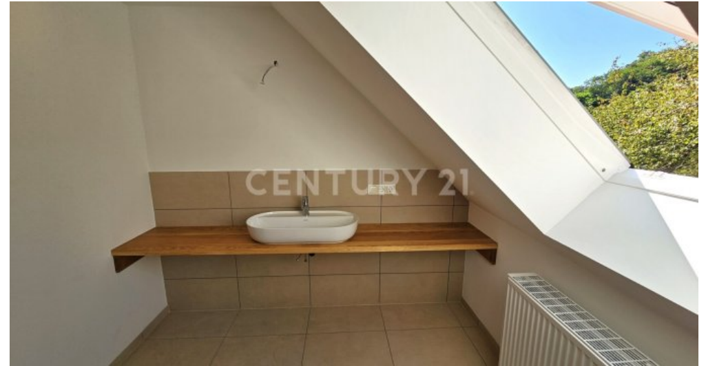
Moderner edler Holzwaschtisch mit Keramikwaschbecken