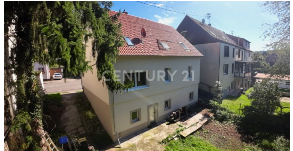
Rückseite des Hauses von der linken Seite