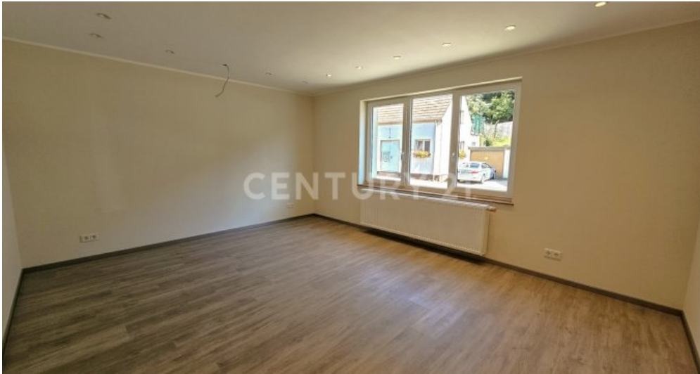
Helles großes Wohn - Esszimmer im Erdgeschoss