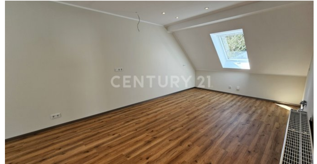
Großer Küche - Esszimmerbereich