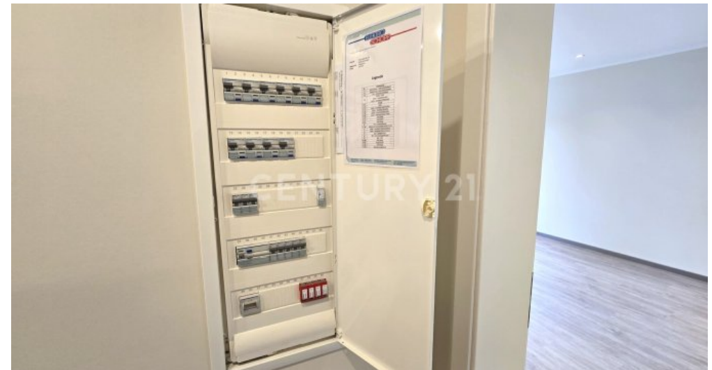
Neue Unterverteilungen auf jeder Etage