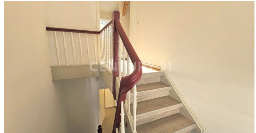
Treppenhaus im Obergeschoss