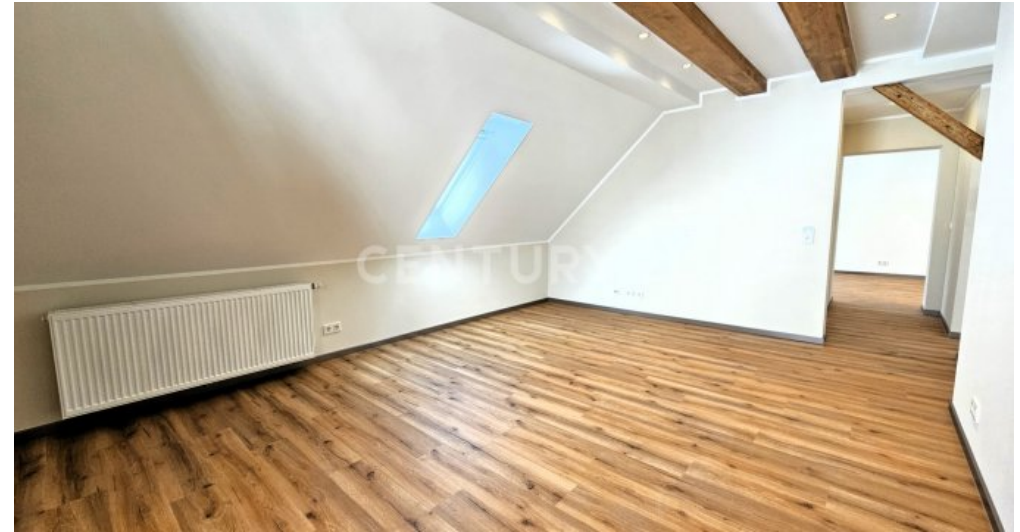
Großes Wohnzimmer im Obergeschoss