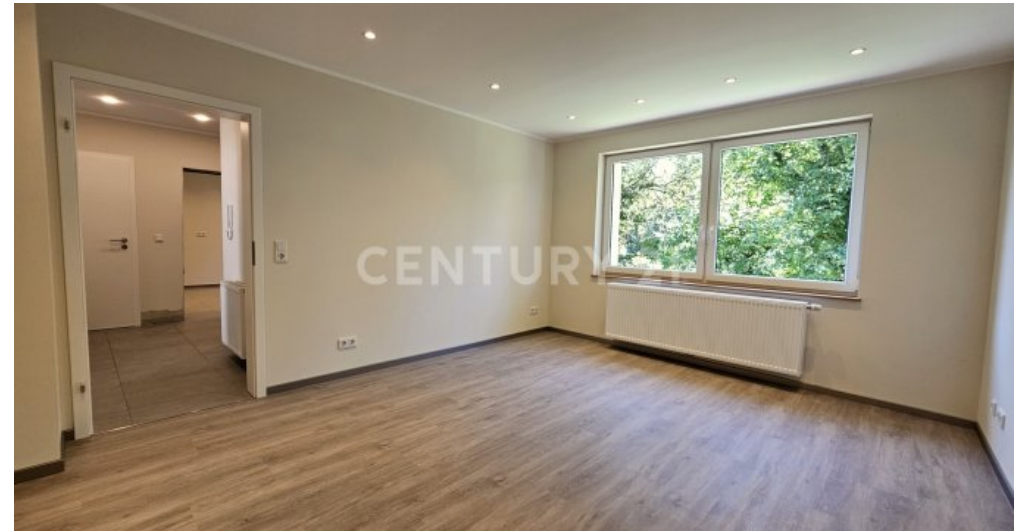
Gegenseite des Schlafzimmers im EG