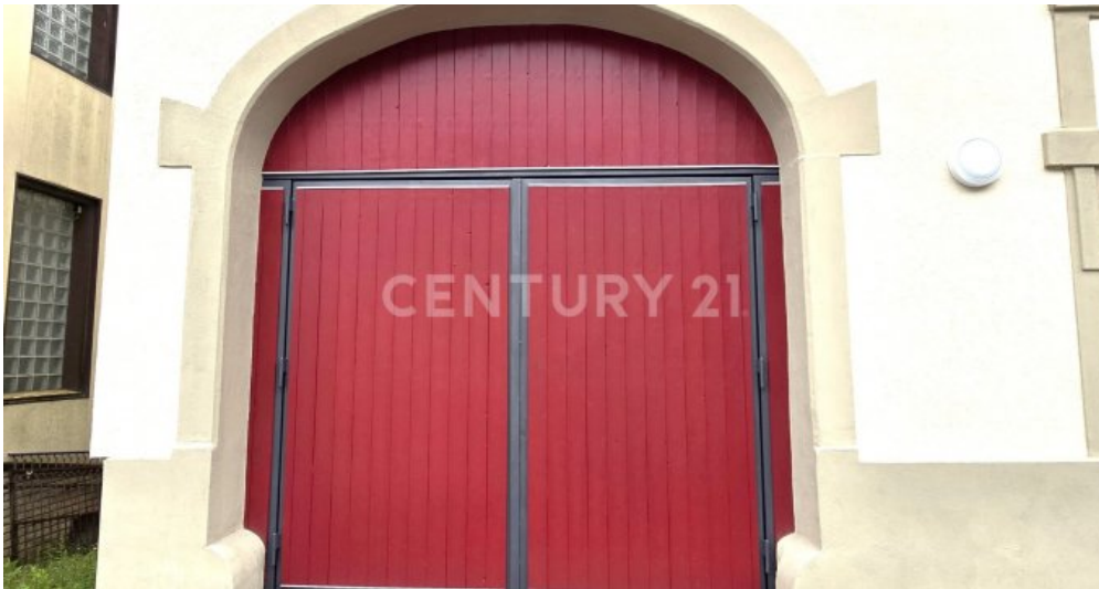
Neues massiv gebautes Garagentor