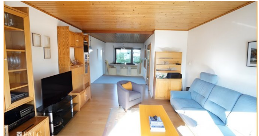
Wohn- Esszimmer EG