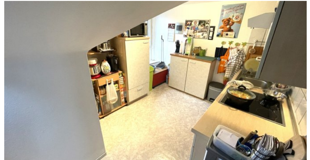
Wohnung HSN 41 DG (2)