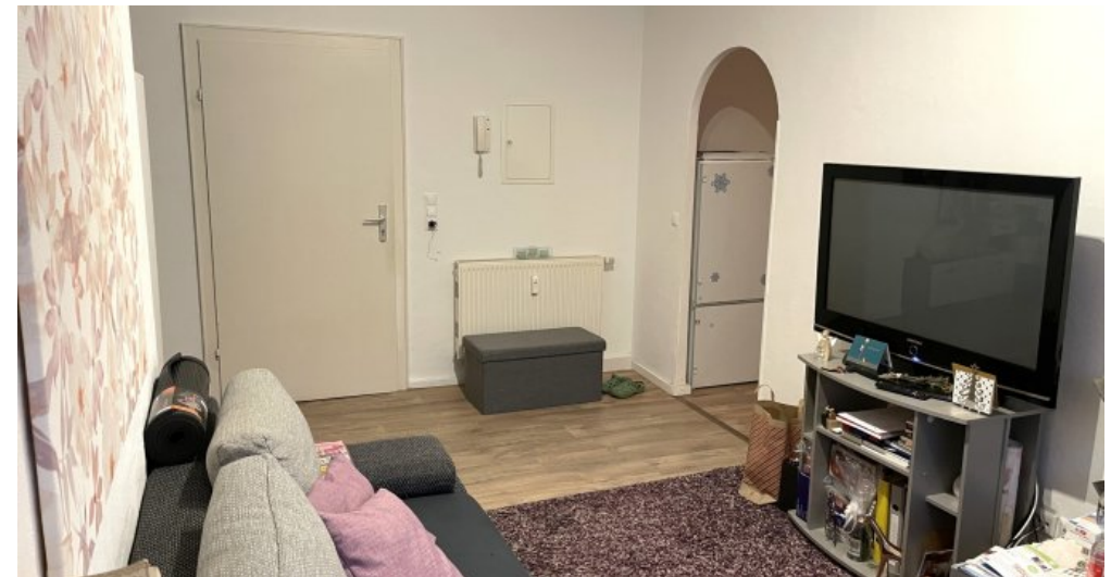
Wohnung HSN 45 OG (4)