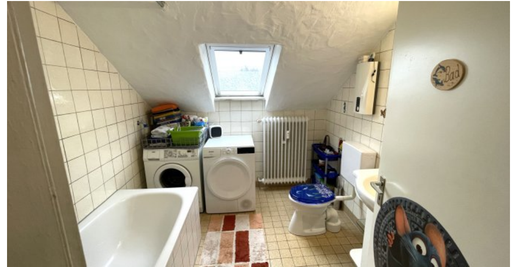
Wohnung HSN 41 DG (4)