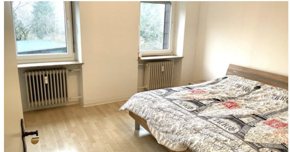
Wohnung HSN 41 OG (4)