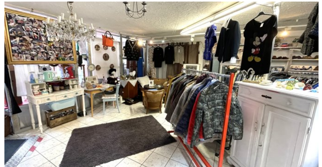
Ladenlokal 2 (1)