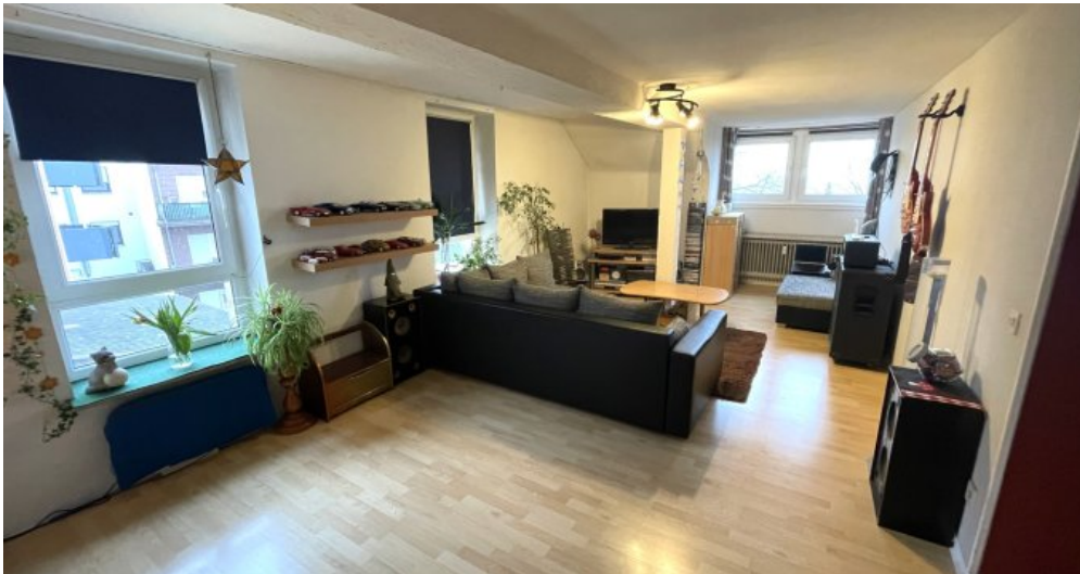
Wohnung HSN 41 DG (1)