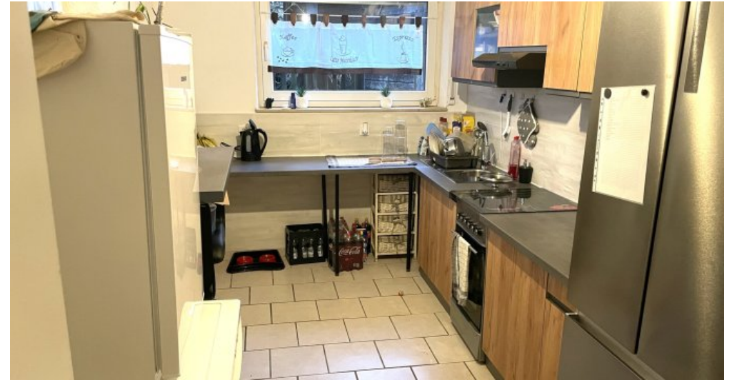
Wohnung HSN 45 Anbau (2)