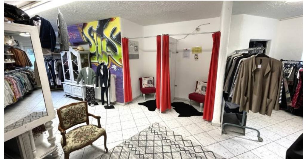
Ladenlokal 2 (3)