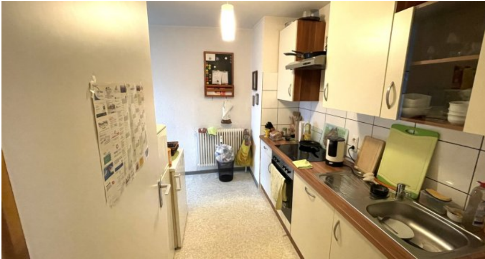
Wohnung HSN 43 DG (2)