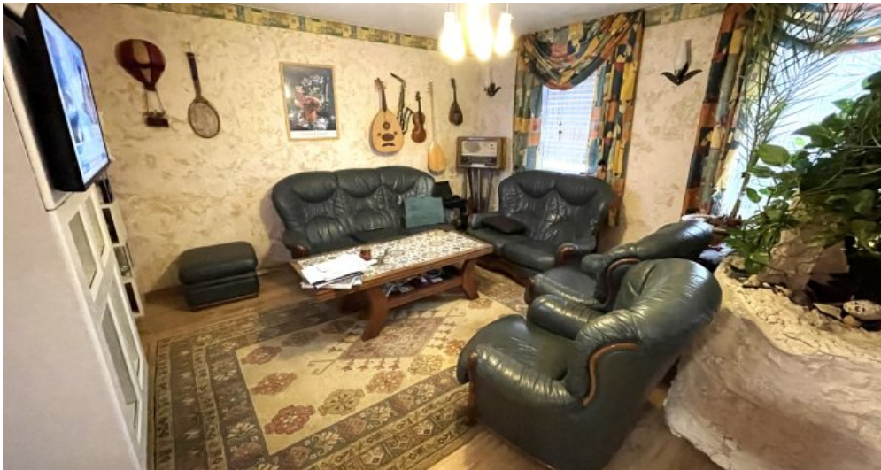
Wohnung HSN 43 OG (1)