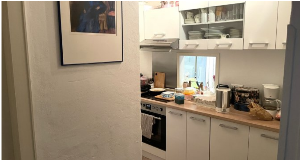
Wohnung HSN 45 OG (1)