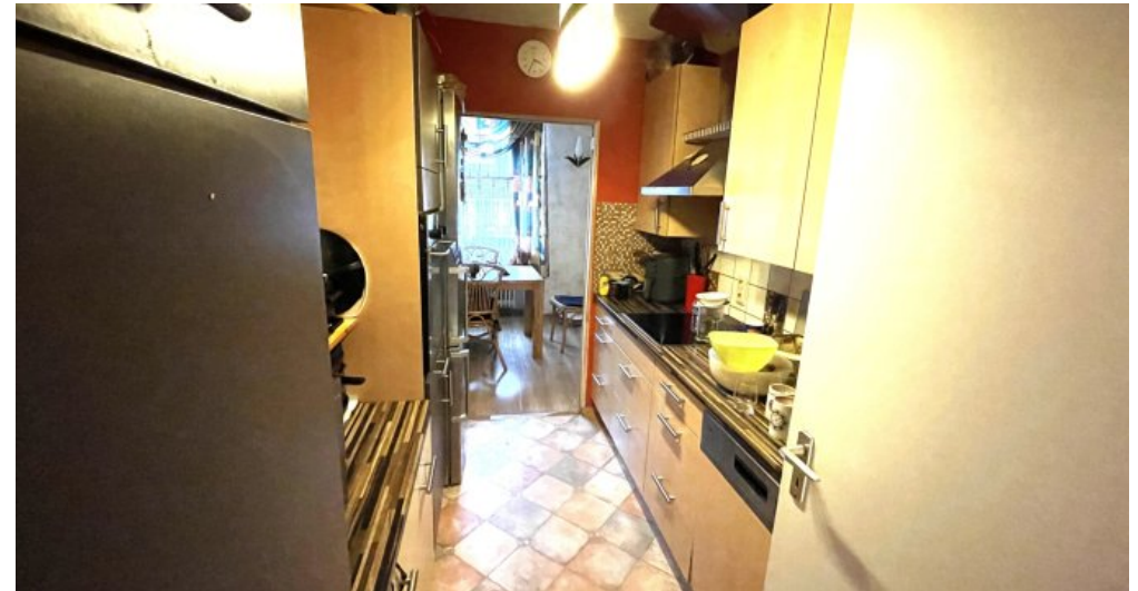
Wohnung HSN 43 OG (2)