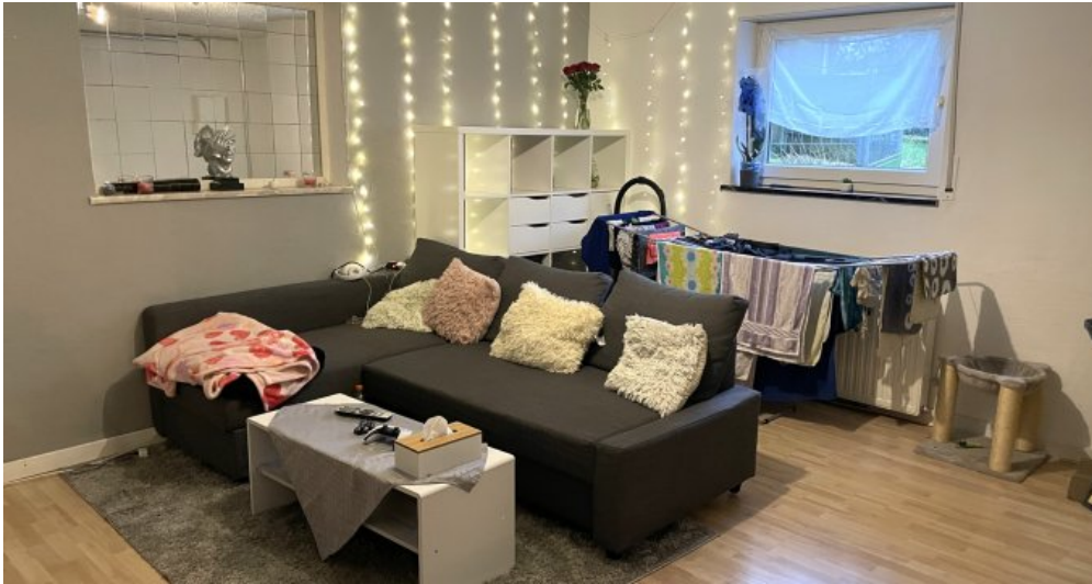
Wohnung HSN 45 Anbau (1)