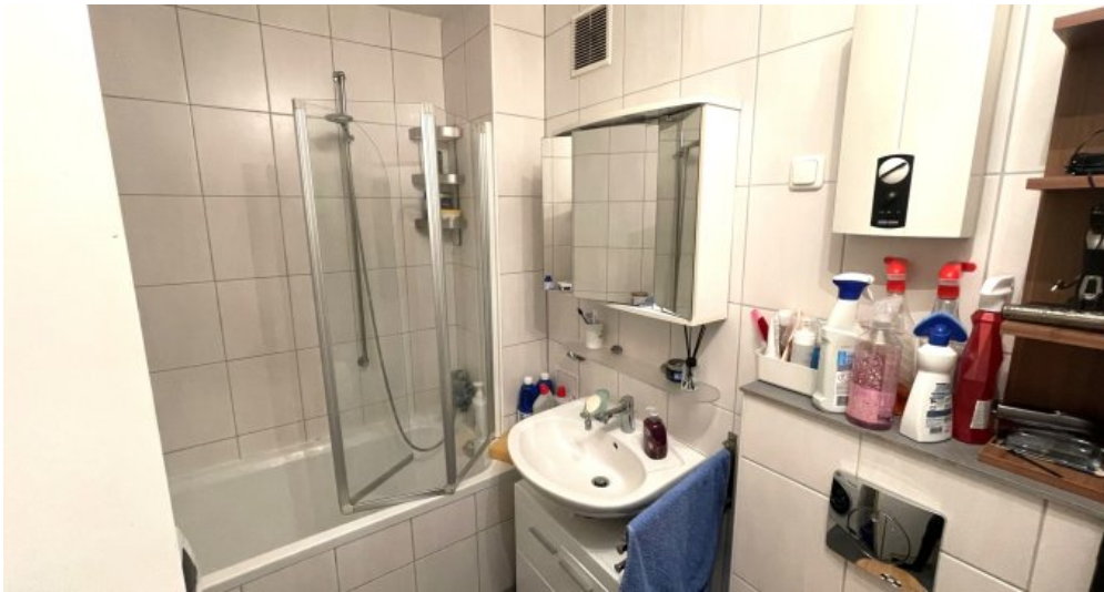
Wohnung HSN 41 OG (3)