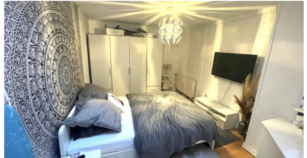
Wohnung HSN 45 Anbau (4)