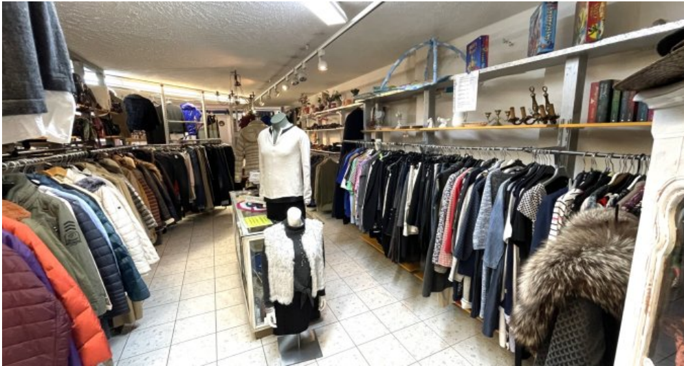
Ladenlokal 2 (2)