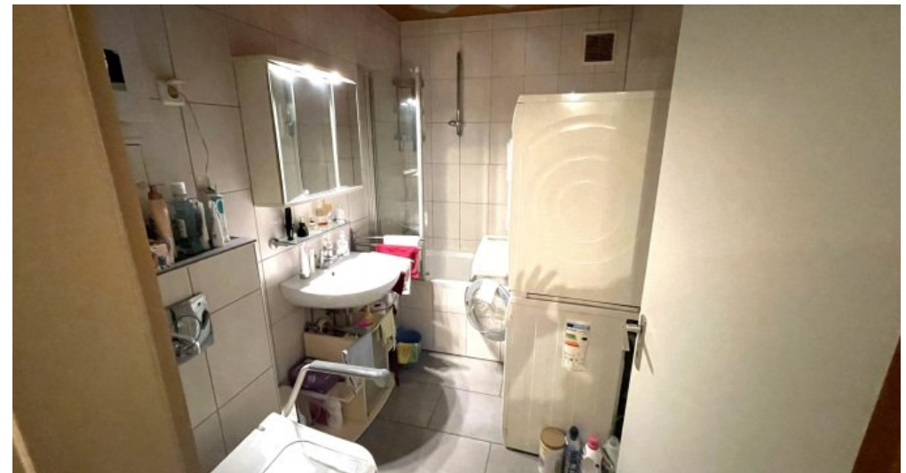
Wohnung HSN 43 DG (1)