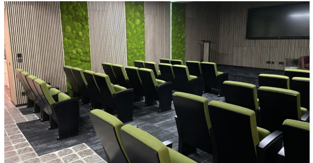
Ladenlokal 1 (4)