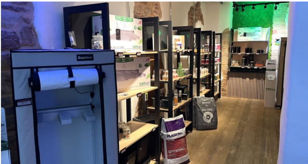
Ladenlokal 1 (5)