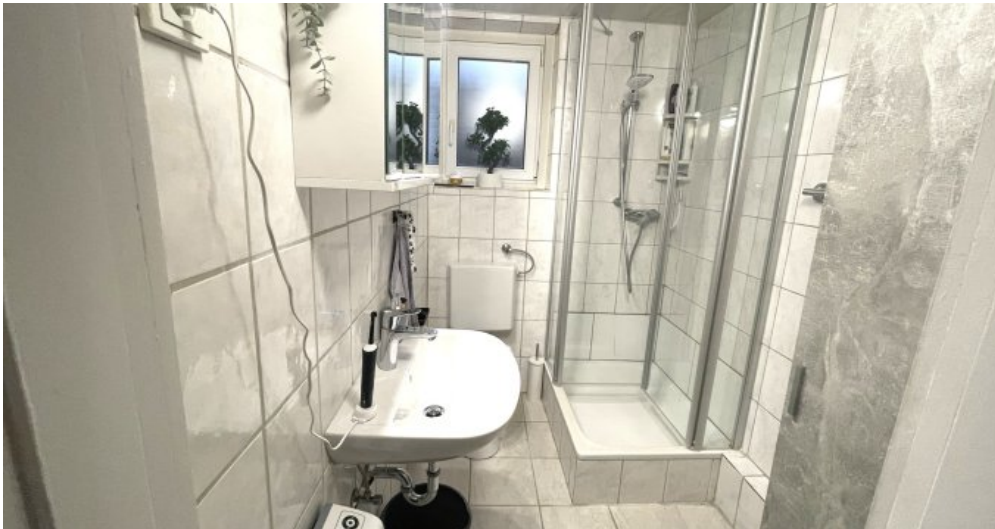
Wohnung HSN 45 Anbau (3)