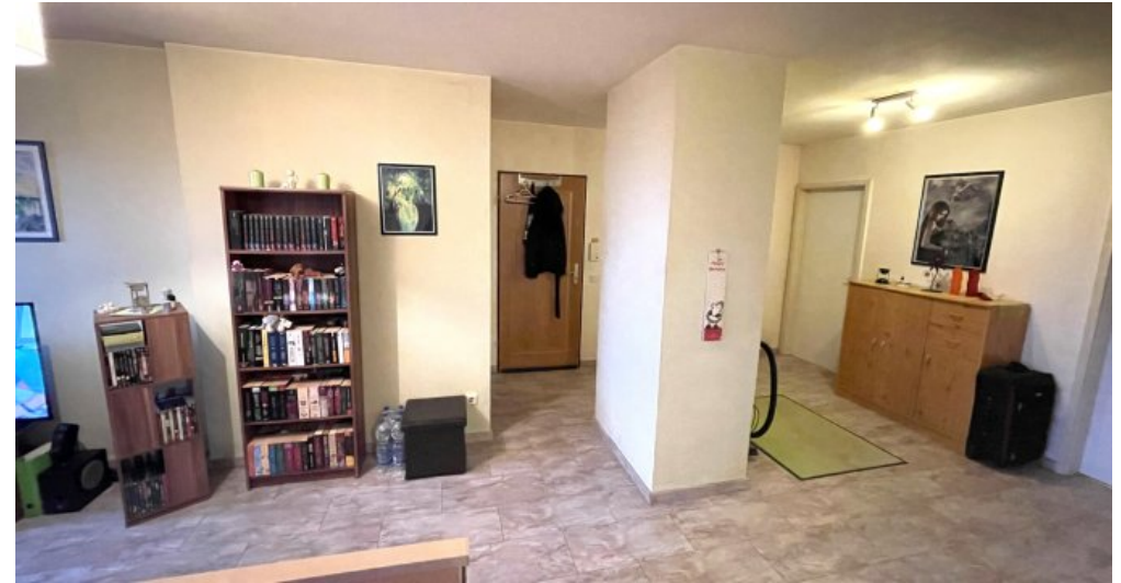
Wohnung HSN 43 DG (3)