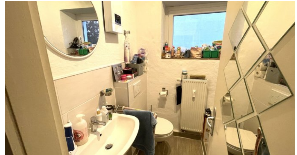
Wohnung HSN 45 OG (2)