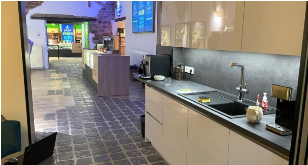
Ladenlokal 1 (3)