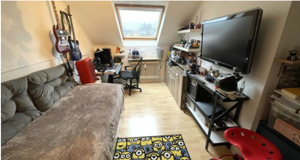
Wohnung HSN 41 DG (3)