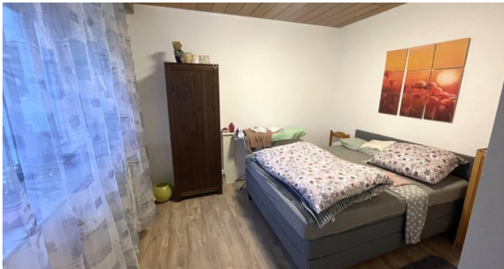
Wohnung HSN 45 OG (3)