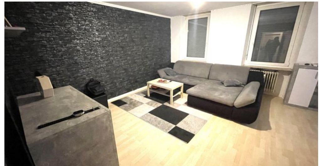
Wohnung HSN 41 OG (2)