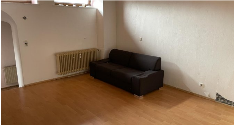
Wohnzimmer 1.OG rechts