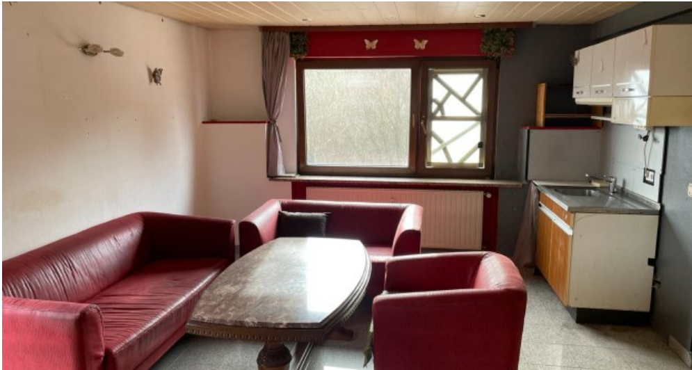
Essbereich 1.OG links