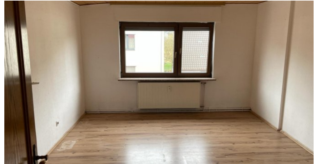
Schlafzimmer 1.OG rechts