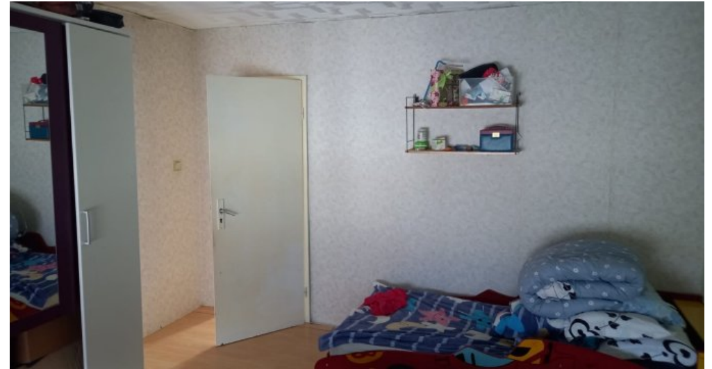
Schlafzimmer DG Wohnung rechts