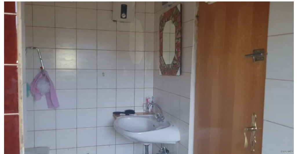
Bad Dachgeschosswohnung rechts