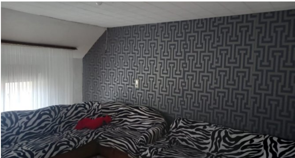
Wohnzimmer DG Wohnung links