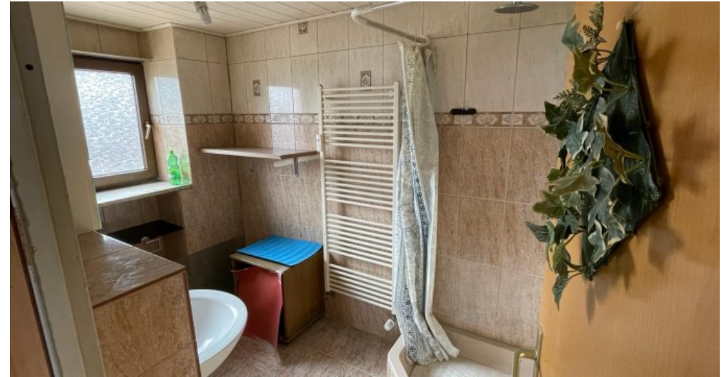
Bad 1.OG links