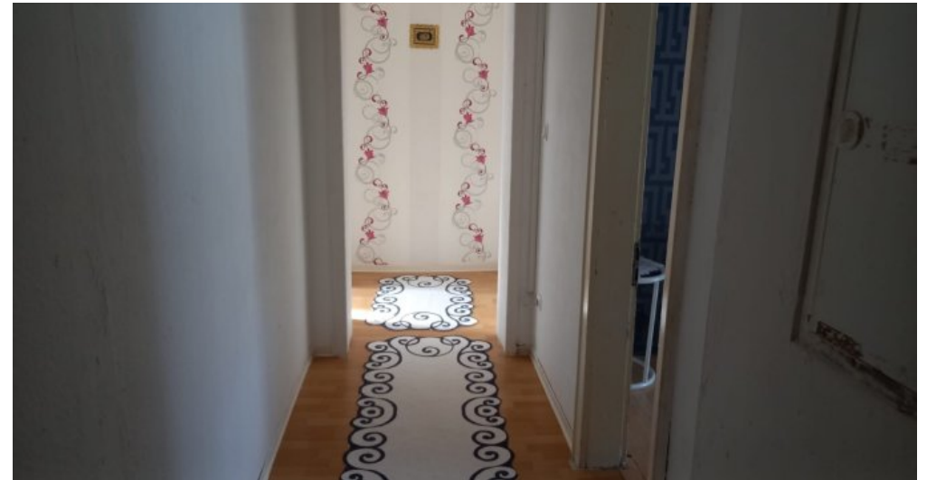
Flur DG Wohnung Irechts