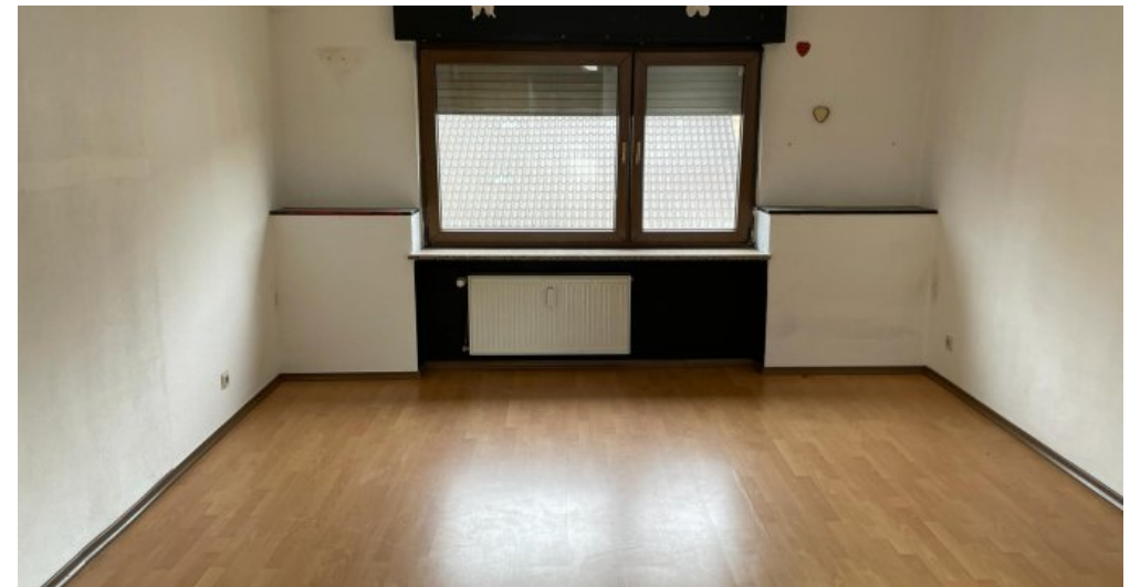
Schlafzimmer 1.OG links