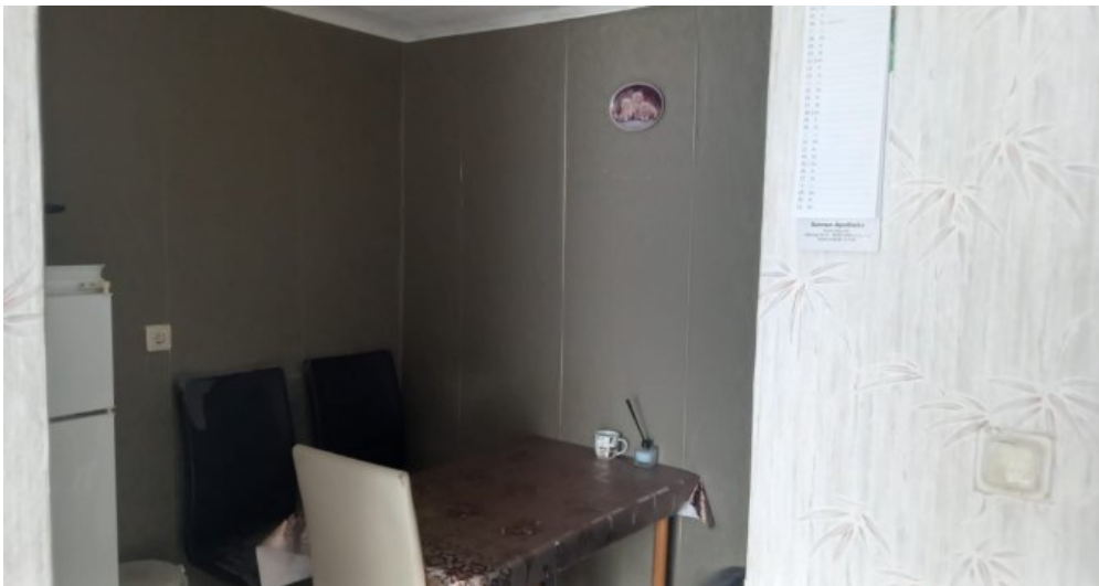
Küche DG rechts