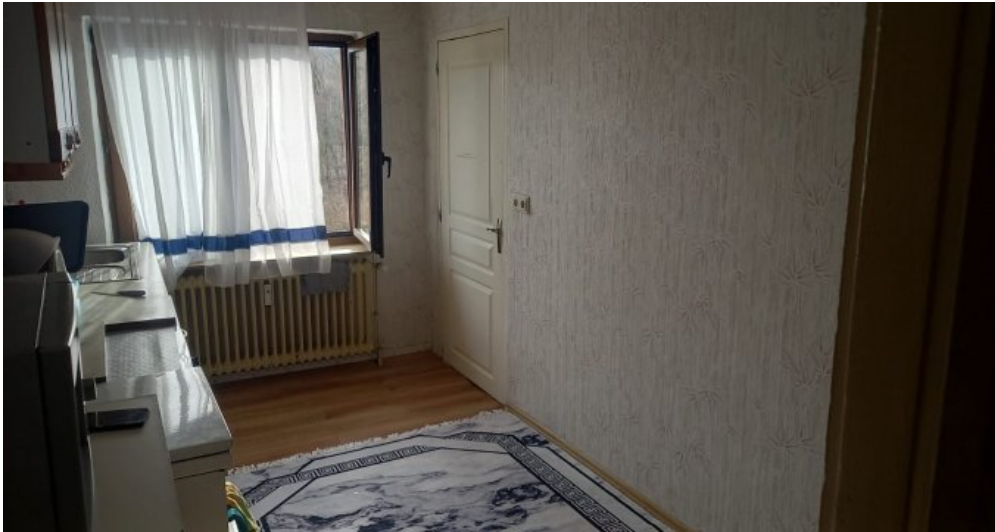
Küche DG Wohnung rechts