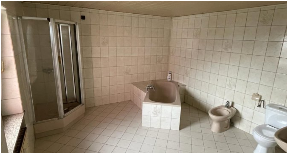
Bad 1.OG rechts