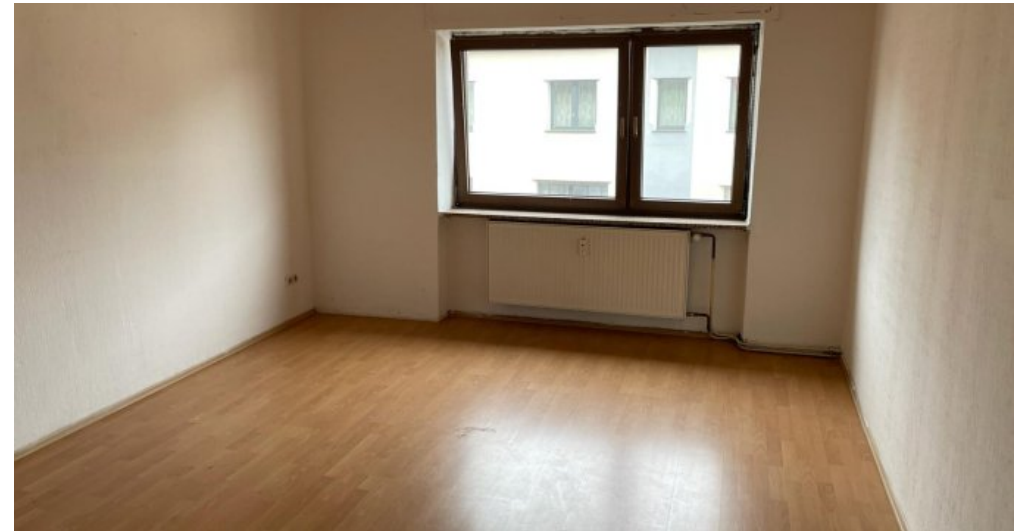
Schlafzimmer 1.OG rechts