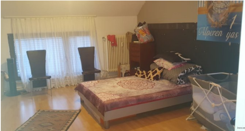
Schlafzimmer DG Wohnung rechts