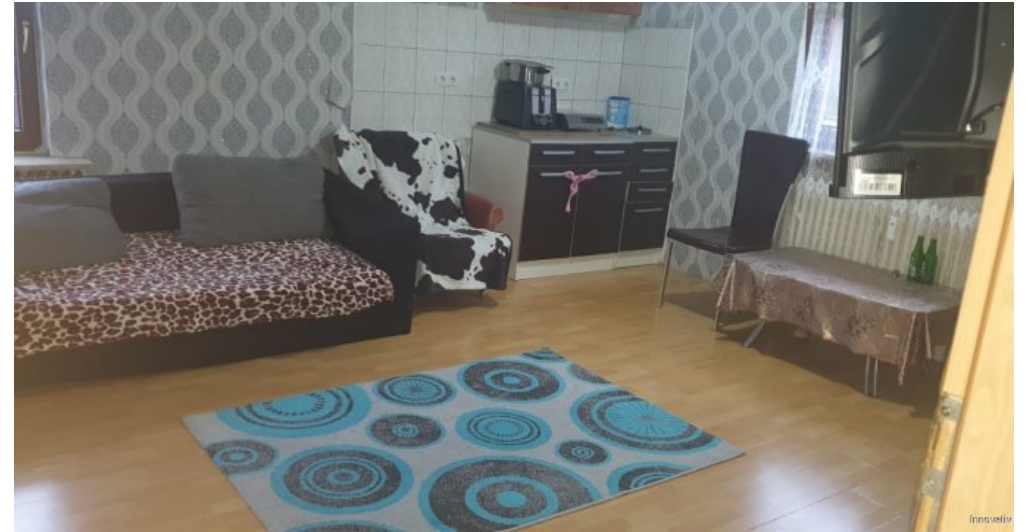
Wohnküche DG Wohnung links