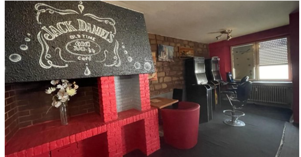
Gewerbe EG .....