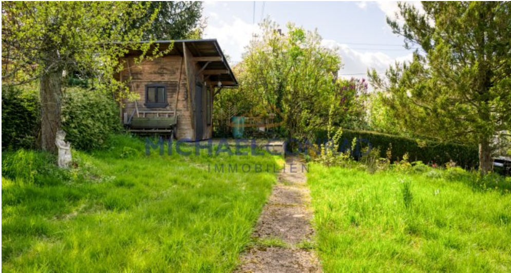
Separater Garten / Bauplatz