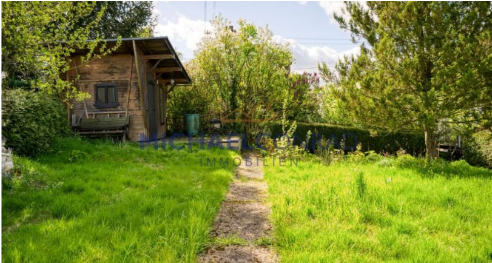
Separater Garten / Bauplatz