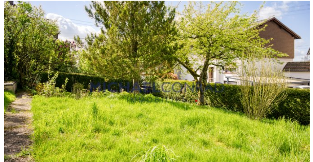
Separater Garten / Bauplatz