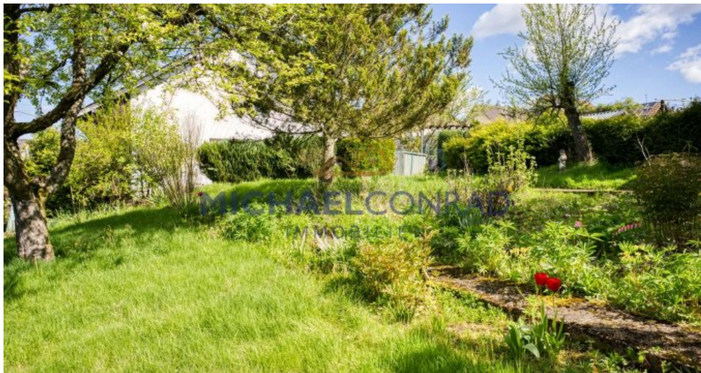
Separater Garten / Bauplatz