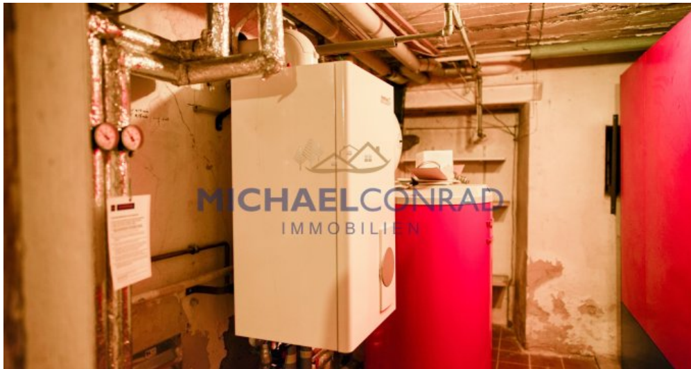
Gasheizung (Gas in Straße)