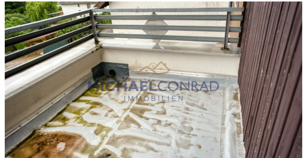
Balkon Abdichtung erneuert