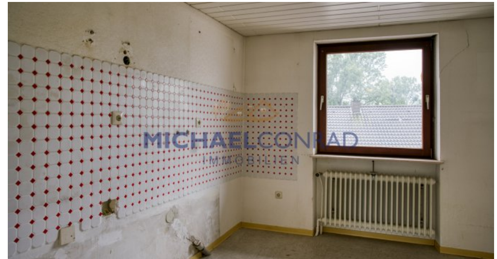
mögliche Küche im Obergeschoss