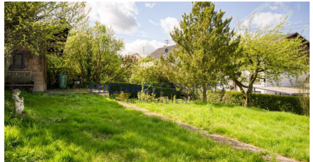
Separater Garten / Bauplatz