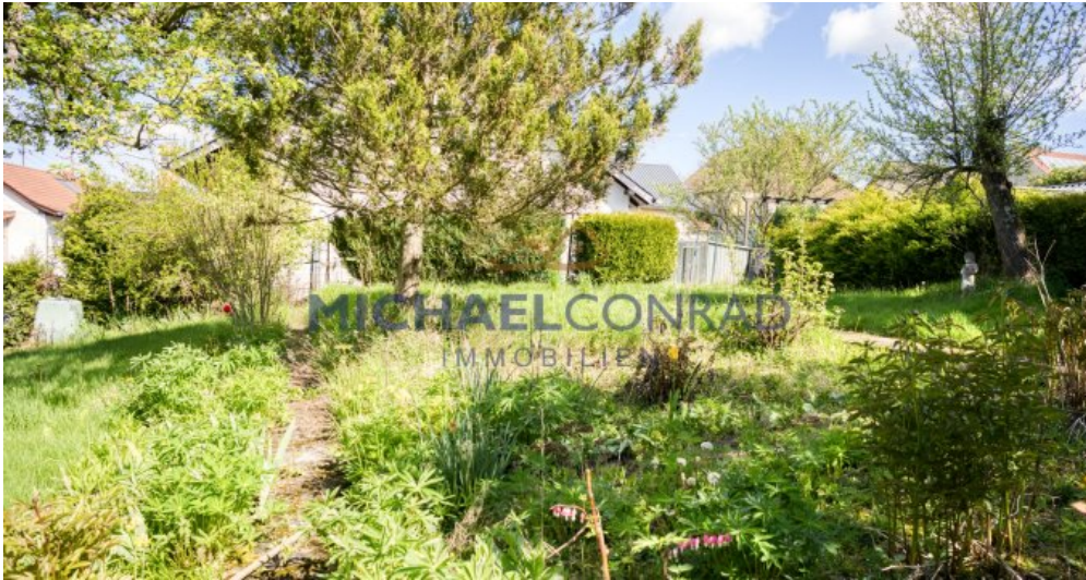
Separater Garten / Bauplatz