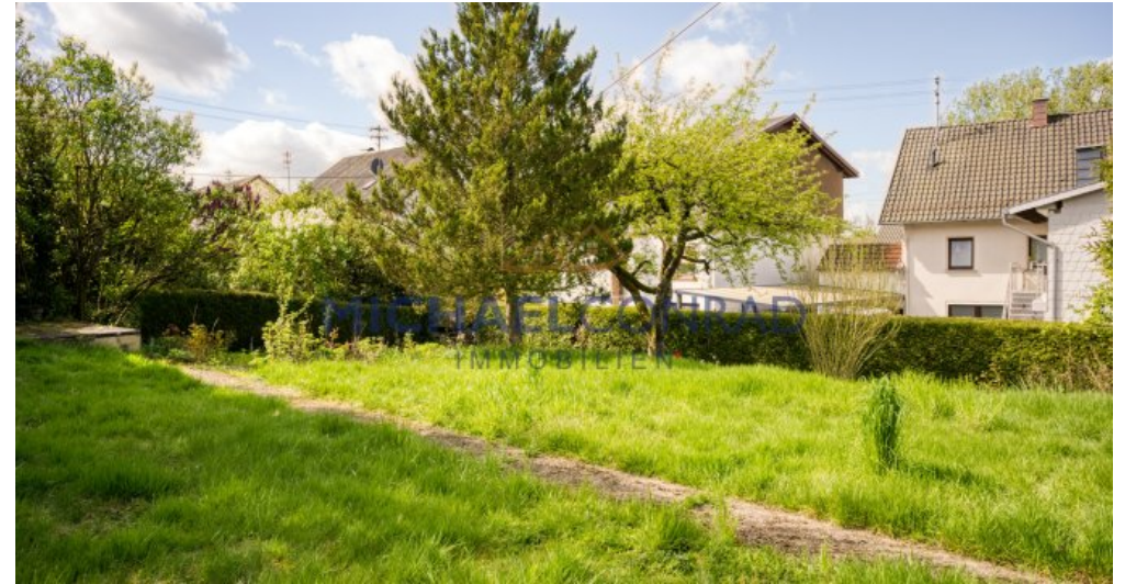
Separater Garten / Bauplatz