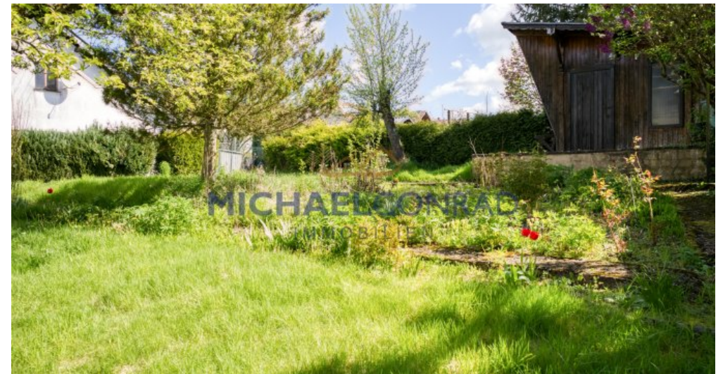
Separater Garten / Bauplatz