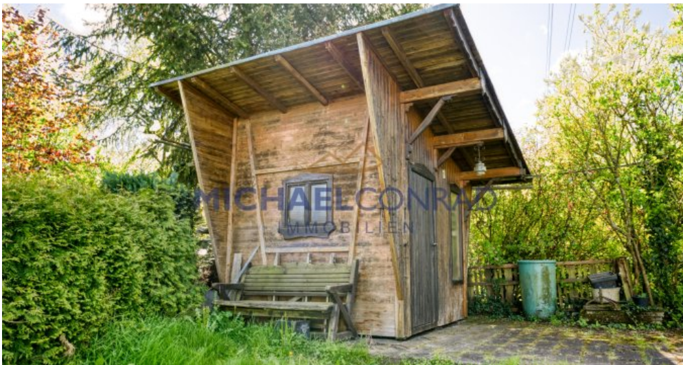
Separater Garten / Bauplatz