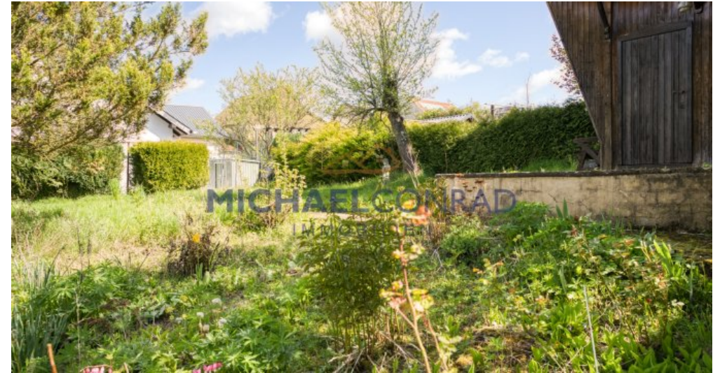
Separater Garten / Bauplatz