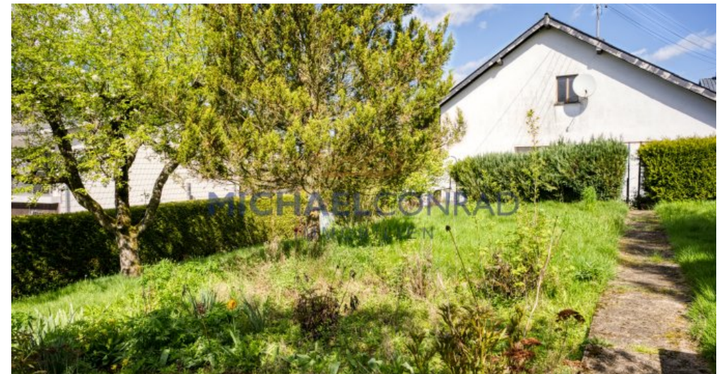
Separater Garten / Bauplatz