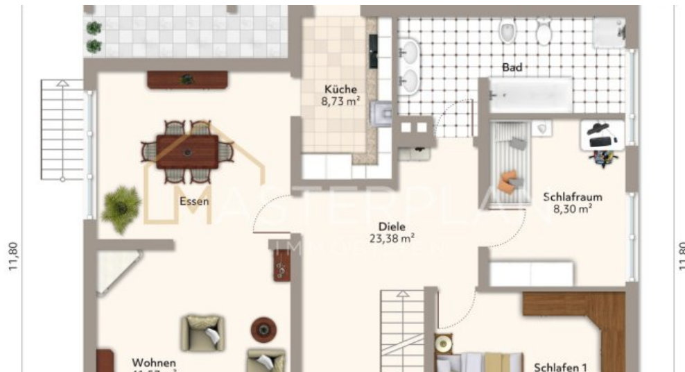
Grundriss WHG 1