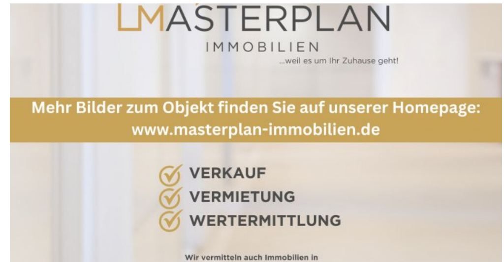
Mehr Bilder auf Website