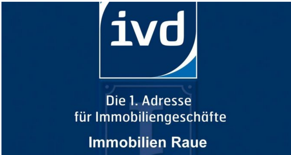
Mitglied im IVD