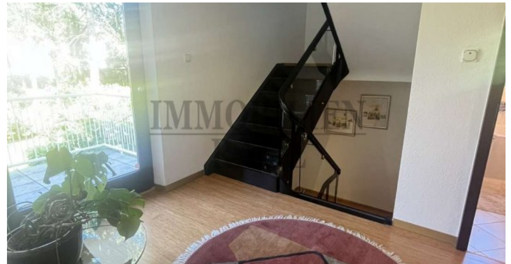
Flur im OG