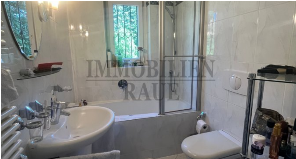
Bad im OG