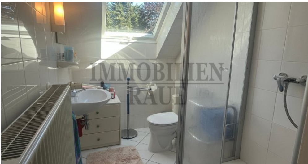
Bad im DG