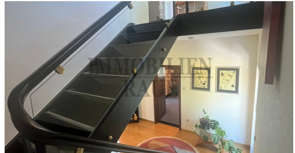
Treppenhaus OG zum DG