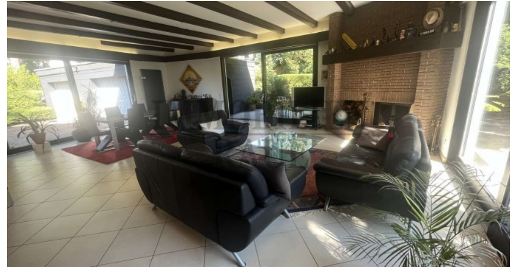
Großes Wohn- Esszimmer