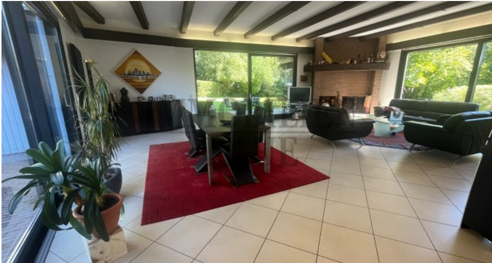
Großes Wohn- Esszimmer