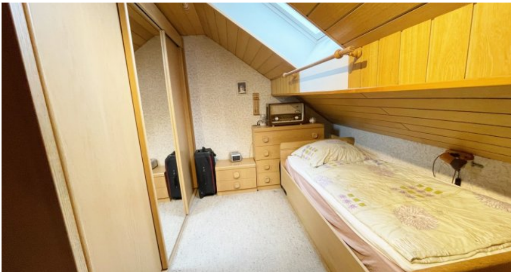
Schlafen 3 DG