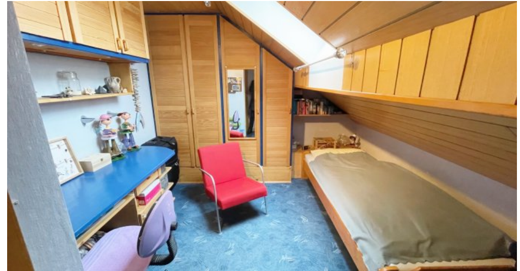
Schlafen 1 DG