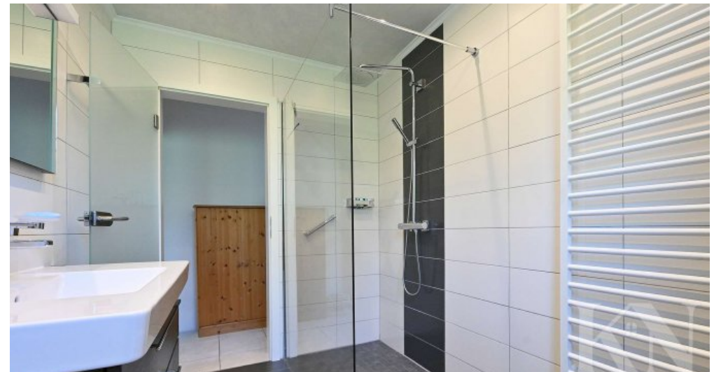
Badezimmer Untergeschoss 2