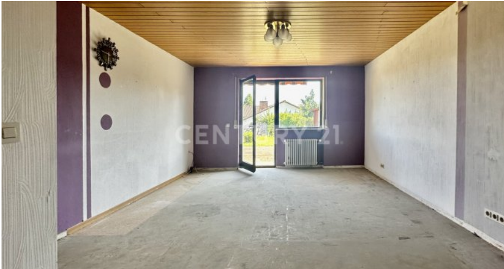
Mögliches Schlafzimmer mit Zugang zum Garten