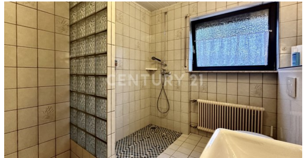
Badezimmer UG mit Blick zur Dusche