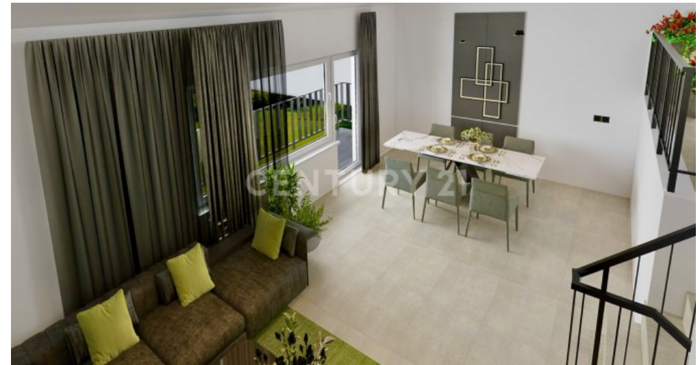
So könnte ihr WZ renoviert u. modern möbliert aussehen