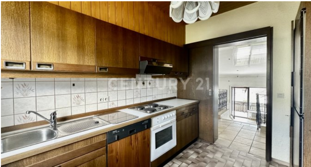
Küche mit Blick zur Tür zur Galerie