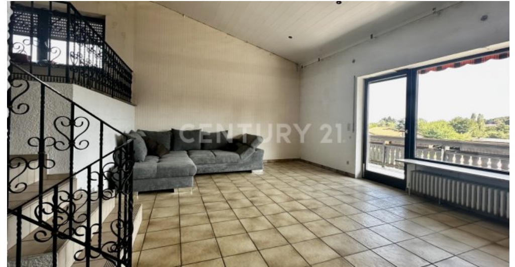
Wohnzimmer mit Blick zum Fensterelement und Balkontür