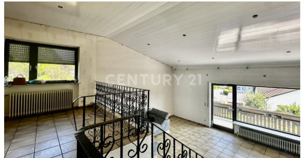
Galerie - Ansicht Treppe