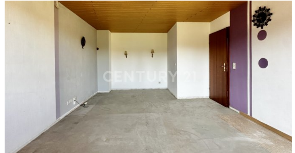
Schlafzimmer - Ansicht Fenster