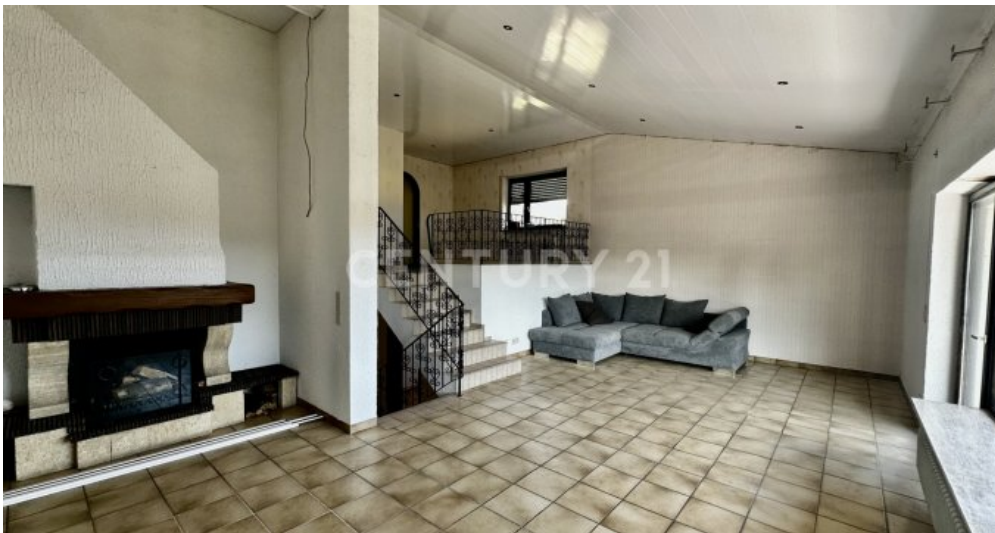
Wohnzimmer: entgegengesetzte Ansicht