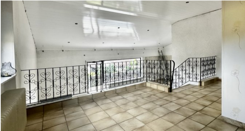
Galerie - lichtdurchflutet