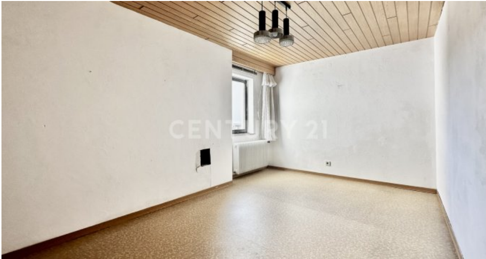
Zimmer 2 - links neben der Treppe