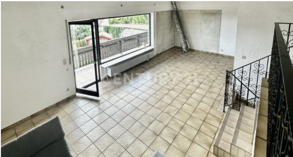
Wohnzimmer - Ansicht Galerie