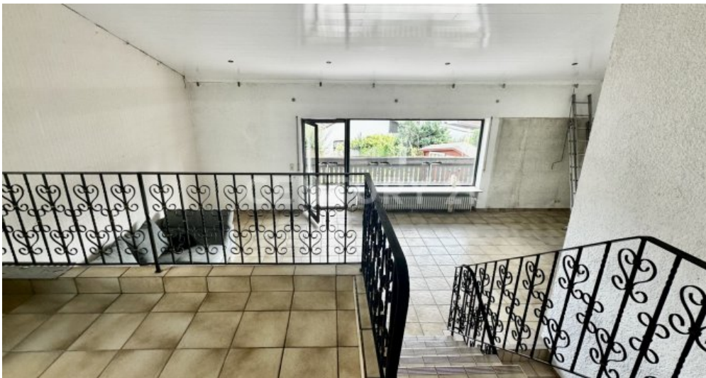
Galerie - Treppe zum Wohnzimmer