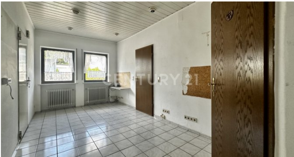
Hauswirtschaftsraum mit Gäste-WC und Zugang zur Garage