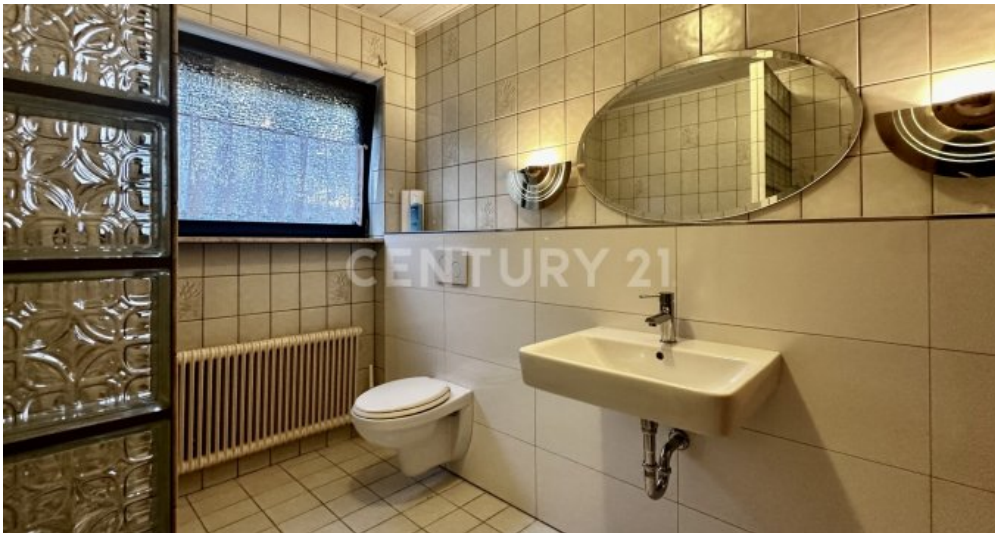
Badezimmer mit Blick zum Fenster