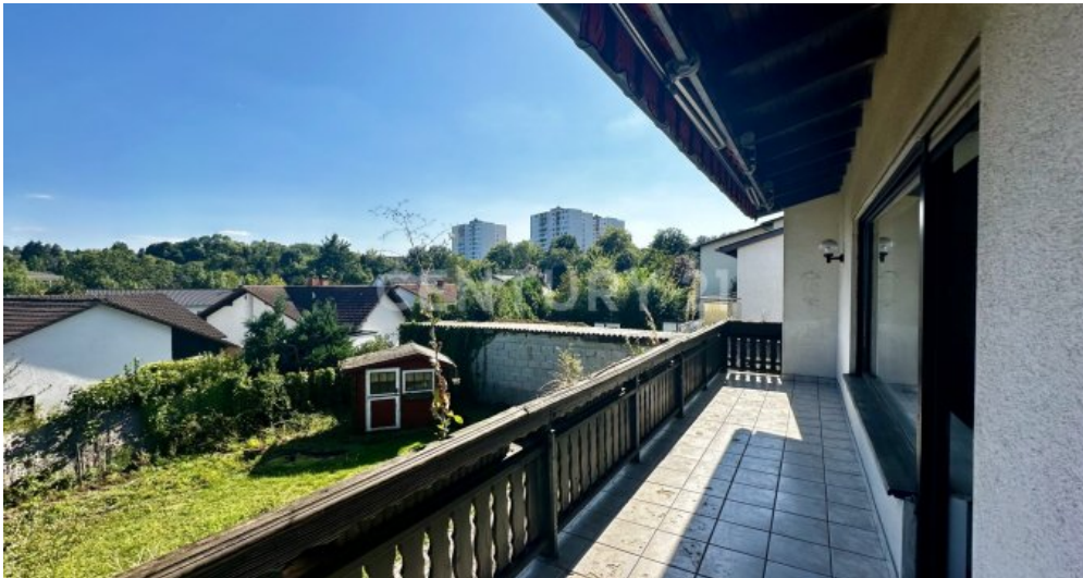
Balkon mit schöner Aussicht