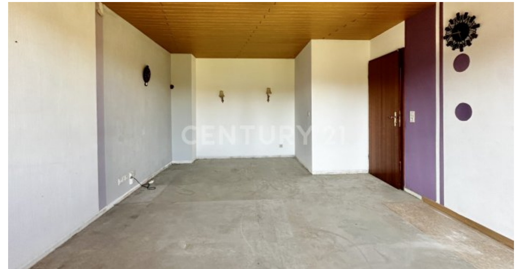
Schlafzimmer - Ansicht Fenster