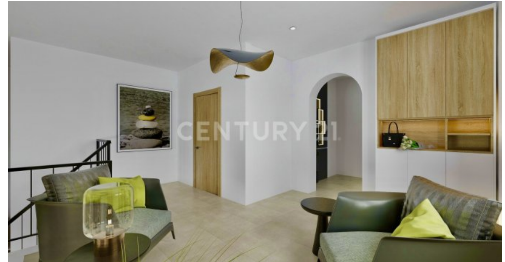
So könnte ihre Galerie renoviert und modern möbliert aussehen