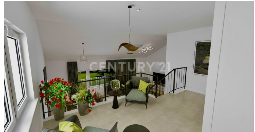
Visualisierung der Galerie