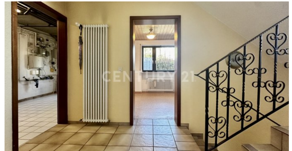
Flur mittlere Halbetage mit 2 Zimmer und Keller