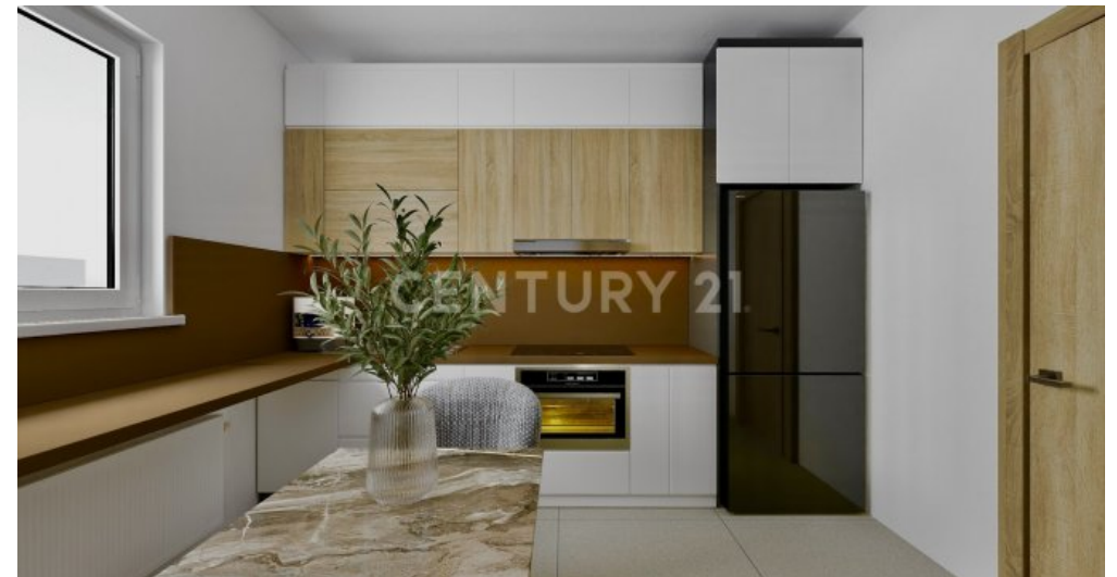
So könnte ihre Küche modern möbliert und renoviert aussehen