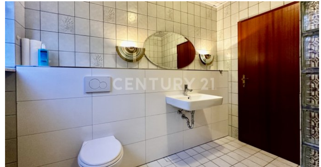
Badezimmer mit Blick zum Waschbecken