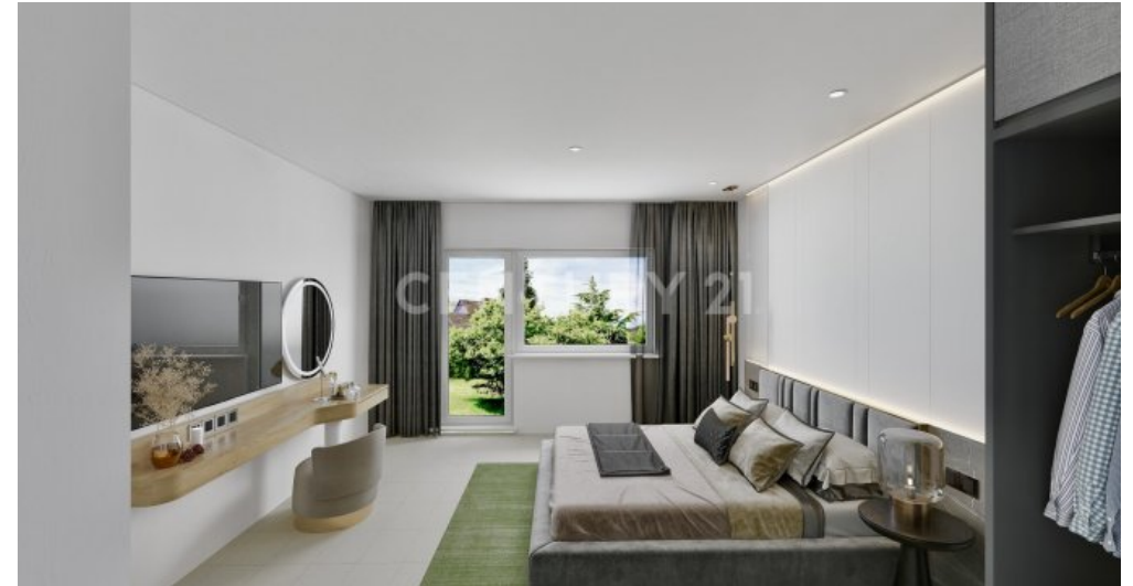
So könnte ihr Schlafz. renoviert u. eingerichtet aussehen