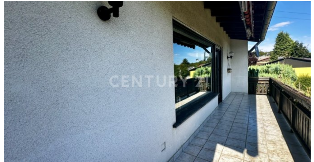
Balkon mit entgegengesetzter Ansicht