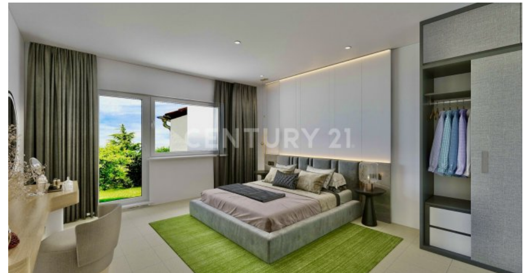
Visualisierung Schlafzimmer - renoviert und eingerichtet-