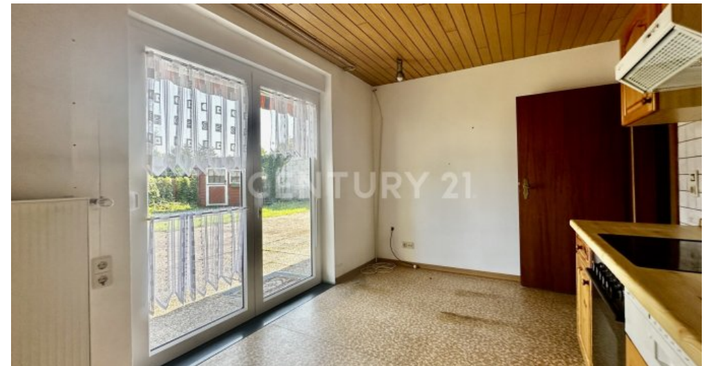
Küche UG mit Blick zur Tür