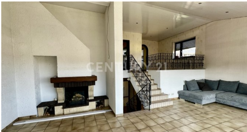
Wohnzimmer mit Blick auf den Kamin