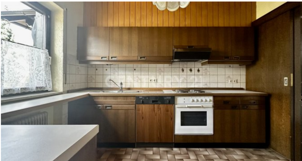
Küche - Ansicht Tür zum Hauswirtschaftsraum