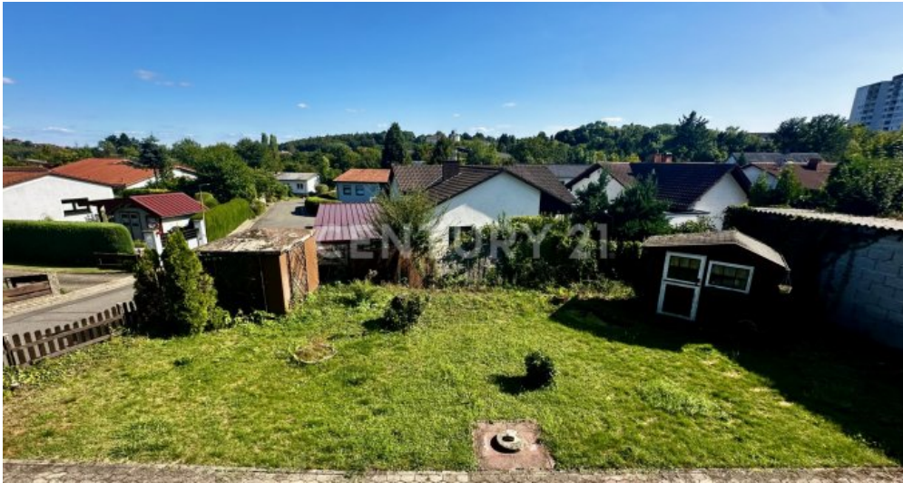
Balkon mit blick in den Garten