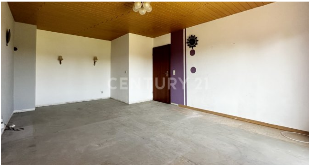
Schlafzimmer ist groß und geräumig