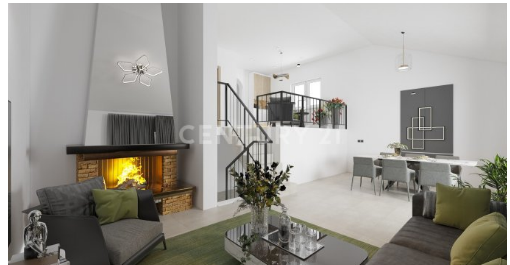
Visualisierung WZ mit Blick auf den Kamin