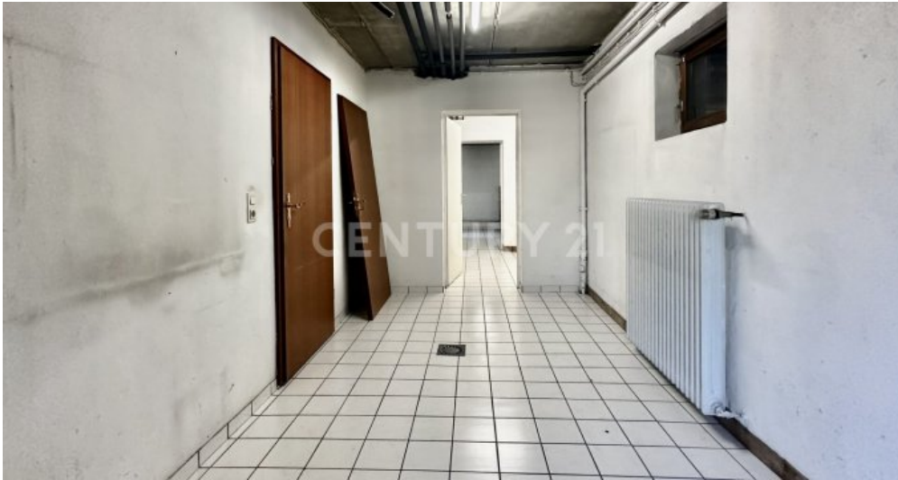
Kellerraum 1 - entgegengesetzte Ansicht