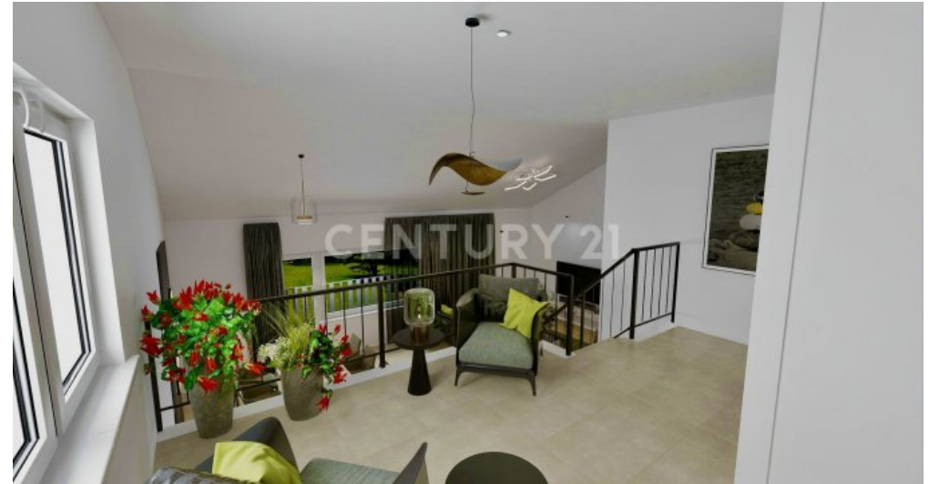
Visualisierung der Galerie