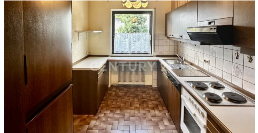
Küche - Ansicht Tür