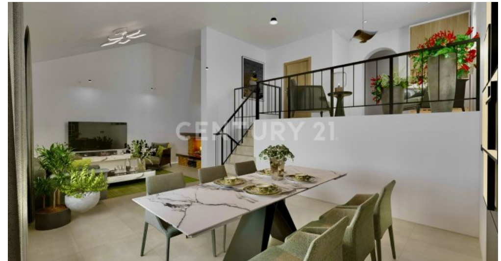
Visualisierung - mit wenig Aufwand könnte ihr WZ so aussehen