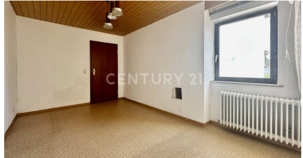
Zimmer 2 mit Blick zur Tür