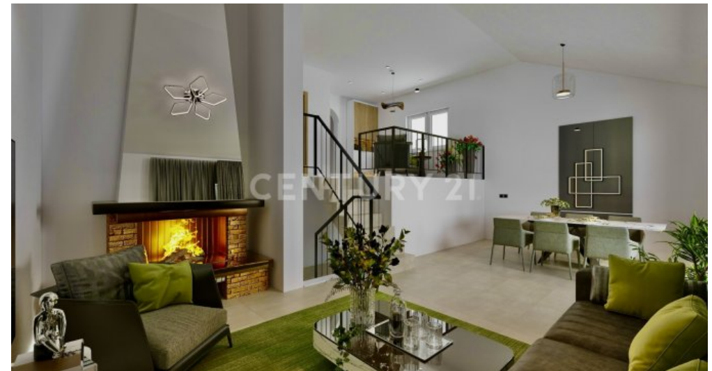
Visualisierung Wohnzimmer mit modernen Möbeln und Deko