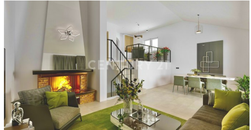
Visualisierung Wohnzimmer mit modernen Möbeln und Deko