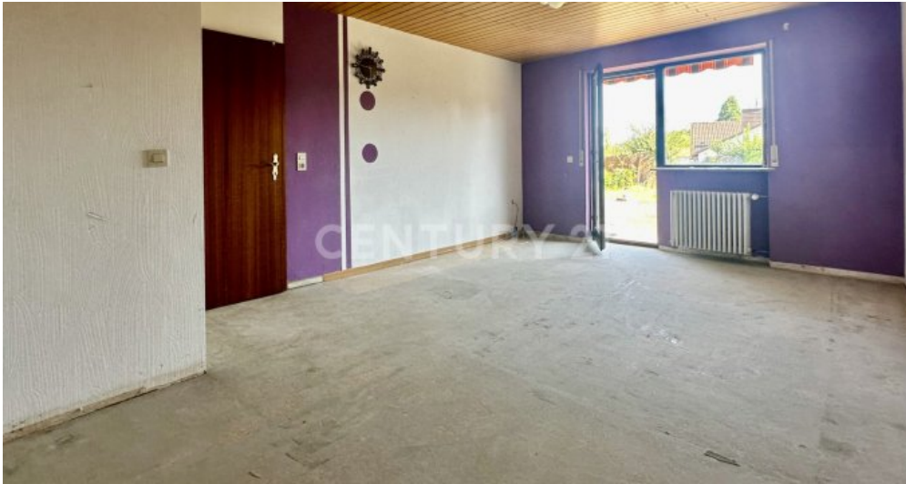
Schlafzimmer mit Blick zur Tür