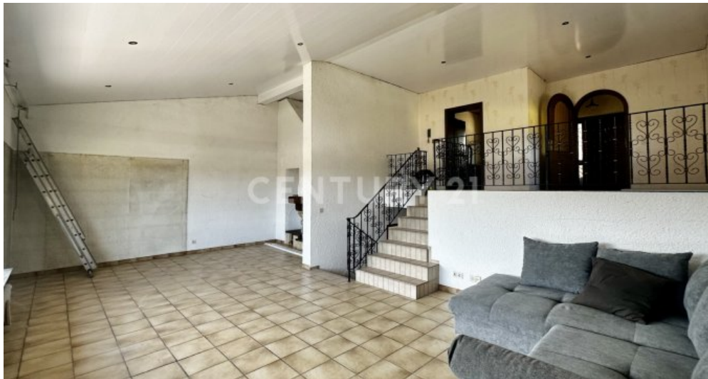
Wohnzimmer mit Blick zur Galerie