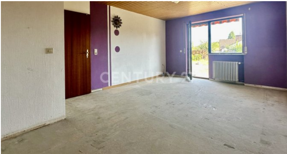
Schlafzimmer mit Blick zur Tür