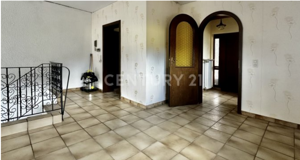
Galerie mit Blick zum Eingangsbereich und Tür zur Küche