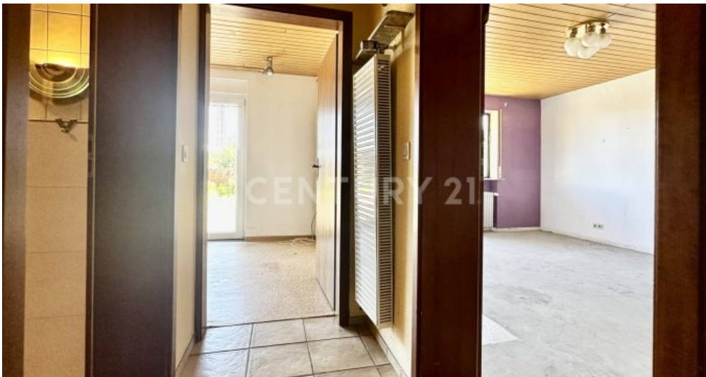
Flur UG mit Blick ins Schlafz. und Küche