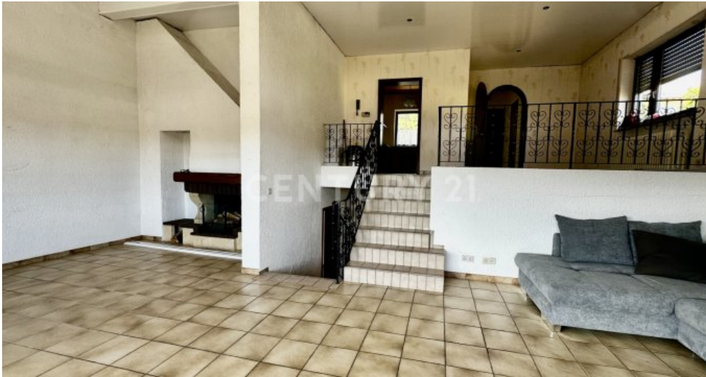
Wohnzimmer mit Blick zur Galerie