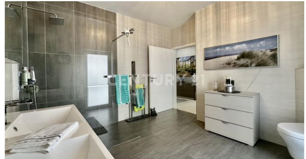
Großes Badezimmer mit Blick zur Tür