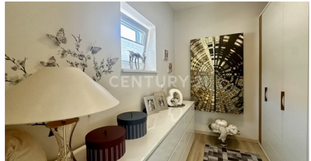
Ankleideraum - Ansicht Tür