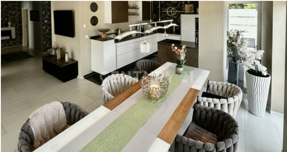
Essbereich mit Blick zur Küche