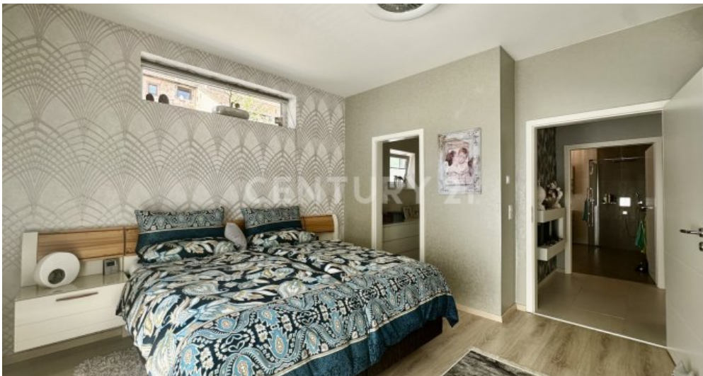
Schlafz. mit Blick zur Tür und Ankleide