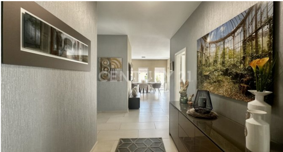
Flur zu den Zimmern mit Blick zum Wohnbereich