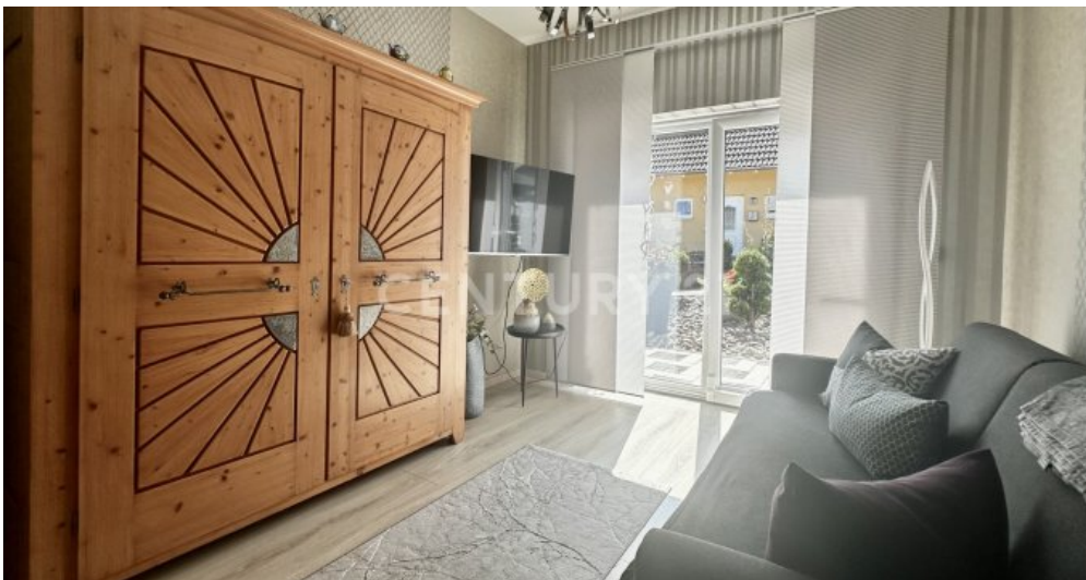
Gästezimmer mit Zugang zum Garten