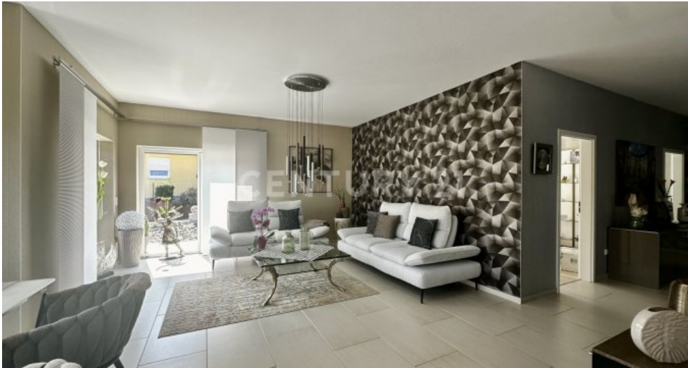
Wohnbereich - großzügig und toll gestaltet