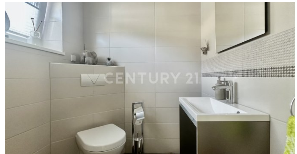
Gäste - WC mit Tageslichtfenster