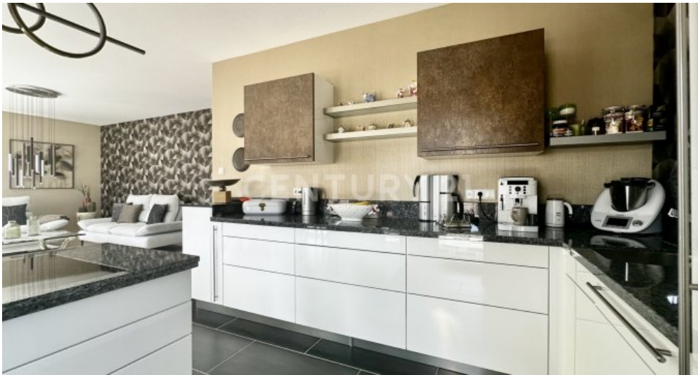
Küche Ansicht Terrassentür