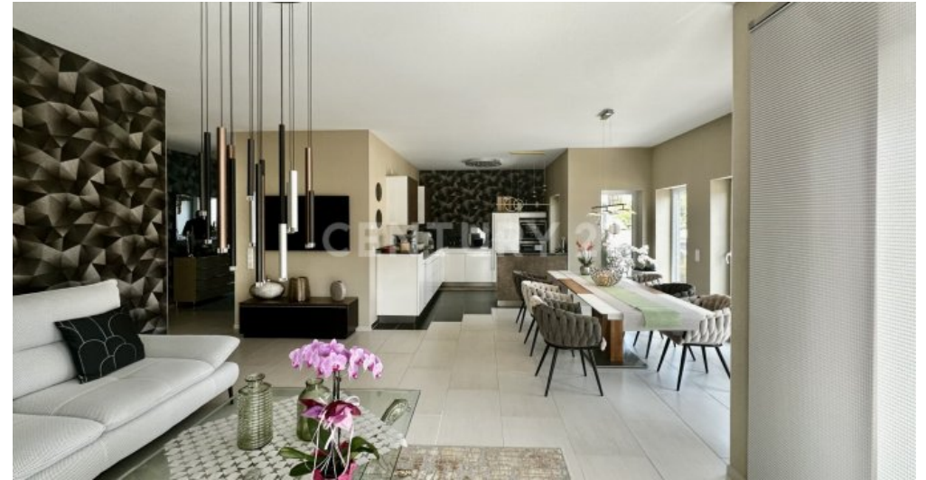
Wohnbereich mit Blick zur Küche