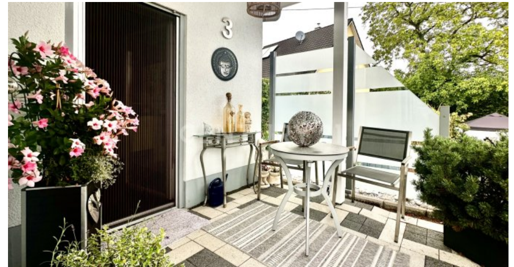
Lebensqualität pur - Terrasse