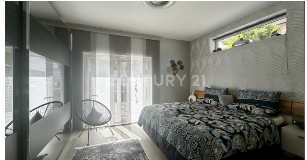
Schlafzimmer mit Blick zu dem Fensterlement