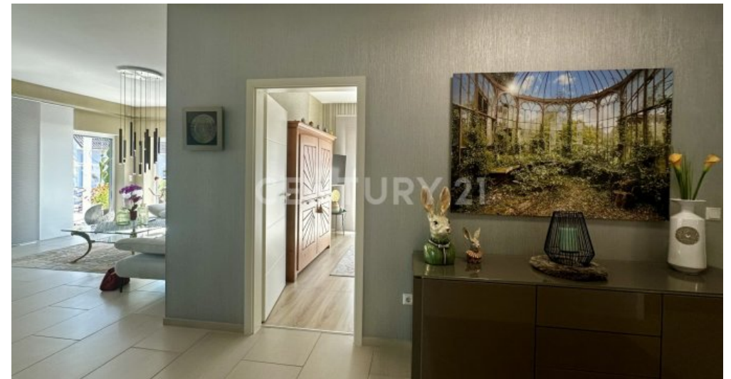
Flur zu den Zimmern - Blick aufs aktuelle Gästezimmer