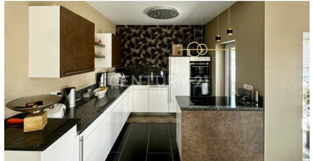
Küche mit hochwertigen Geräten