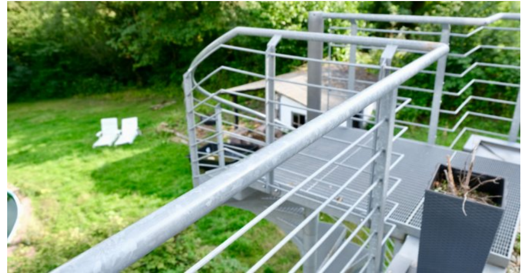
Edelstahl-Treppe in den Garten