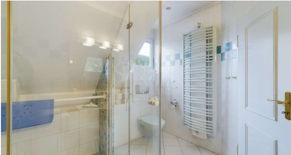
DG - Badezimmer