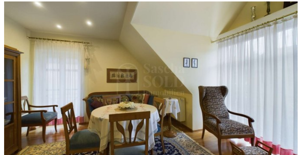
DG - Lesezimmer