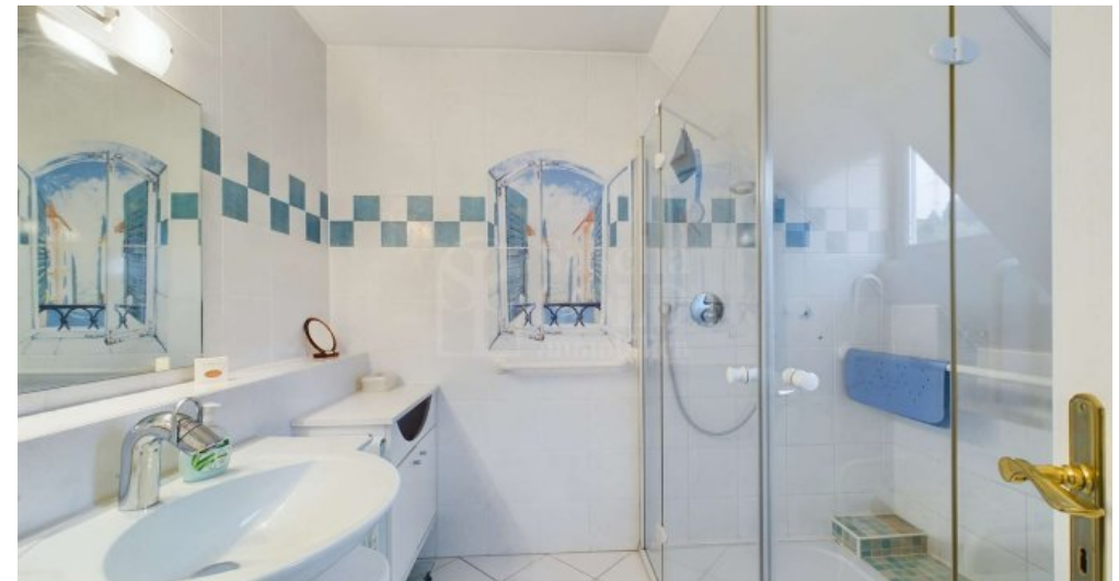
DG - Badezimmer