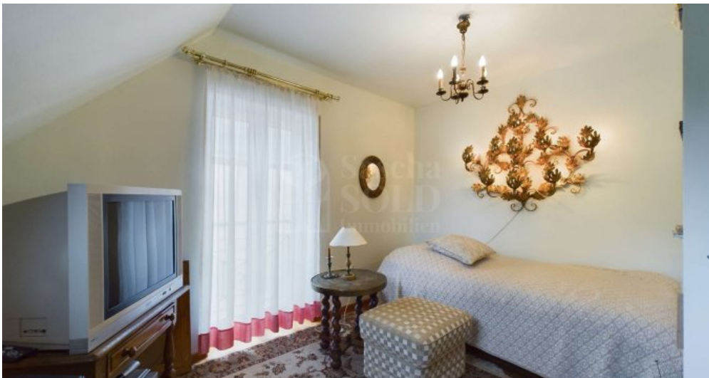
DG - Schlafzimmer