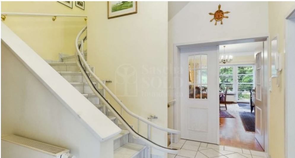
Treppe zum DG