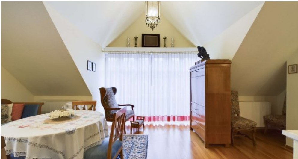
DG - Lesezimmer