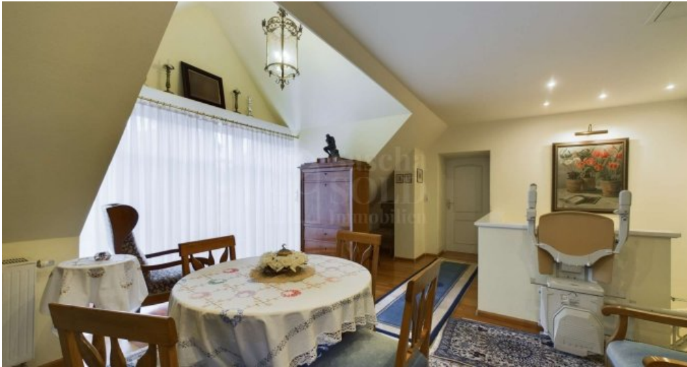
DG - Lesezimmer