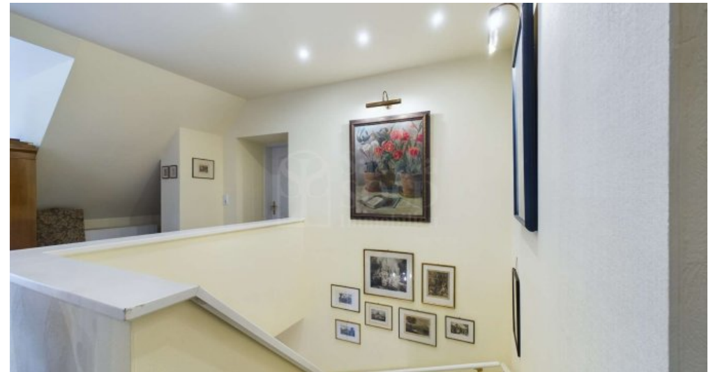
DG - Treppe