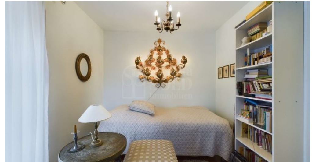
DG - Schlafzimmer