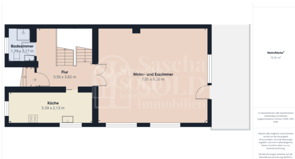
Grundriss - EG