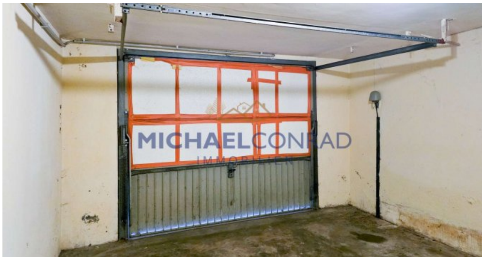
Michael Conrad Immobilien