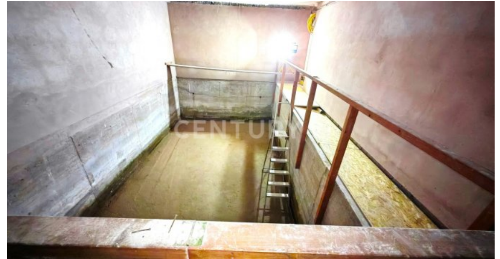
Innenpool Vorbereitung mit riesiger, bodentiefer Fensterfront