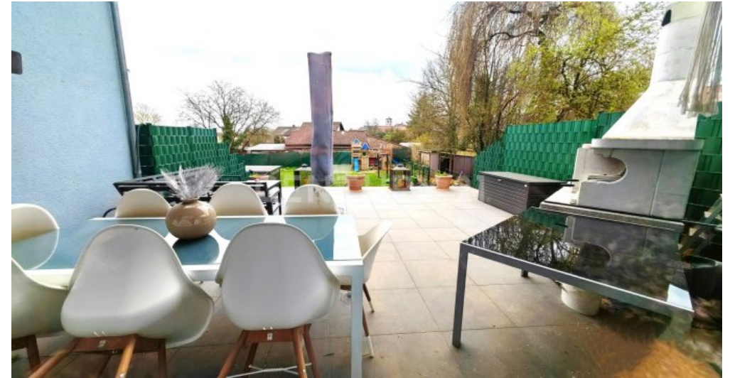
Große Südost Terrasse