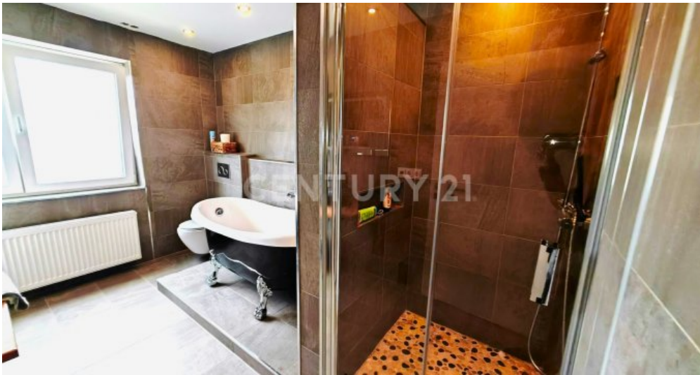
Luxusbad mit freistehender Wanne und großer Regendusche, de