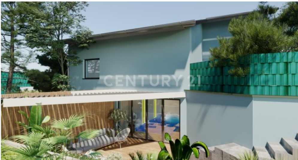
Pool Terrasse visualisiert