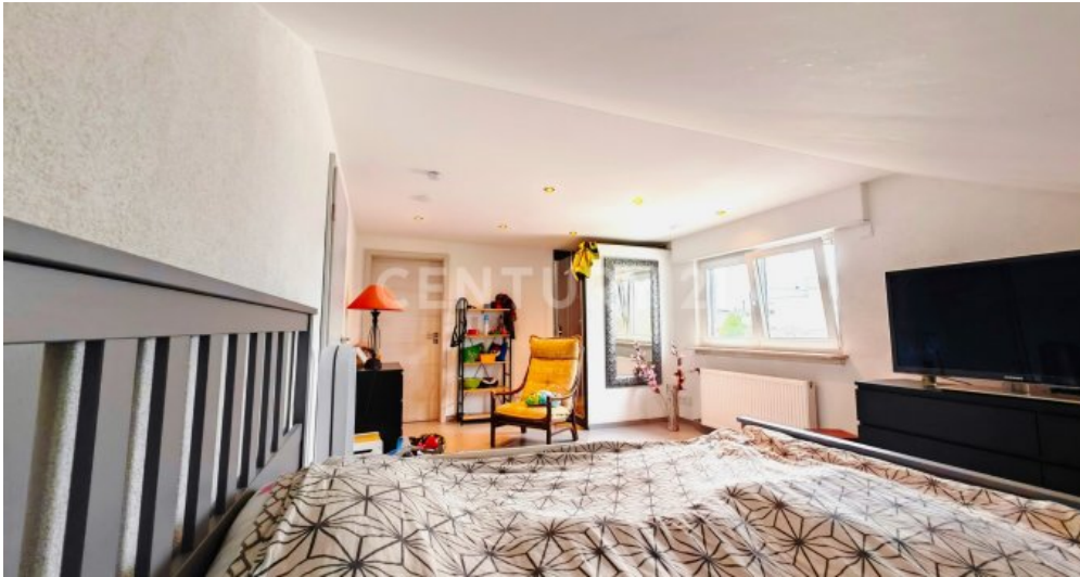
Elternschlafzimmer mit Dusche und direktem Zugang zur Anklei