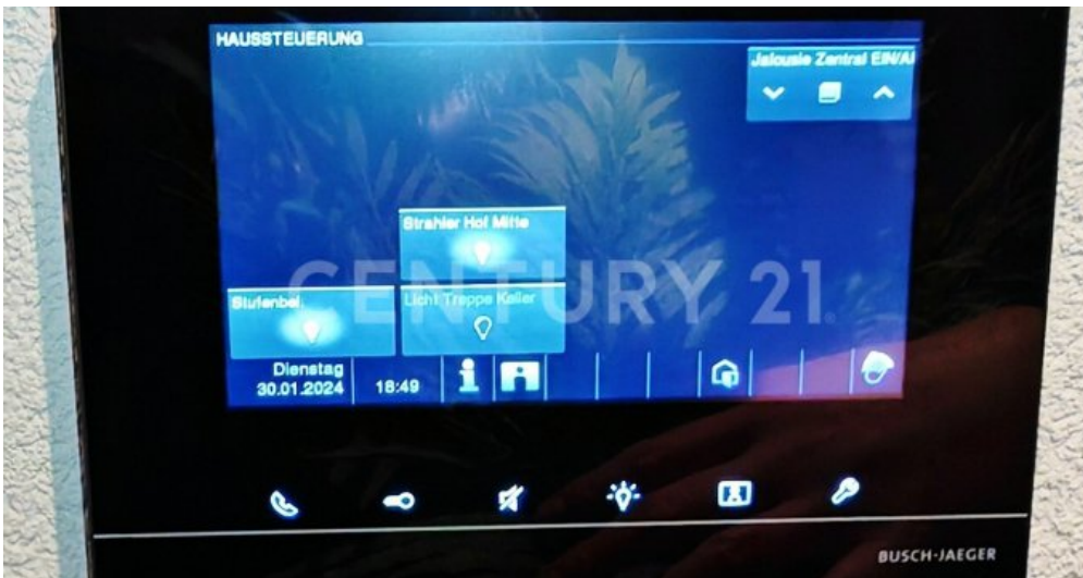
KNX Bus Smart Home Steuerung für komplette Videoüberwachung,