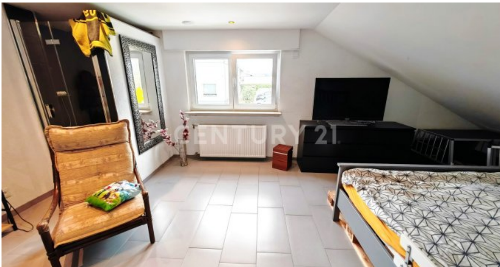
Schlafen, Duschen und und und...