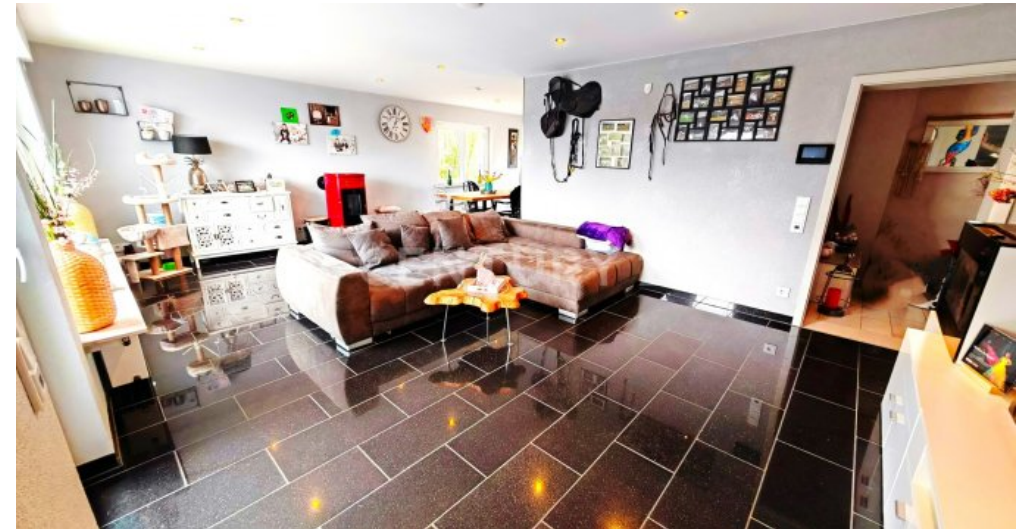
Viel Platz für ein gutes Leben