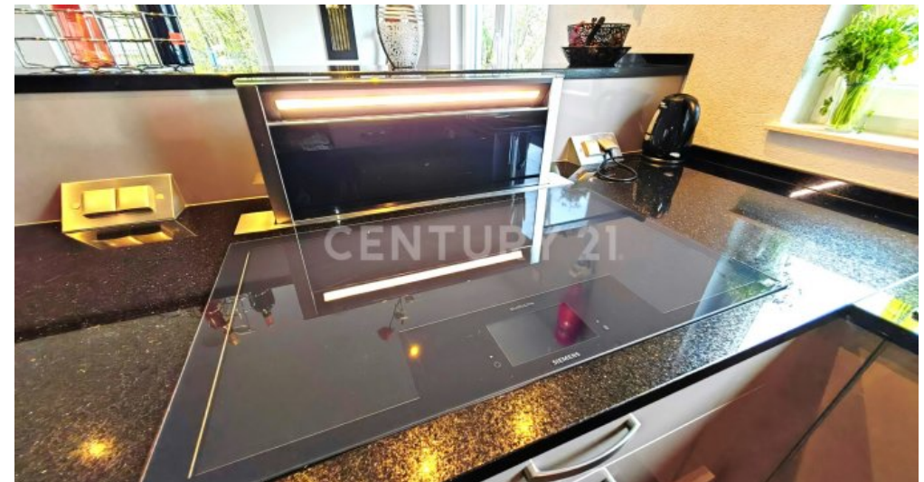
6000€ Luxus Kochfeld mit ausfahrbarer, beleuchteter Dunstabz