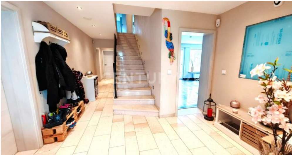
Edles Entrée mit hellem Natrustein und viel Platz