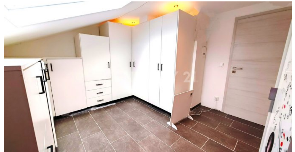
Geräumige Ankleide beim Master Bedroom