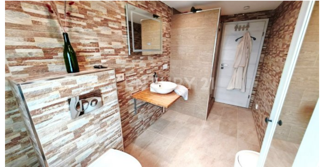
Das 2. neue Bad (OG)