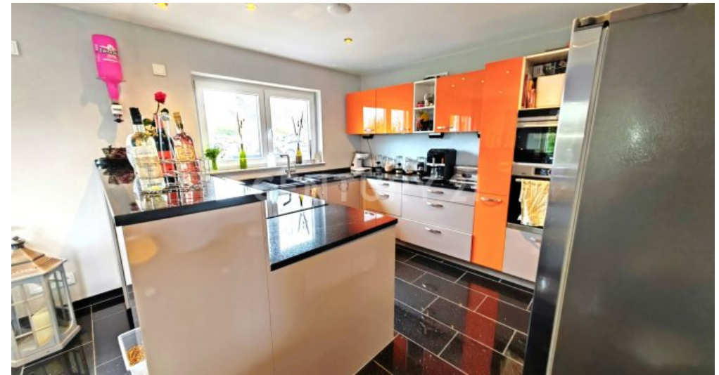
Nobelküche vom Feinsten