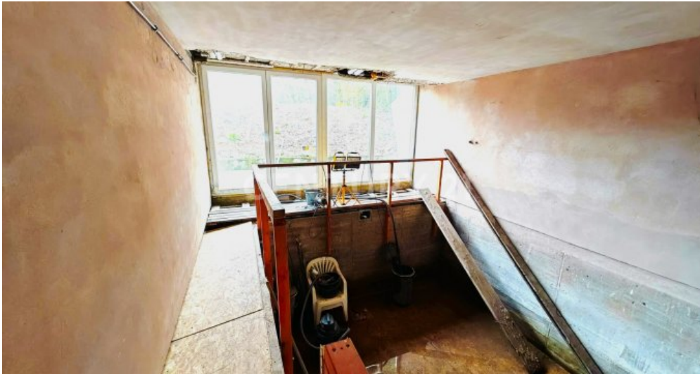
Poolvorbereitung mit großer Fensterfront und Zugang zur Pool