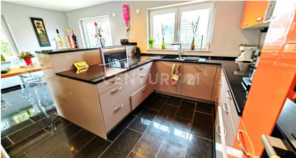
Technik die begeistert