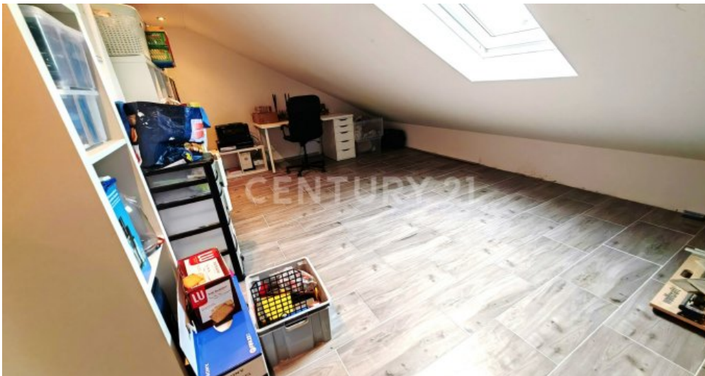
Arbeits, Kinder- oder Gästezimmer