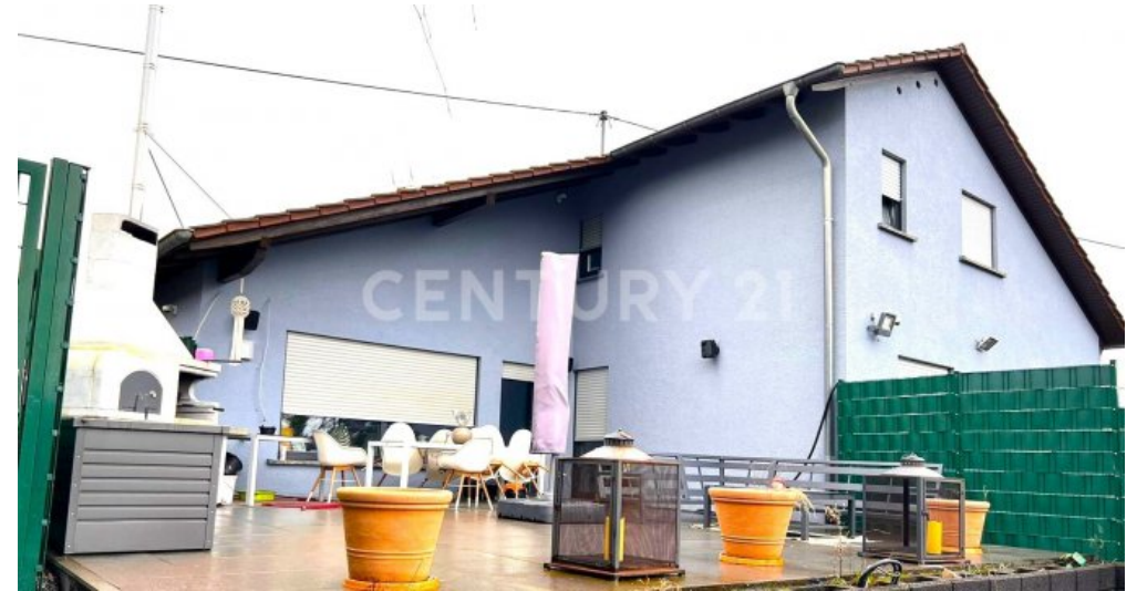
Riesige Sonnenterrasse bietet Lebensqualität pur