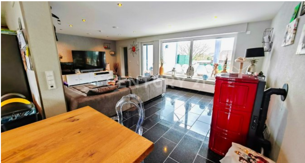
Riesige Fensterfront mit Zugang zur großen Terrassen