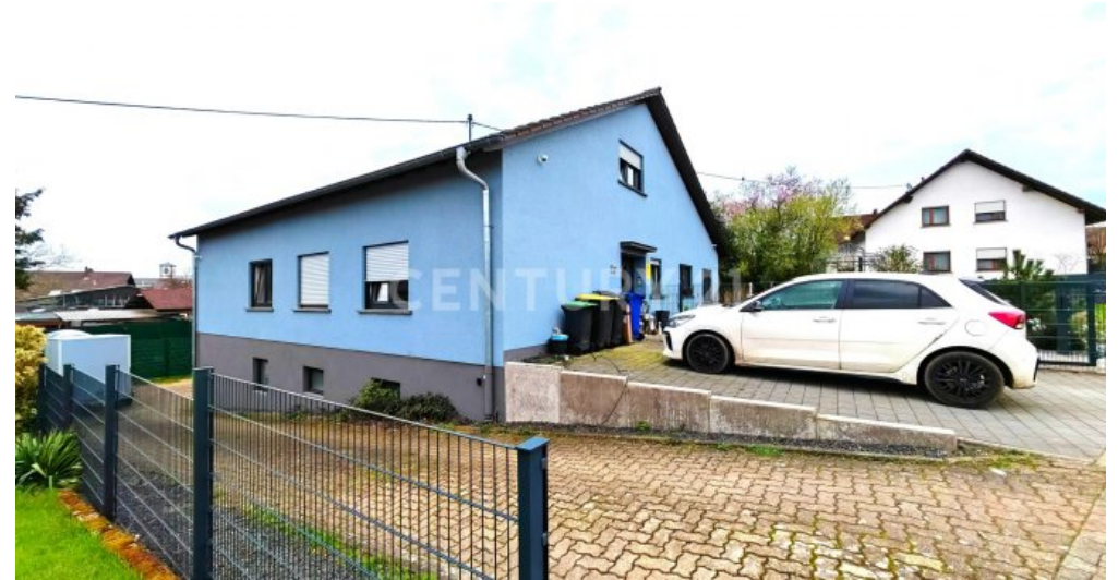
Garage für 2 Autos + 2 Stellplätze vorm Haus und 3 im Hof