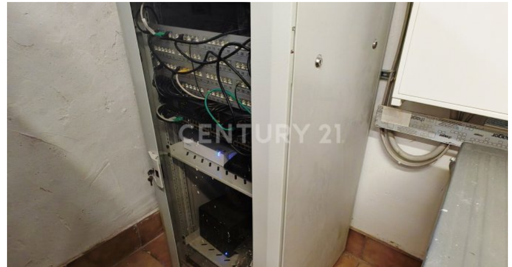
Eigener Serverschrank mit Netzwerkkabel in jedem Zimmer mehr