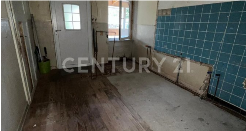
Vorraum + Kellereingang