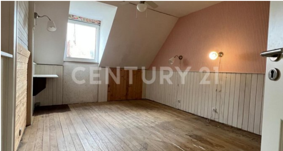
2. Schlafzimmer OG