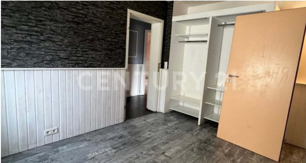
1. Schlafzimmer OG