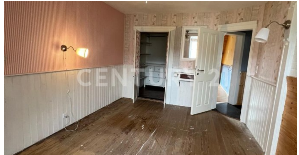
2. Schlafzimmer OG