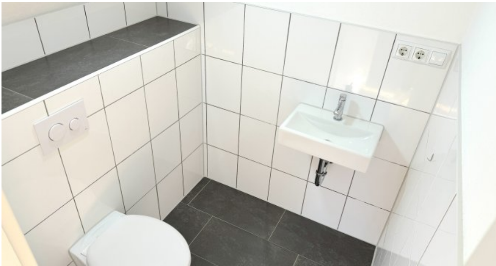
WC im DG