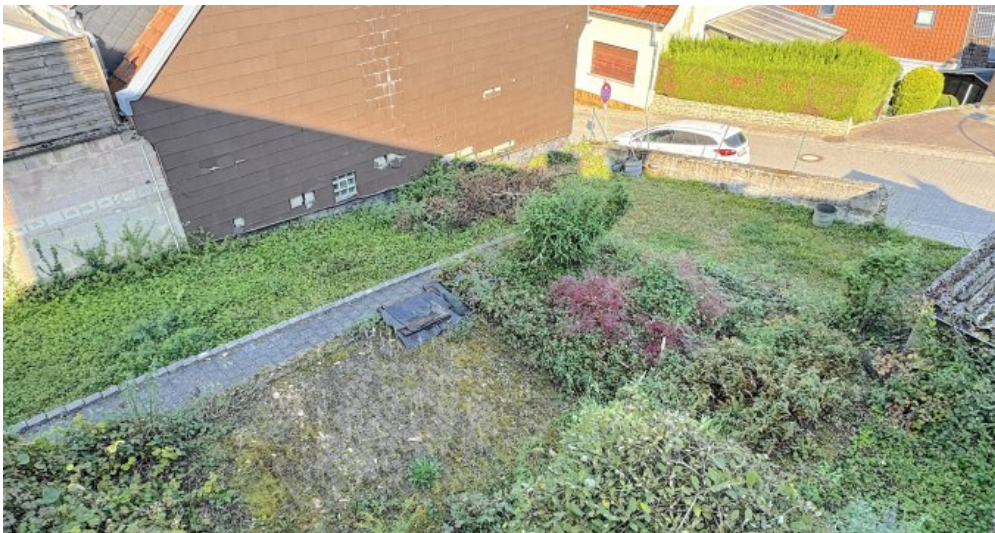
Garten mit Carport