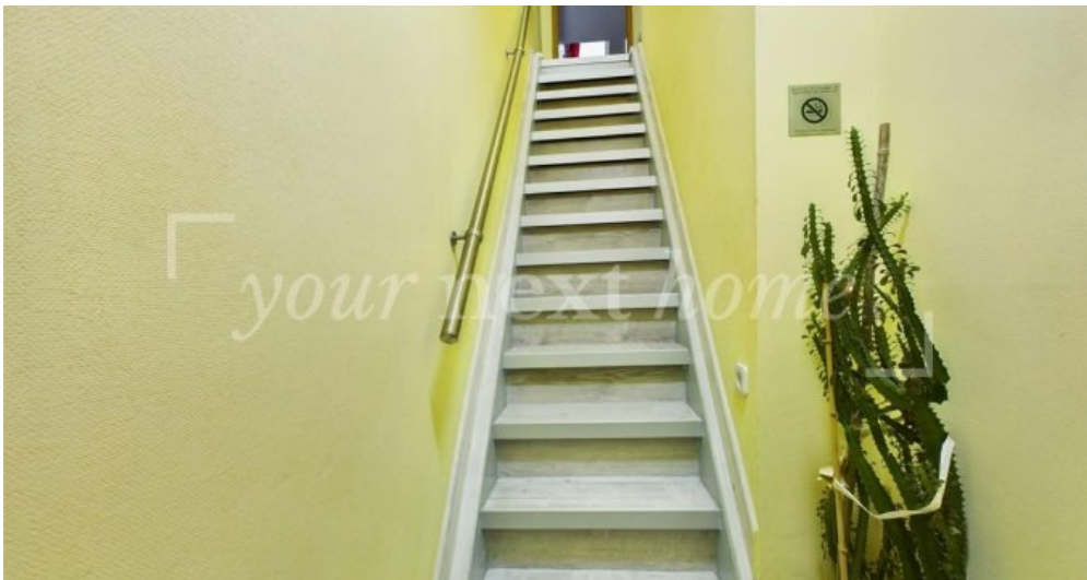
Treppen zum Obergeschoss