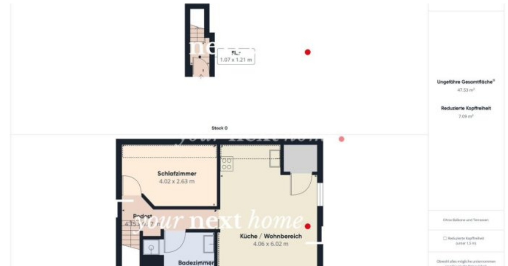
Grundriss OG WW gesamt