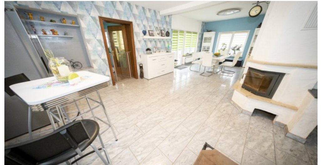
Esszimmer mit Kamin