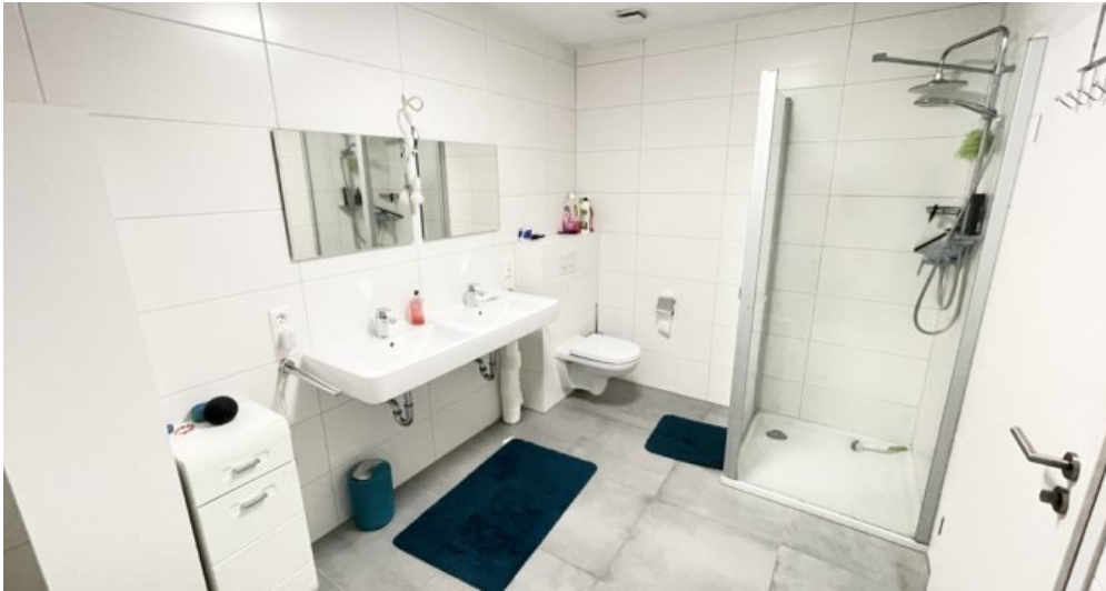
Bad mit Dusche und Wanne