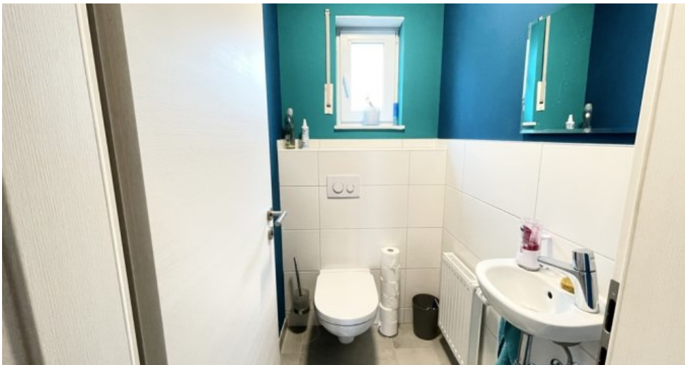
Gäste - WC