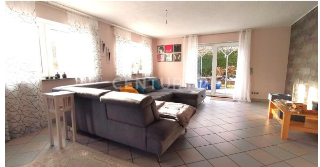
Das Wohnzimmer mit Blickrichtung Garten