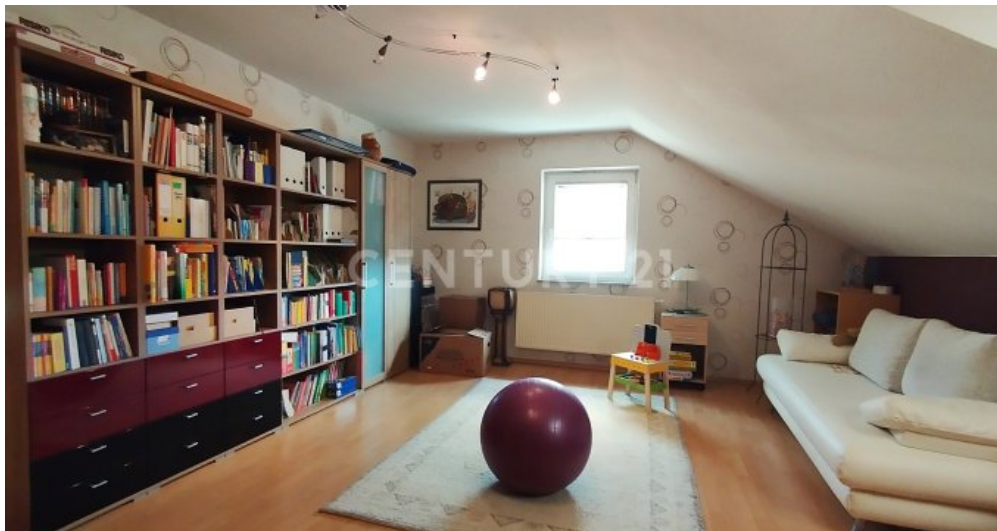
Das gemütliche Arbeitszimmer im Dachgeschoss