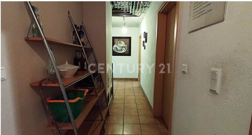
Der Flur im Kellergeschoss