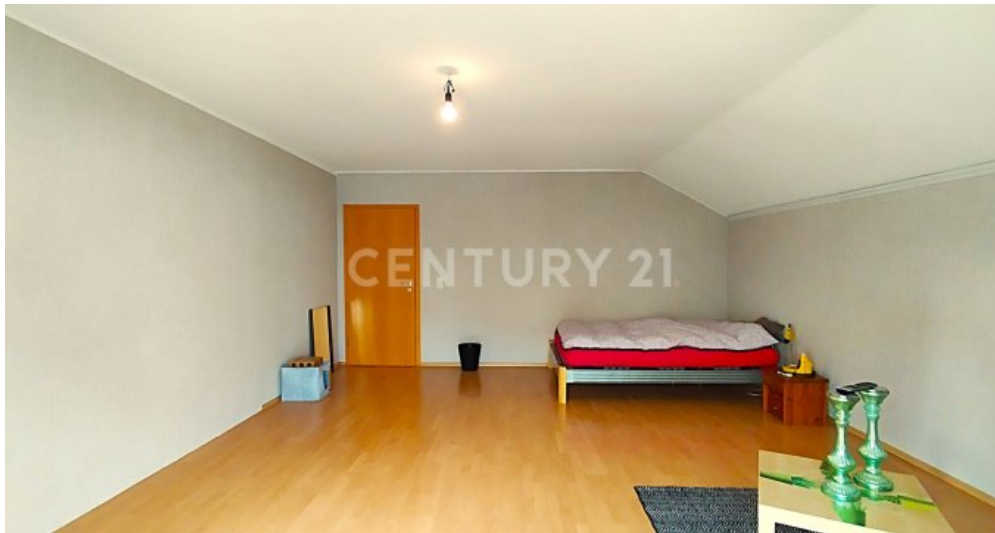
Das erste Schlafzimmer im Dachgeschoss in Richtung Flur