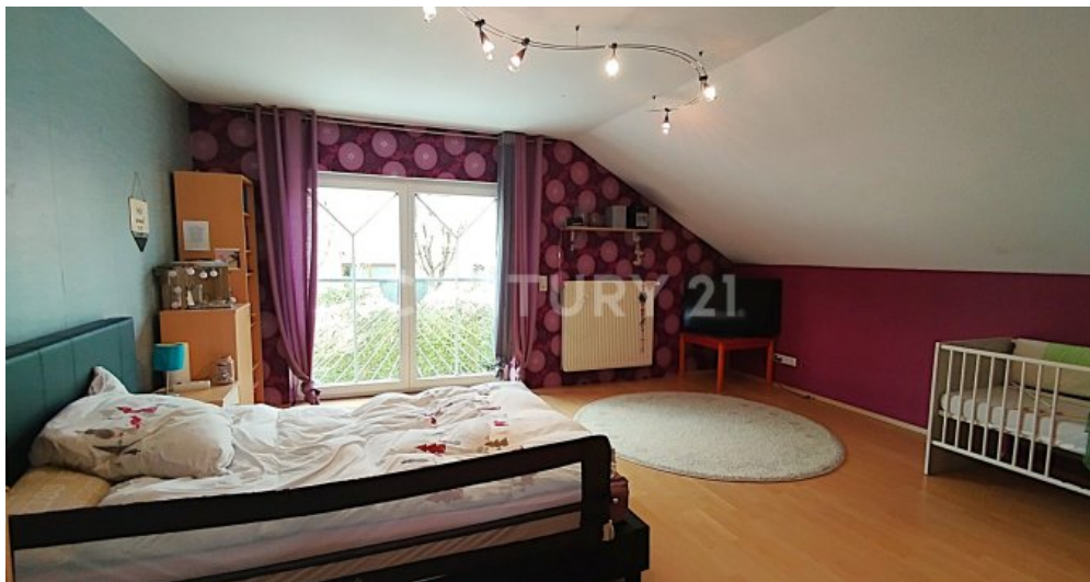
Das zweite Schlafzimmer im Obergeschoss in Richtung Garten