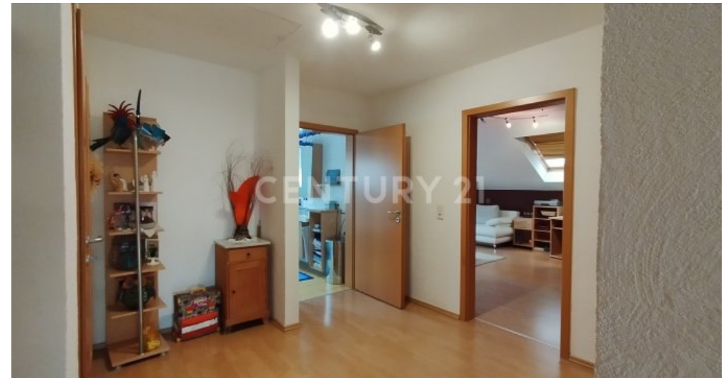
Der großzügige Flur im Dachgeschoss