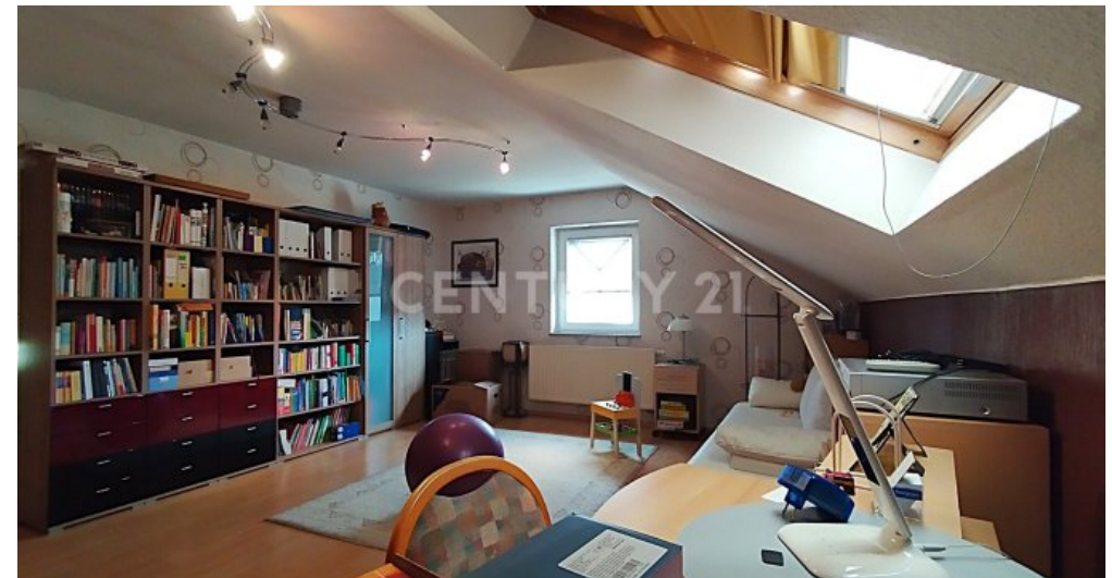
Das Arbeitszimmer im Dachraum mit 2 großen Fenstern