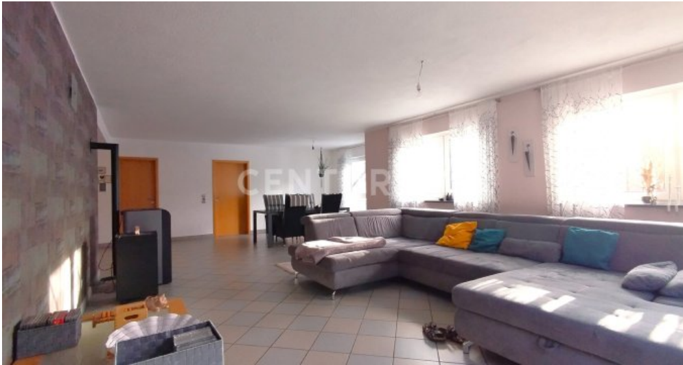
Das exklusive Wohnzimmer in Blickrichtung Essbereich