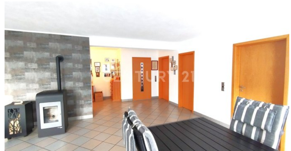
Der Essbereich mit Blickrichtung Flur und Treppenhaus