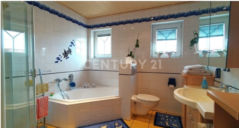
Das Badezimmer im Obergeschoss mit Eckbadewanne