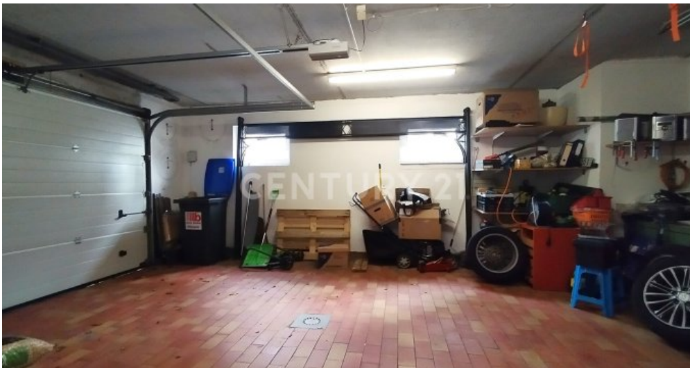
Die große geflieste Garage mit Zugang zum Kellerbereich