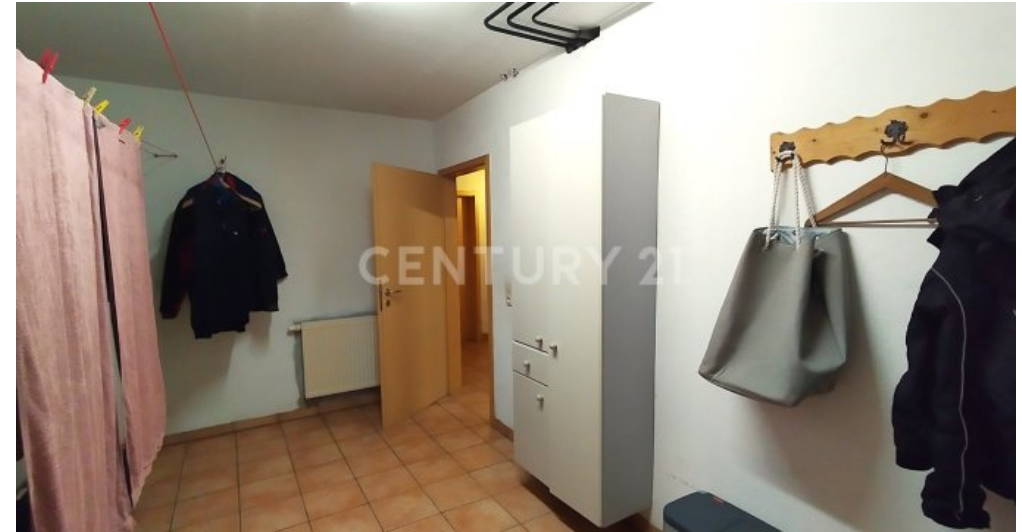
Die Waschküche im Kellergeschoss