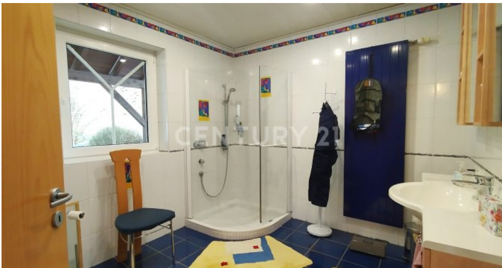
Das Badezimmer im Erdgeschoss mit begehbare Dusche