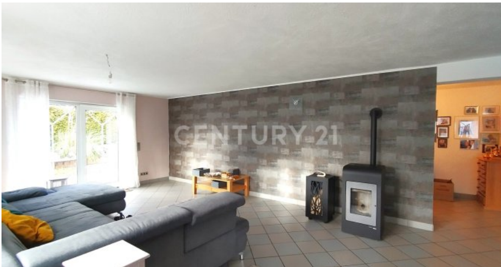
Das Wohnzimmer mit wunderschönem Pelletofen