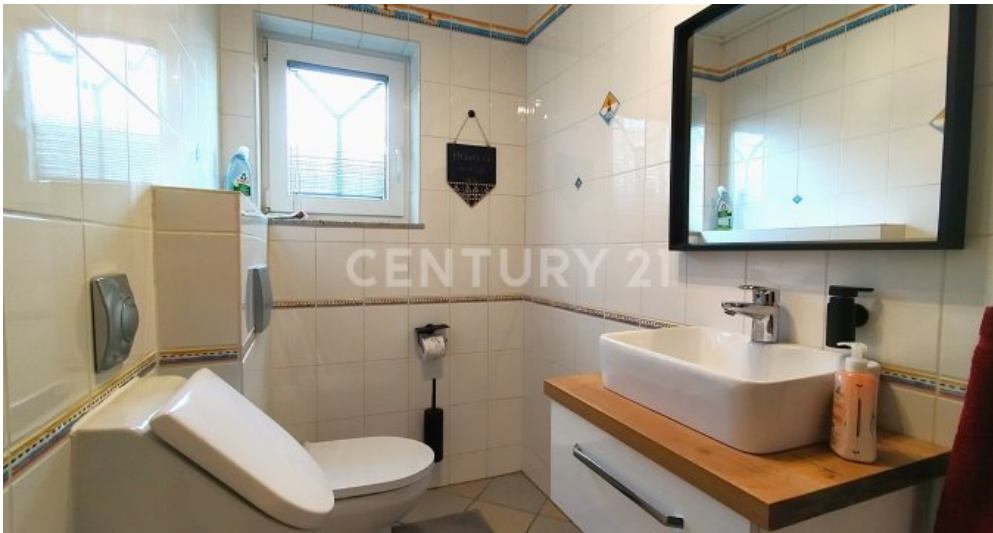
Das moderne Gäste WC im Erdgeschoss