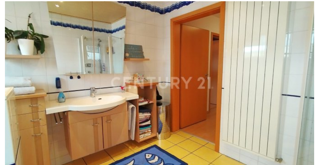
Das Designer - Badezimmer im Obergeschoss