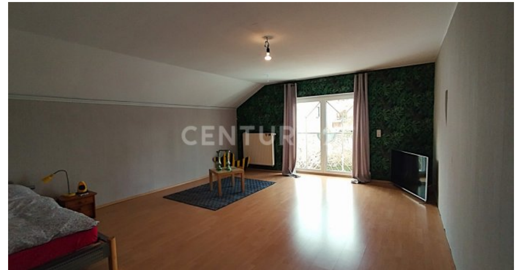
Das erste Schlafzimmer im Dachgeschoss in Richtung Garten