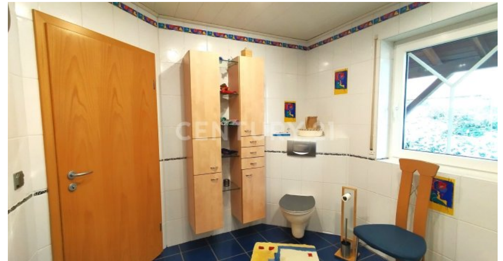
Das modern designte Badezimmer im Erdgeschoss