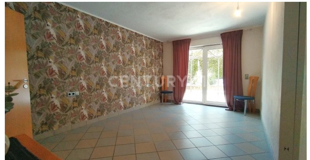
Das Schlafzimmer im Erdgeschoss mit Zugang zum Garten