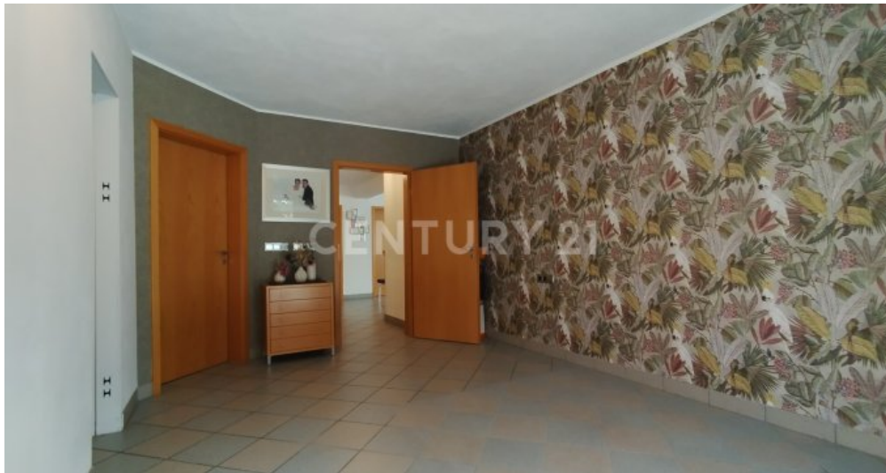
Das Schlafzimmer in Blickrichtung Flur