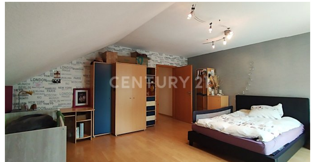
Das zweite Schlafzimmer im Obergeschoss in Richtung Flur