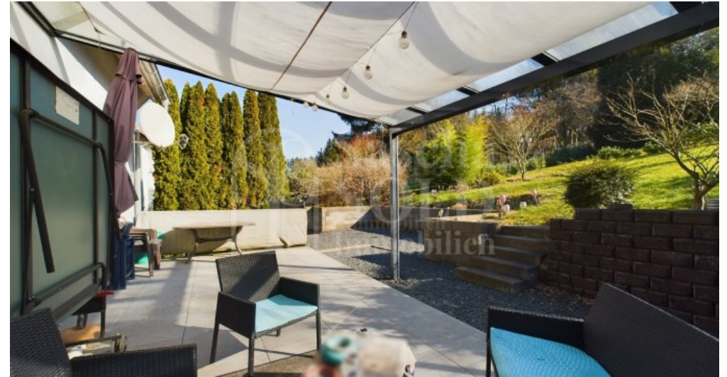
EG - Terrasse