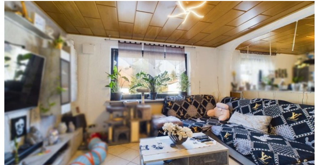
EG - Wohnzimmer