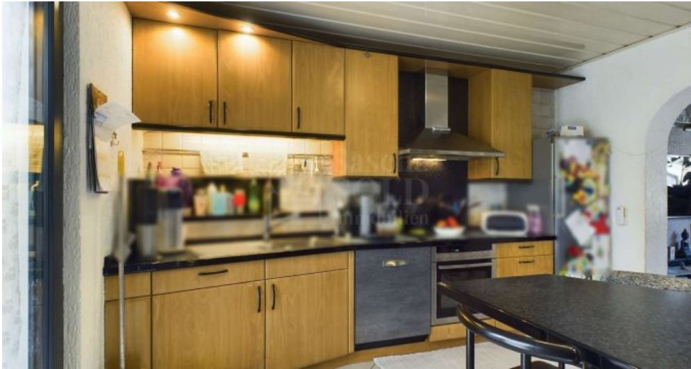
EG - Küche