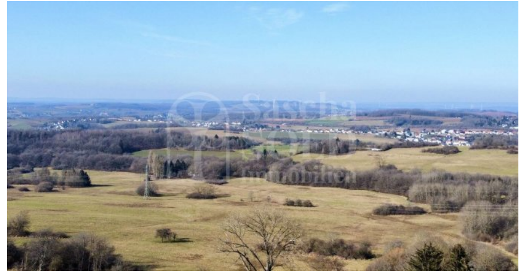
Die Landschaft von Heusweiler-Holz