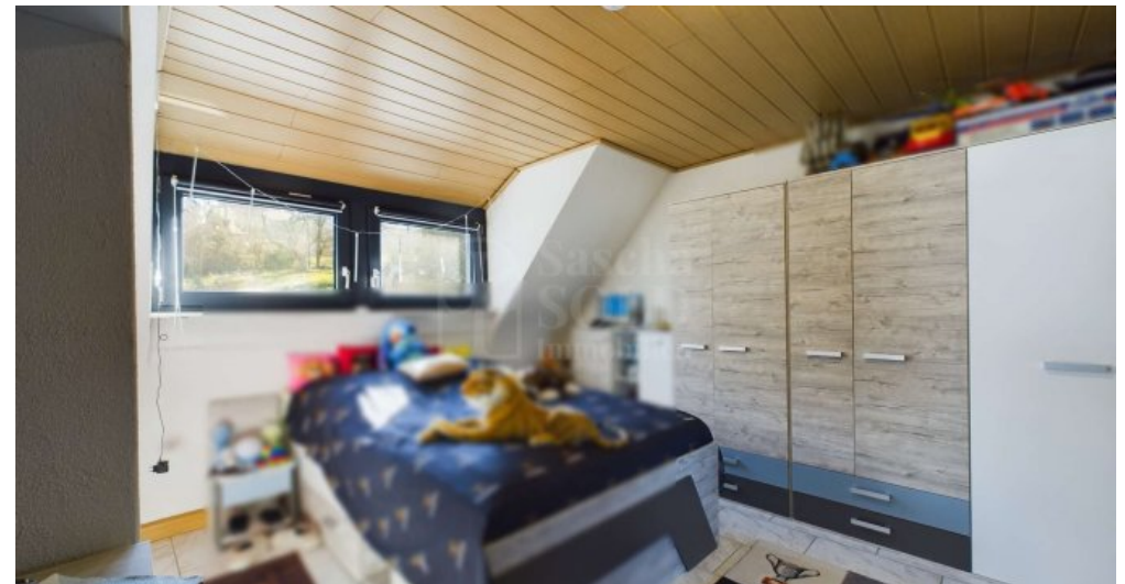
DG - Kinderzimmer 2