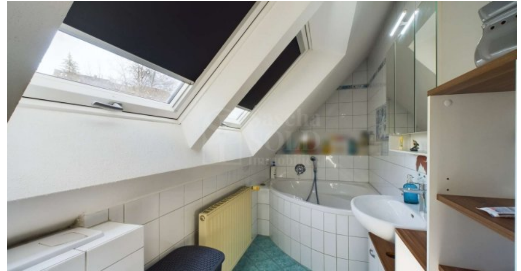
DG - Badezimmer