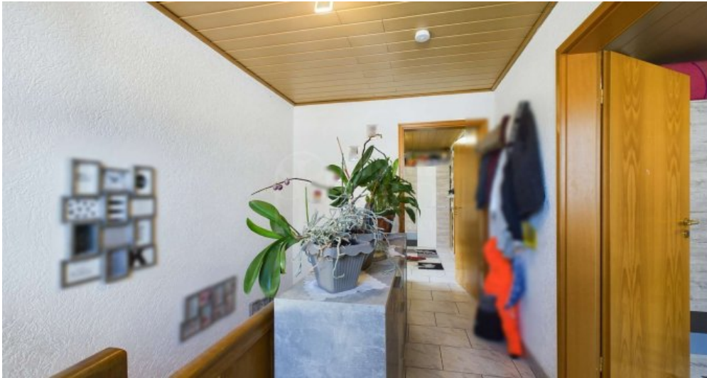
DG - Flur