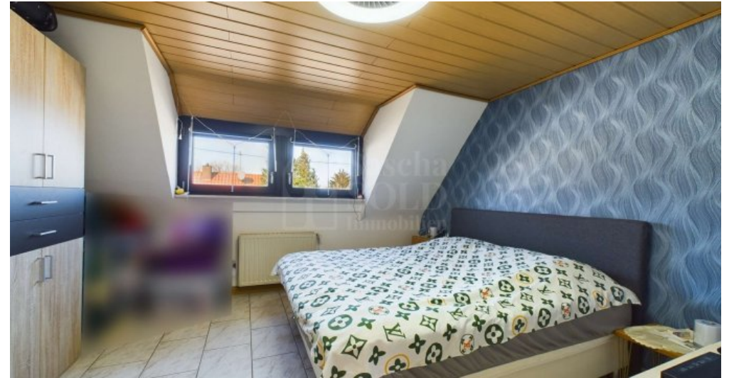
DG - Eltern Schlafzimmer