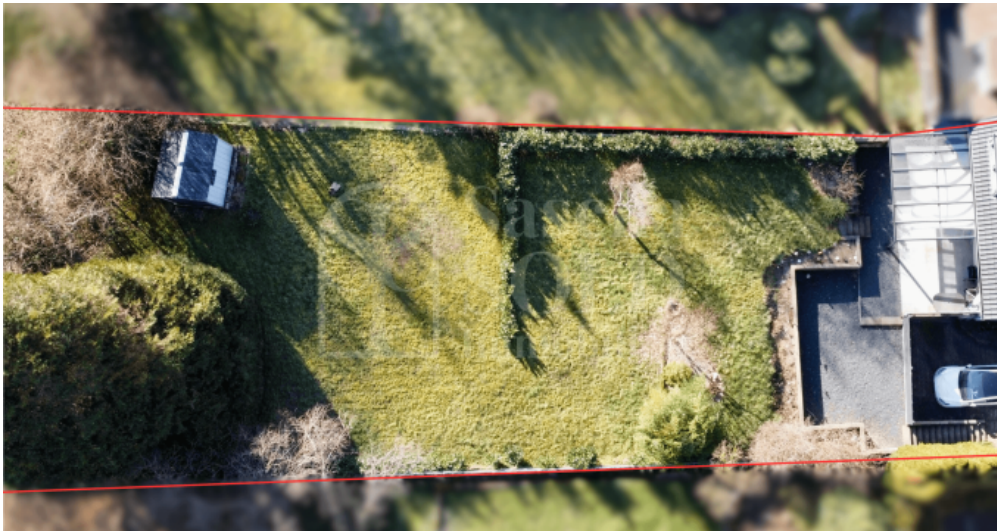
Garten und Terrasse