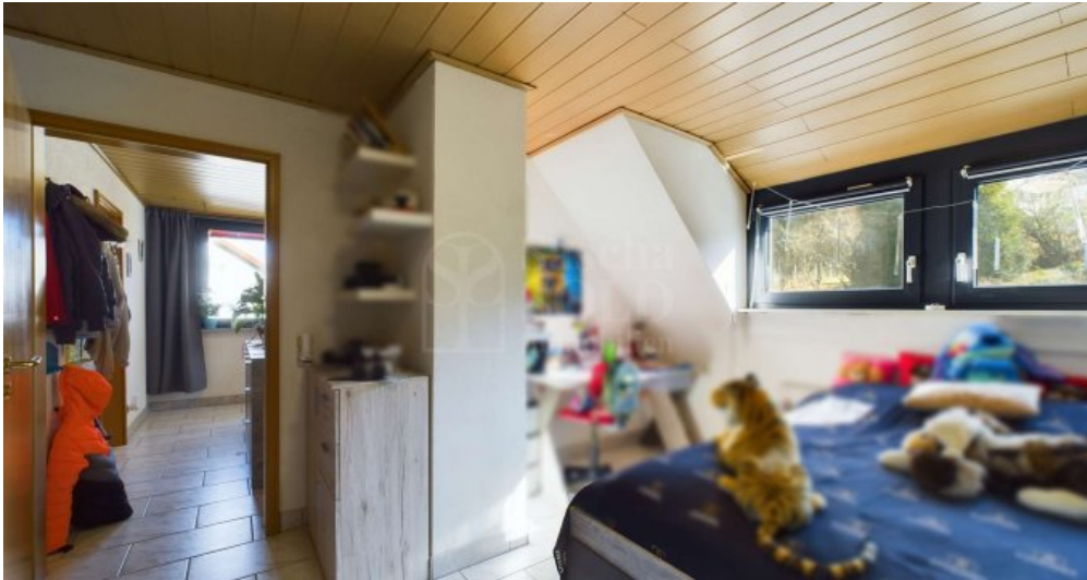
DG - Kinderzimmer 2