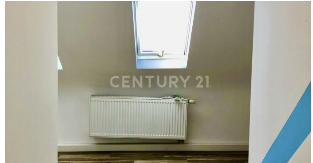
2. Schlafzimmer OG