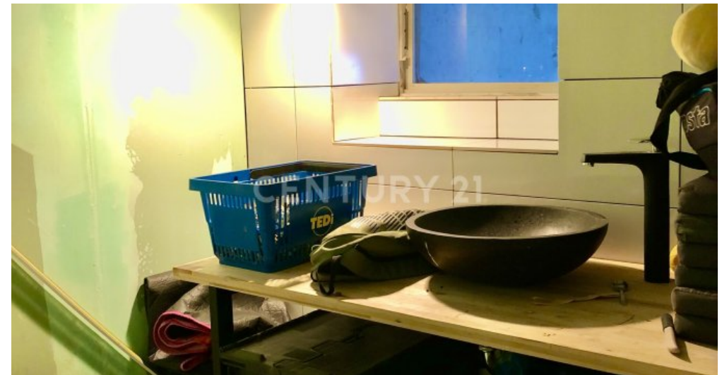
WC im Keller