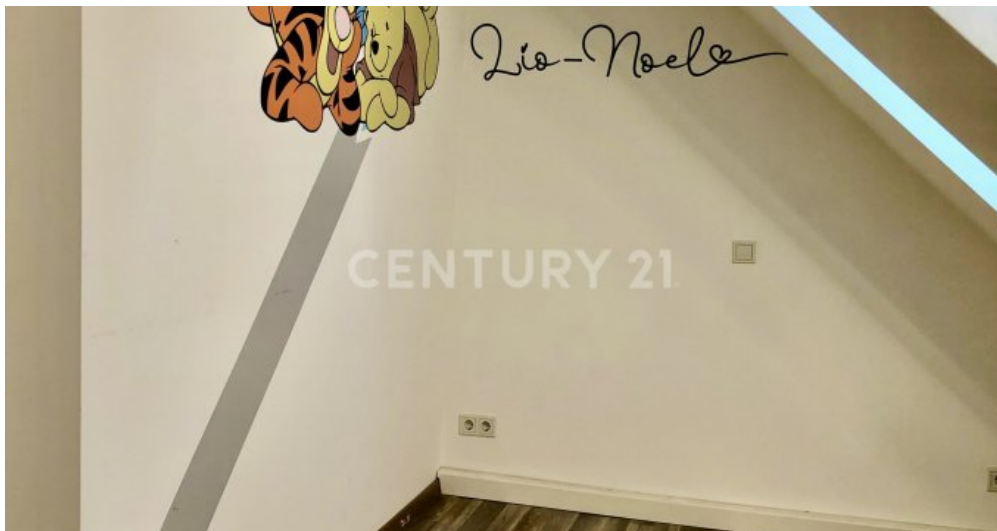
2. Schlafzimmer OG