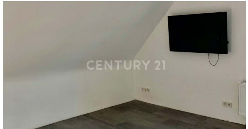
1. Schlafzimmer OG