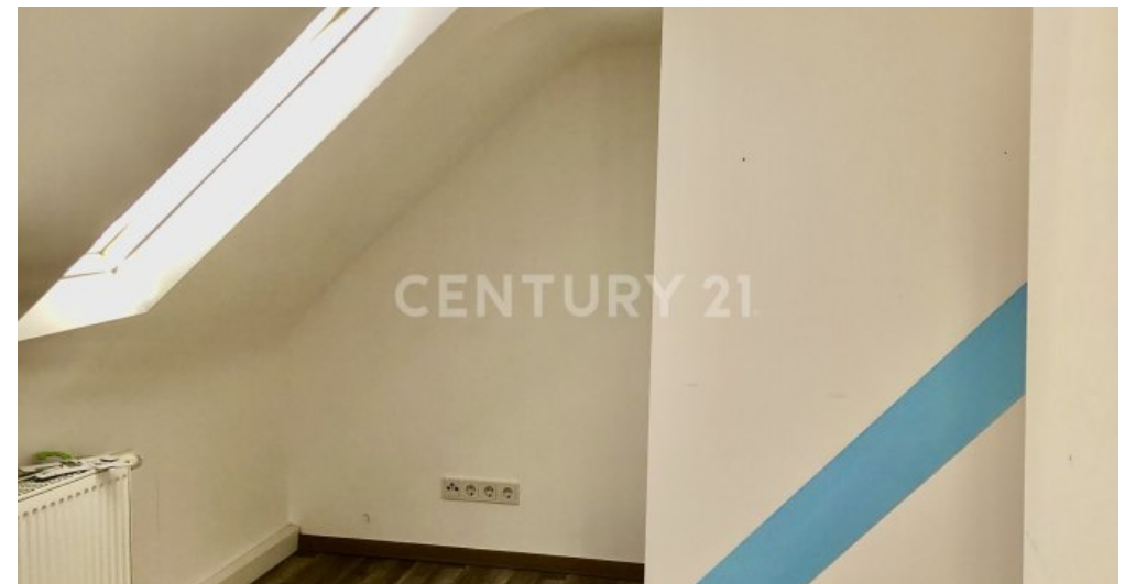
2. Schlafzimmer OG