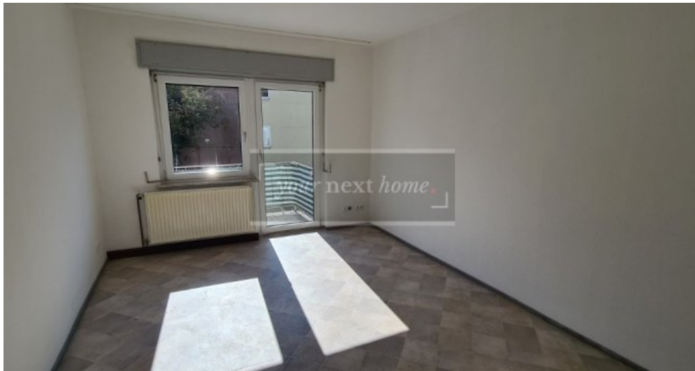
Zimmer mit Balkon