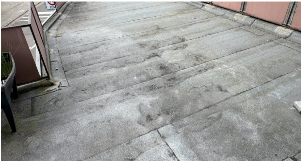
Terrasse ohne Garten