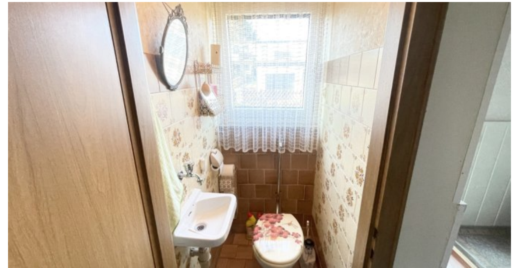
Gäste WC EG