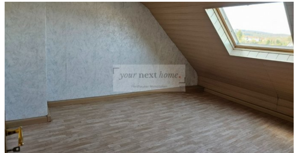
Durchgangszimmer 2 OG