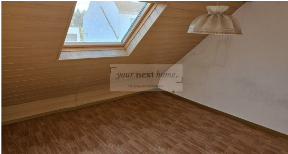
Zimmer 3 OG