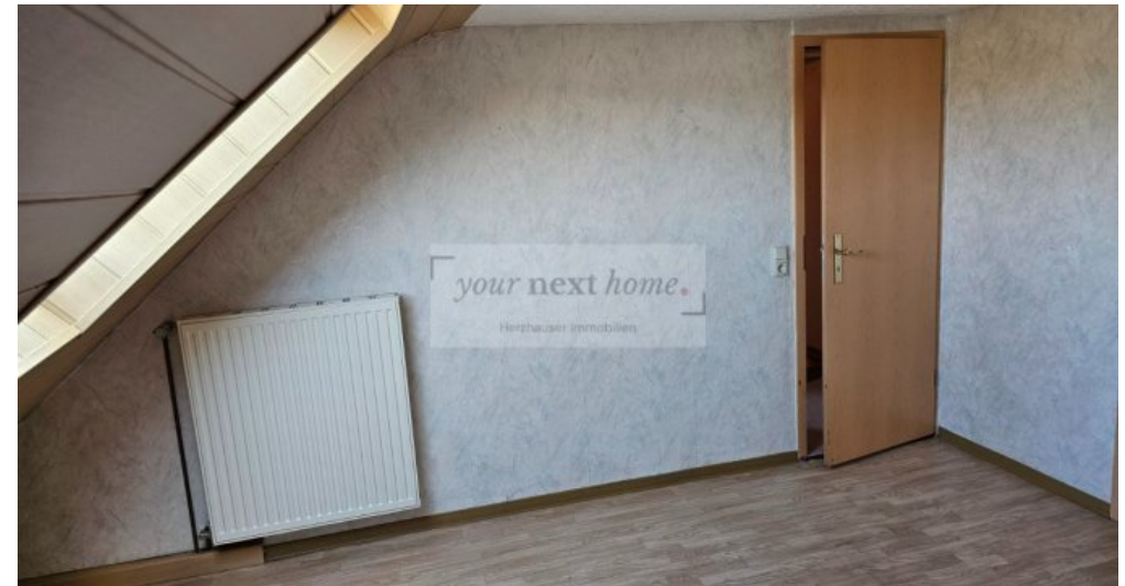
Zimmer 3 OG