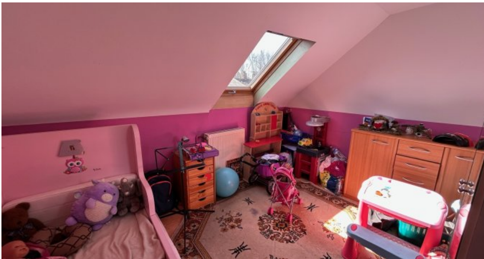
Kinderzimmer 2. OG Hauptwohnung