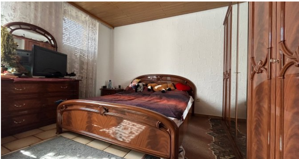
Zimmer 2 Hauptwohnung