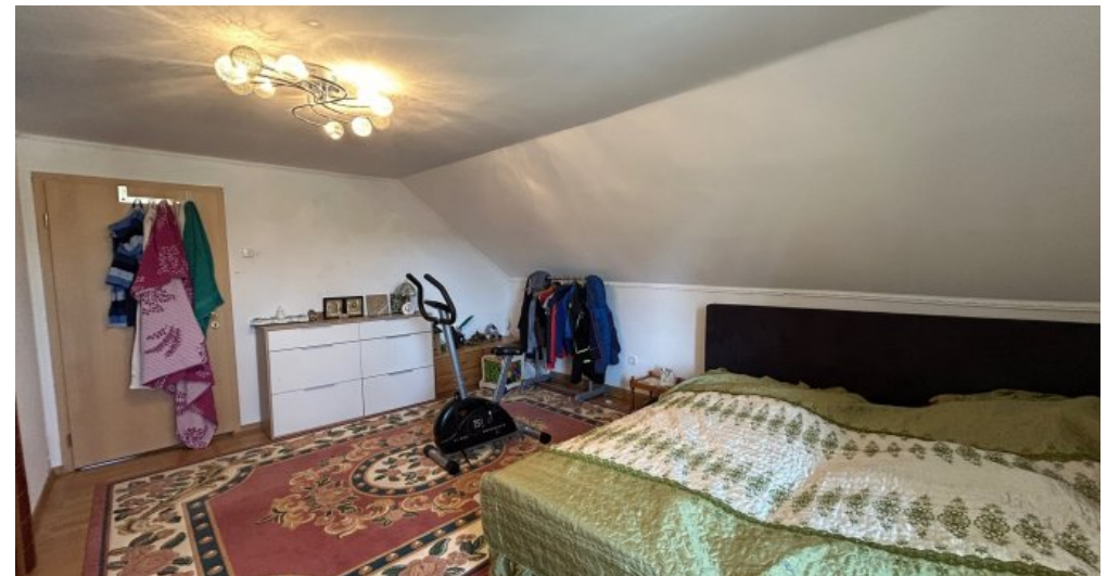
Schlafzimmer 2 im 2. OG Hauptwohnung.....