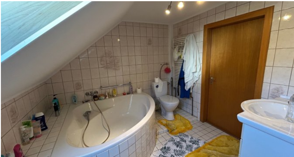
Bad im 2.OG Hauptwohnung.