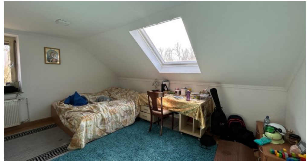
Schlafzimmer im 2. OG Hauptwohnung