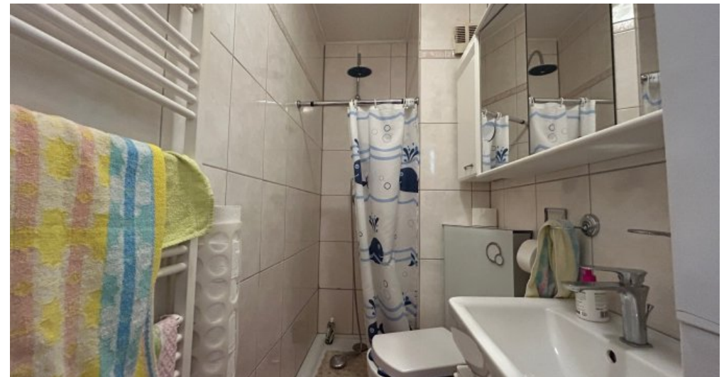
Bad 1 im 1.OG Hauptwohnung