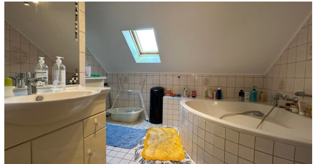
Bad im 2.OG Hauptwohnung