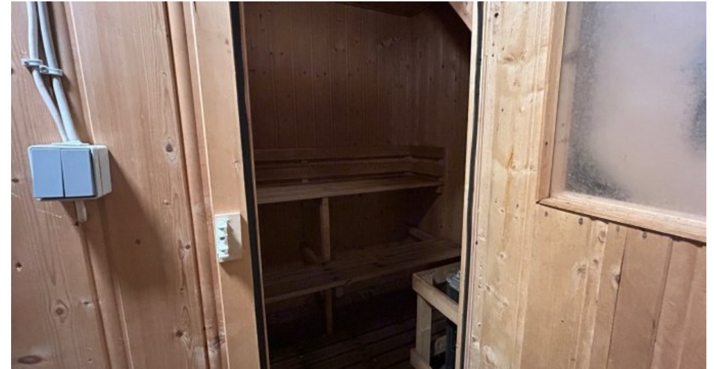
Sauna im Keller