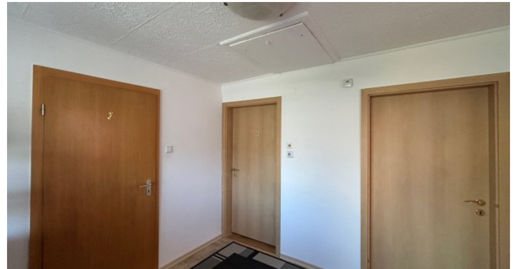
Flur 2. OG Hauptwohnung