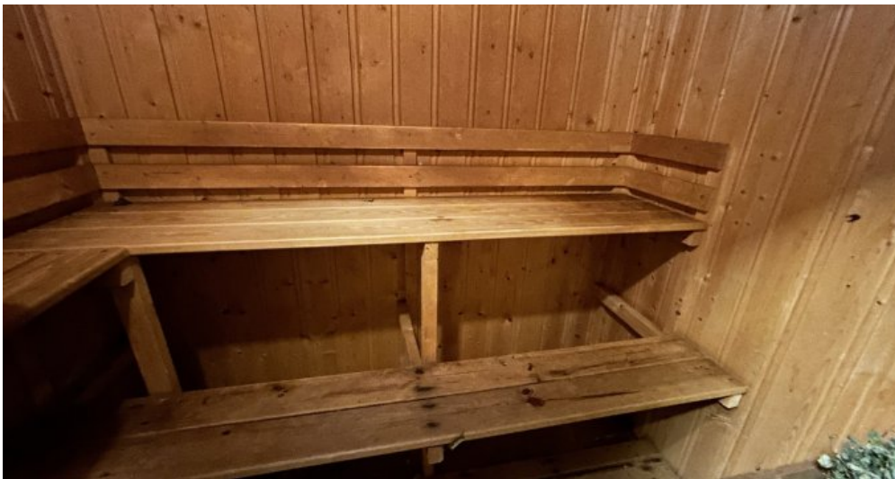
Sauna im Keller...