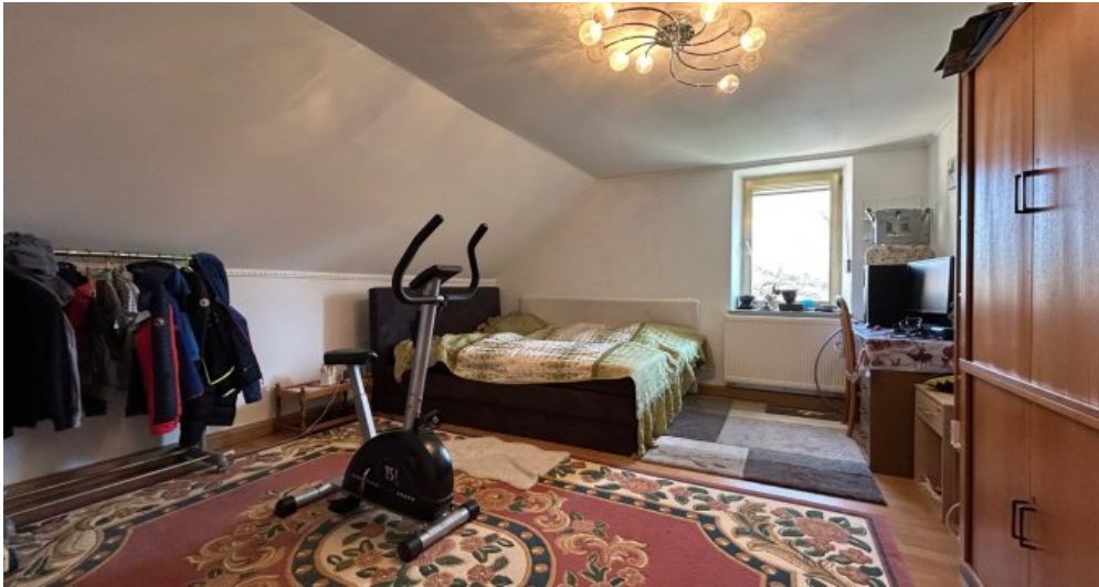
Schlafzimmer 2 im 2. OG Hauptwohnung...