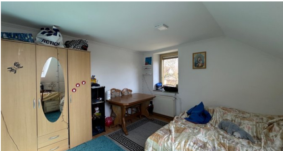
Schlafzimmer im 2. OG Hauptwohnung...