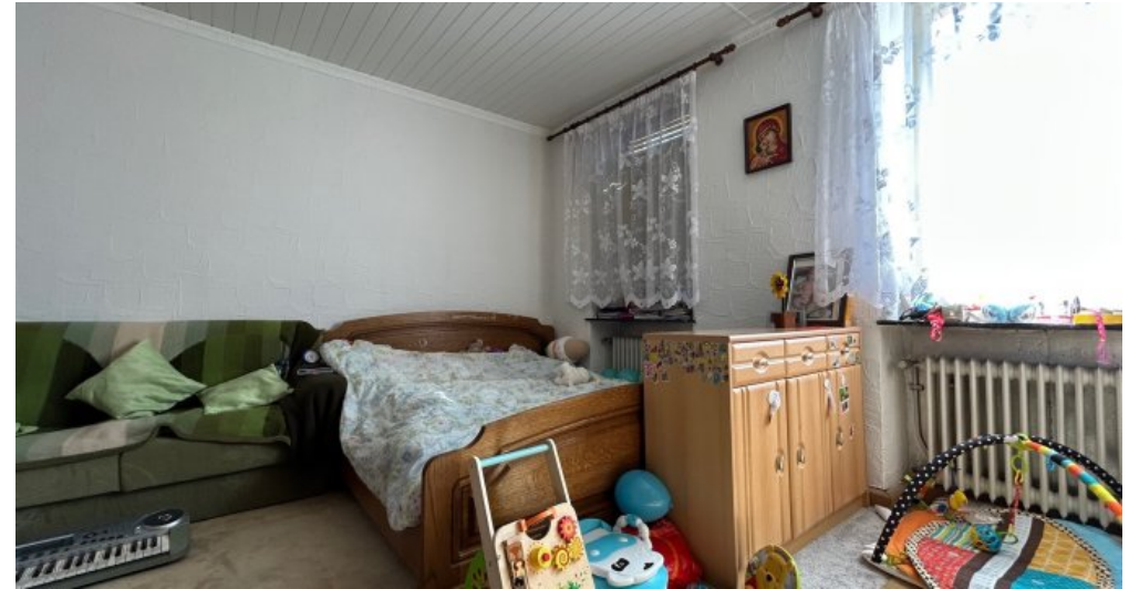
Zimmer 1 Hauptwohnung